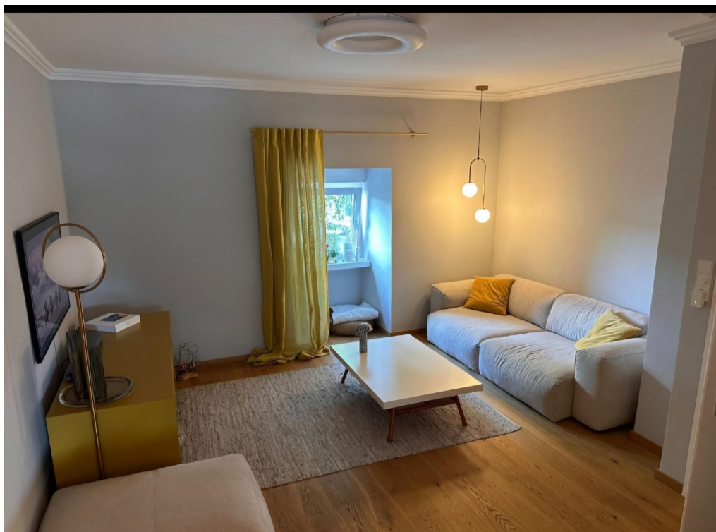
Offener Wohn Essbereich