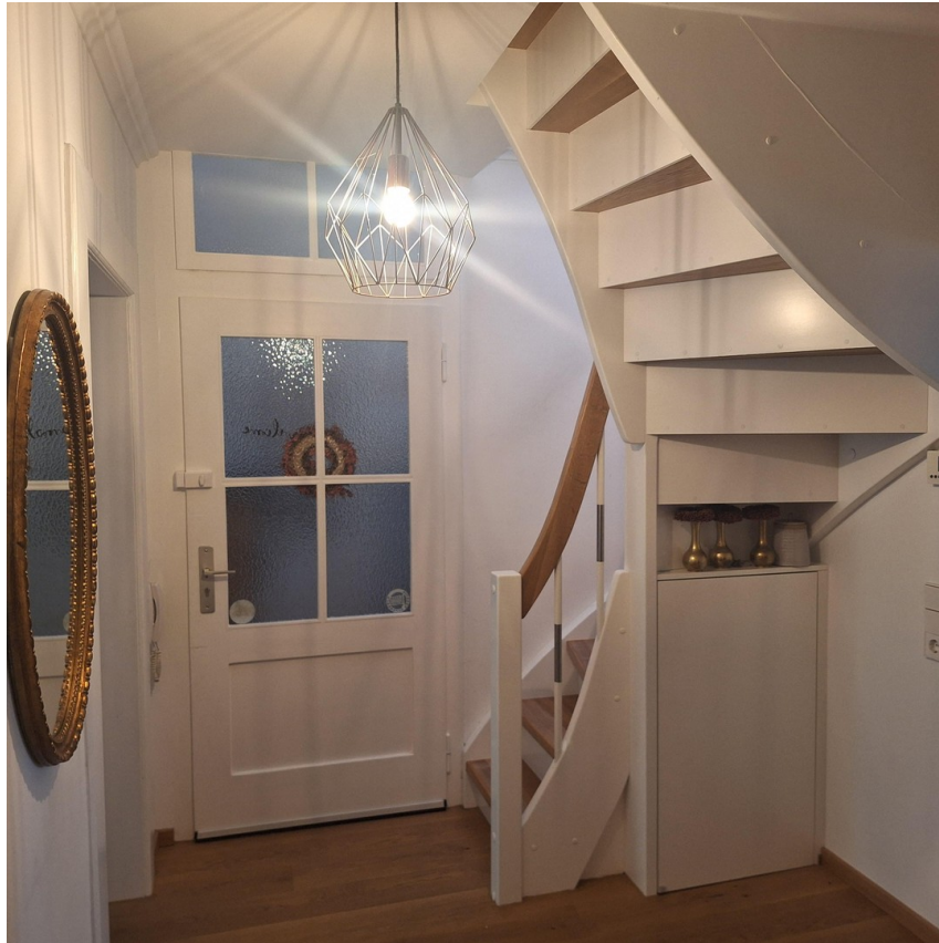
Eingangsbereich und Treppe