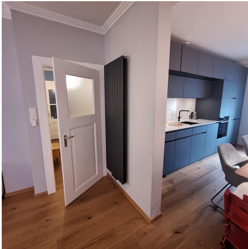
Offener Wohn Essbereich