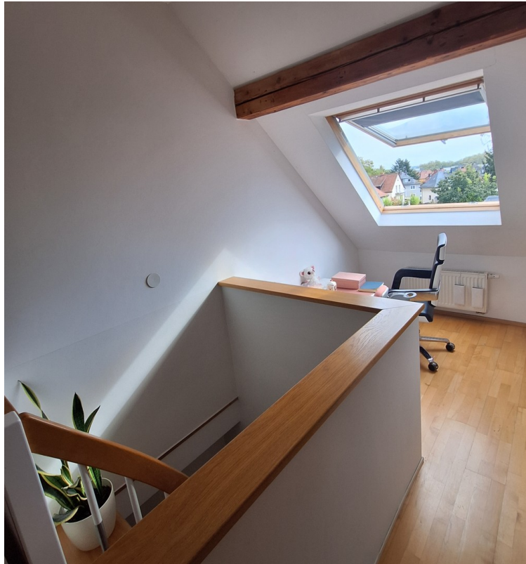
Büroecke mit Blick ins Grüne