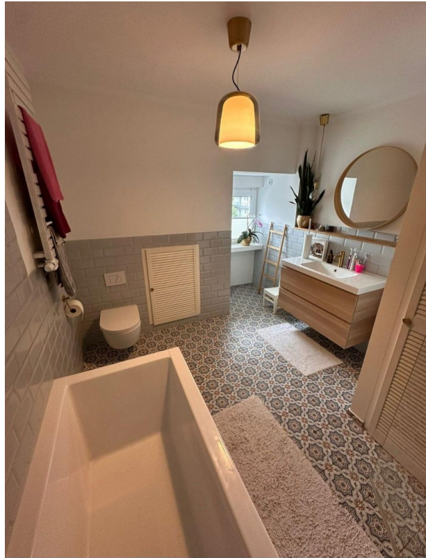
Bad mit Fussbodenheizung