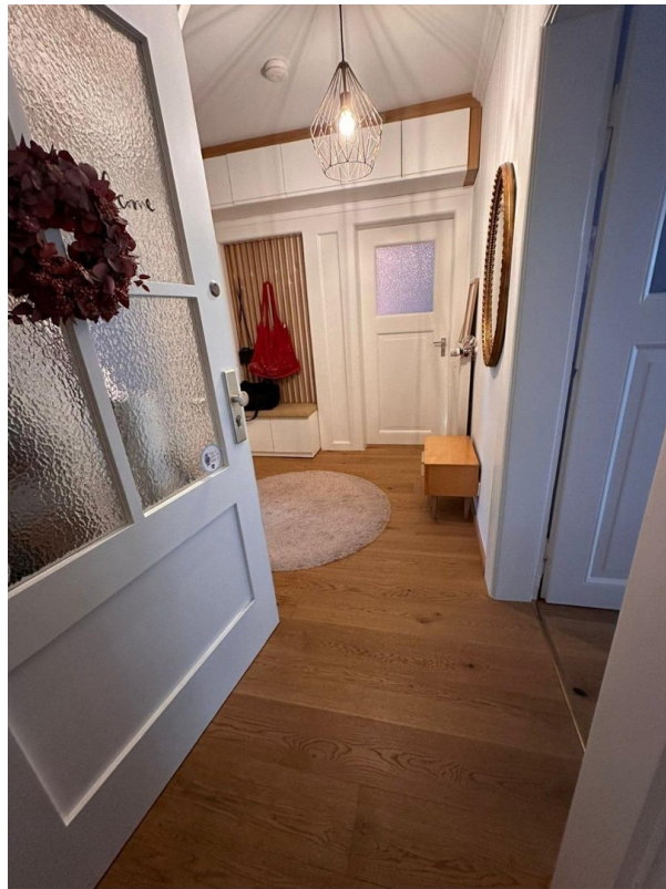
Eingangsbereich und Flur