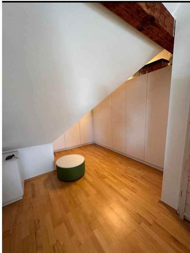
Einbauschränk im Obergeschoss