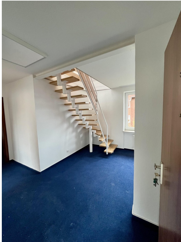
Aufgang zum Wohnbereich