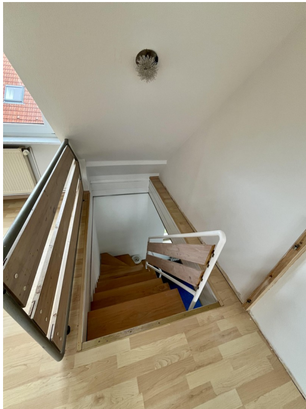
Treppe zum Wohnbereich