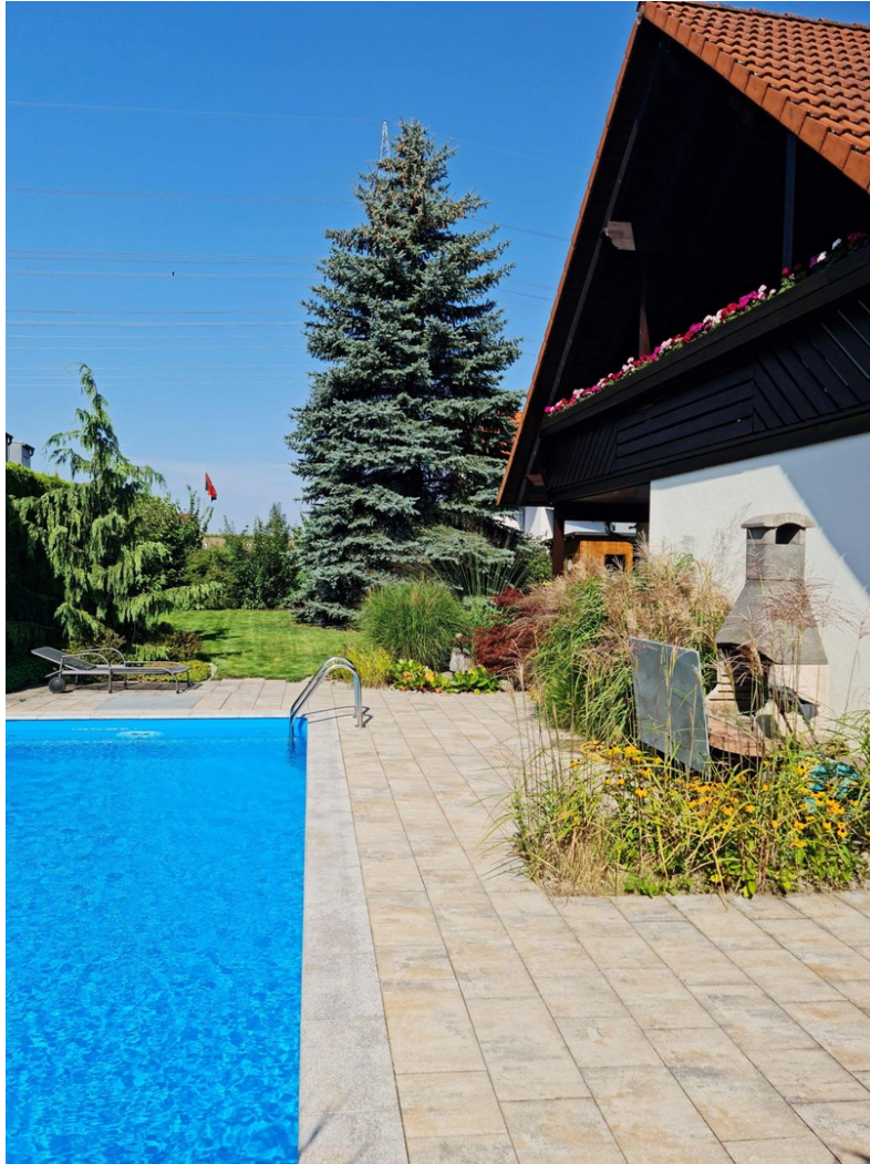
Garten mit Außenpool