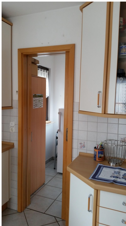
Nebenraum der Küche