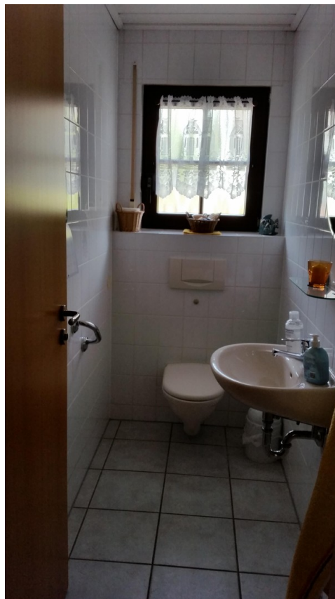
Gäste WC EG