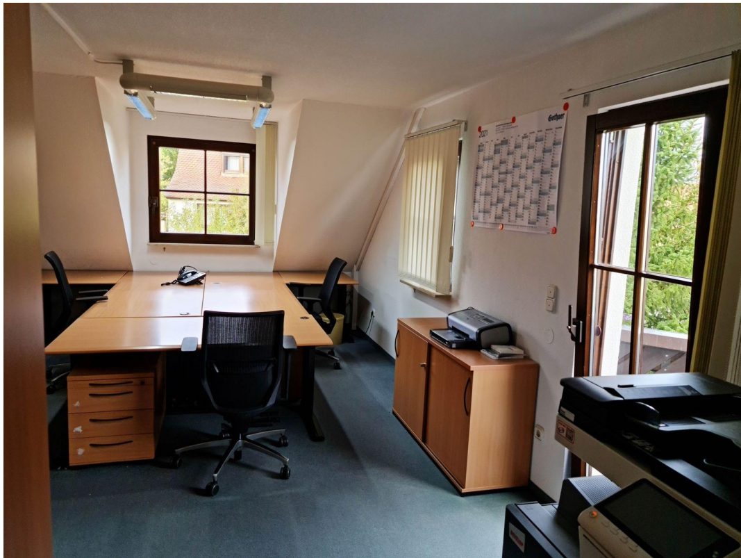
OG Büro 3 o. Wohnraum