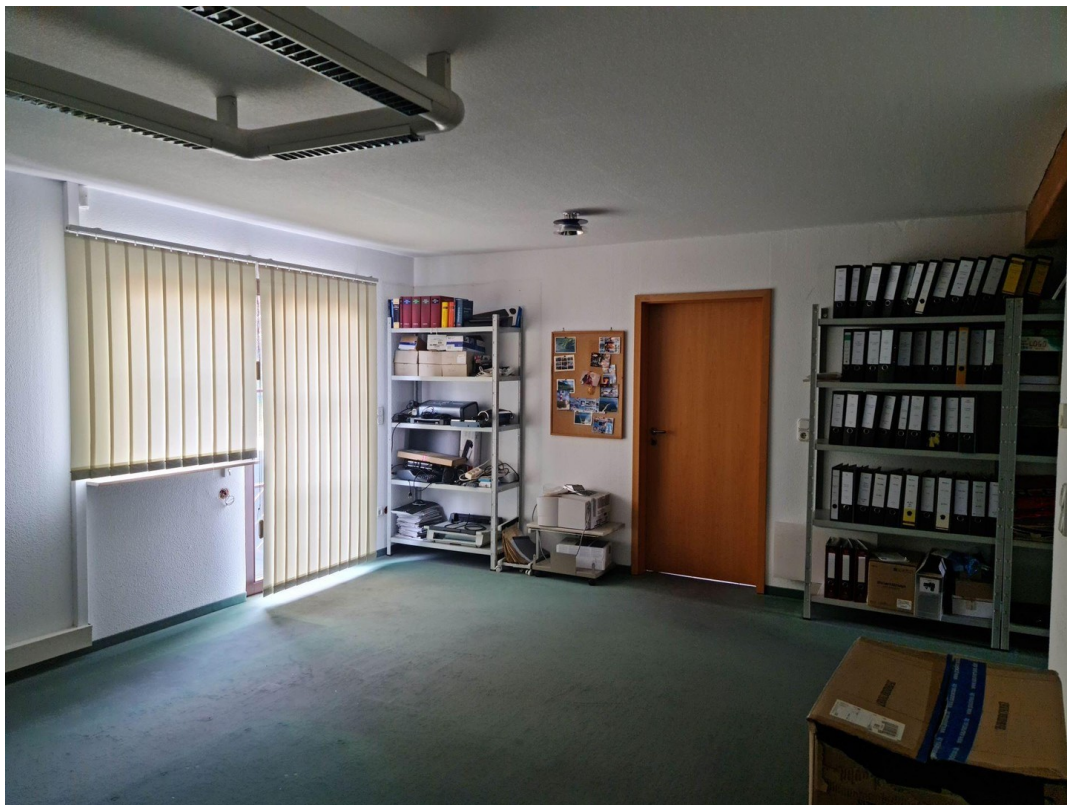
OG Büro 1 o. Wohnraum