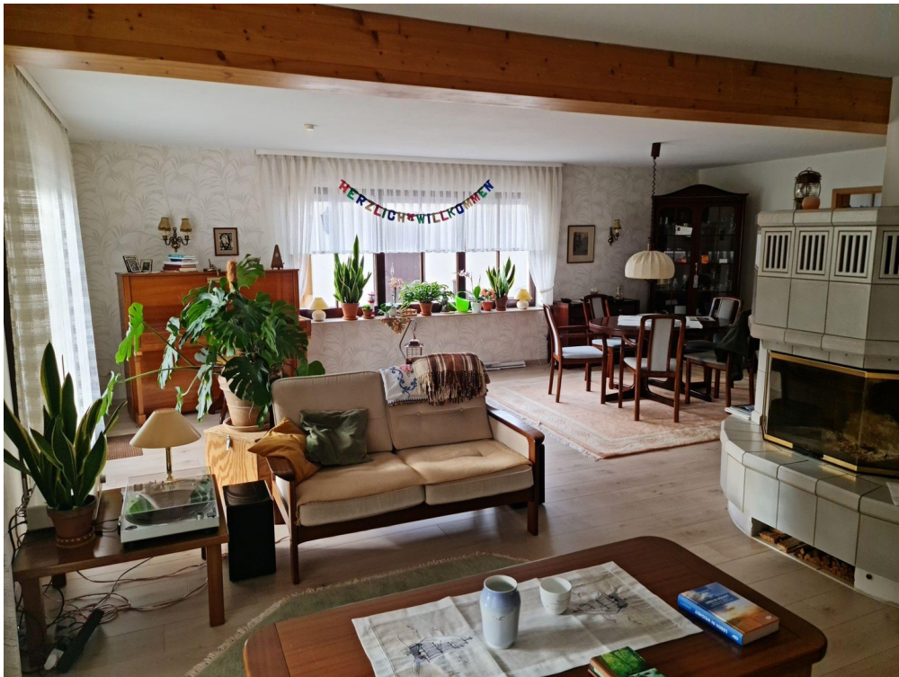
Wohn- und Essbereich EG