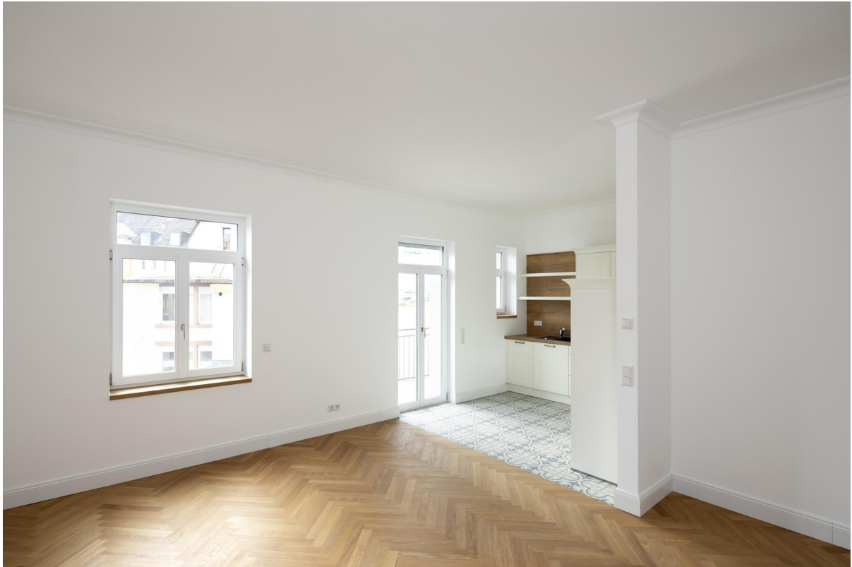
Küche mit Austritt Balkon