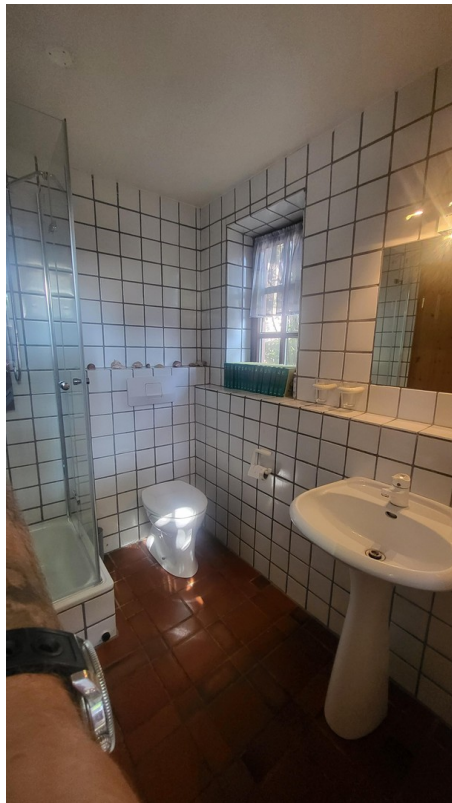
Gäste WC EG