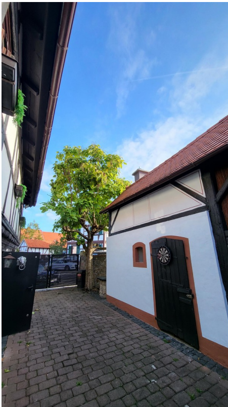
Wasch- und Heizraum