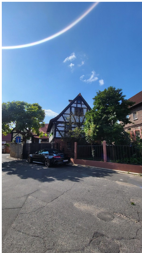
Eingangsbereich und Vorgarten