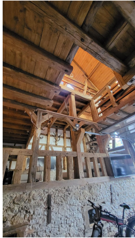
Scheune mit Blick n. oben