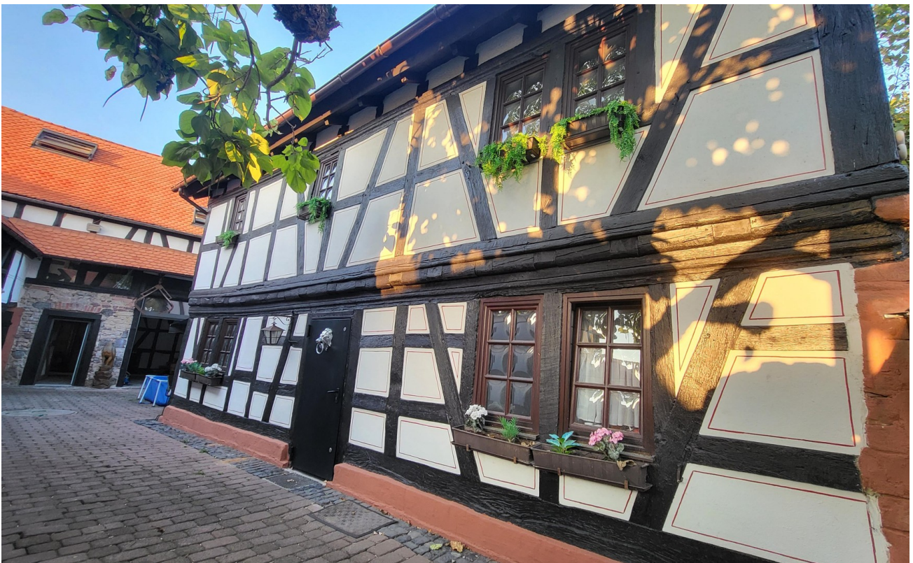
Seitenansicht Haus / Innenhof