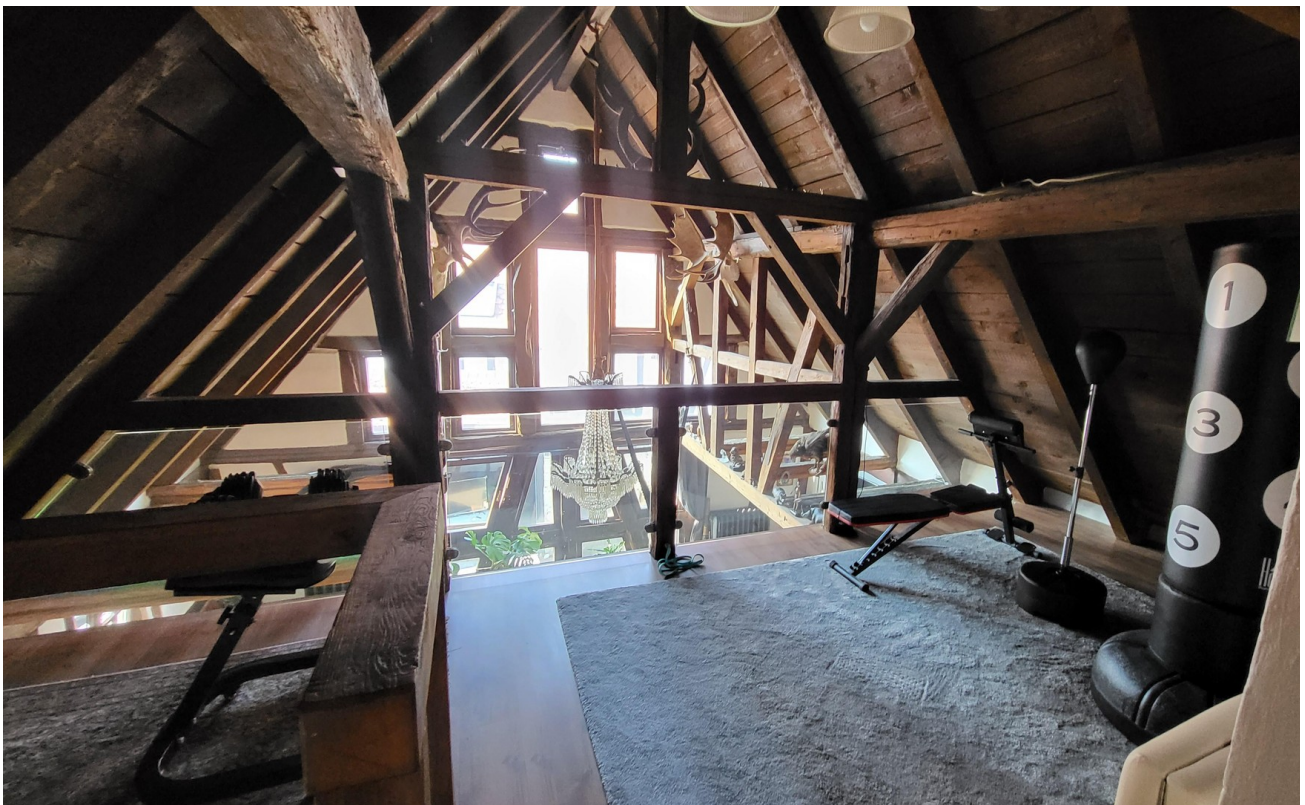
Galerie vor Schlafzimmer