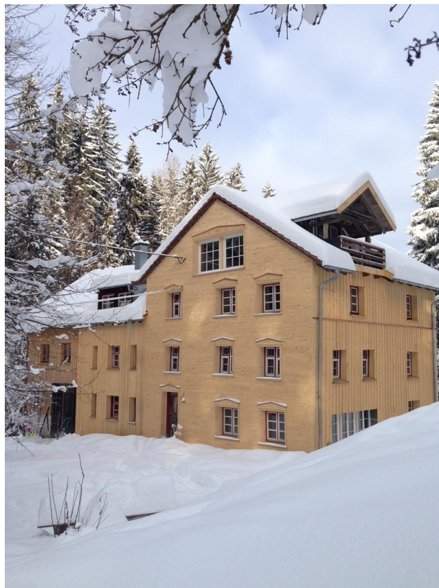
Fertigstellung Januar 2017