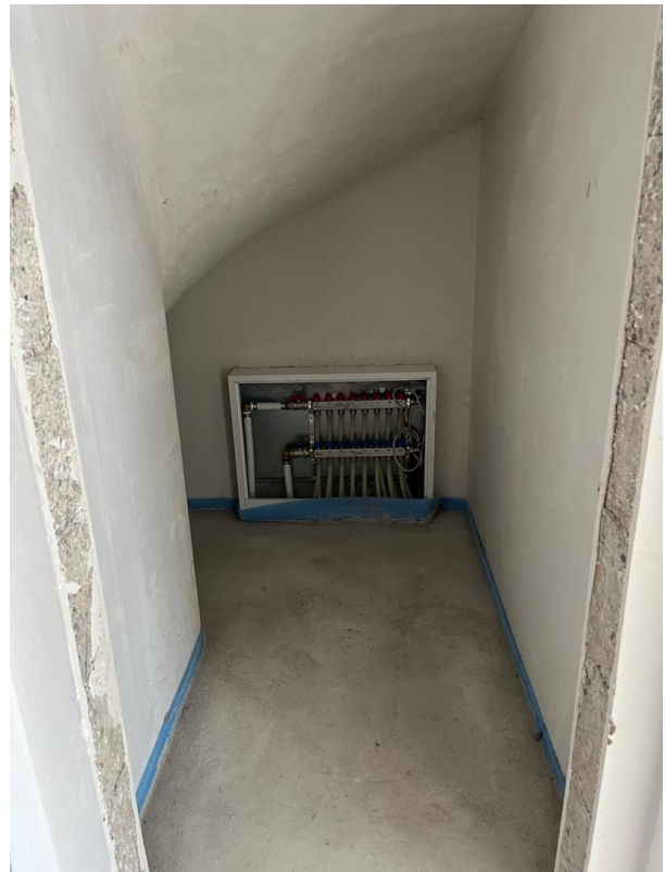
Abstellraum unter Treppe