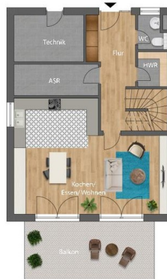
W2, EG, Haus A