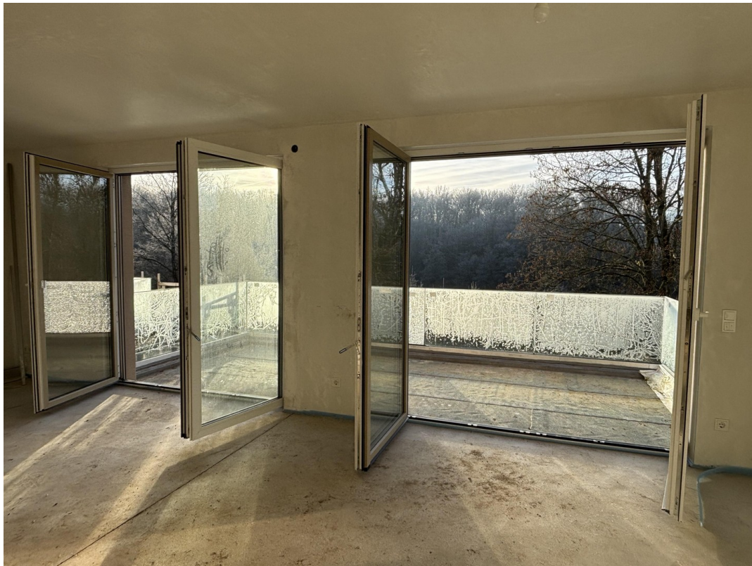
Zugang zum Balkon