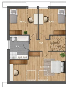
W2, OG, Haus A