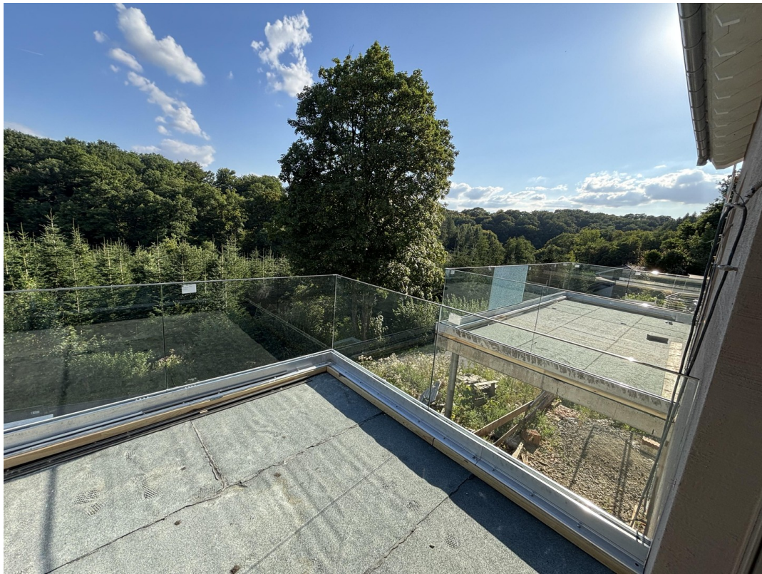
Balkon Blick 3