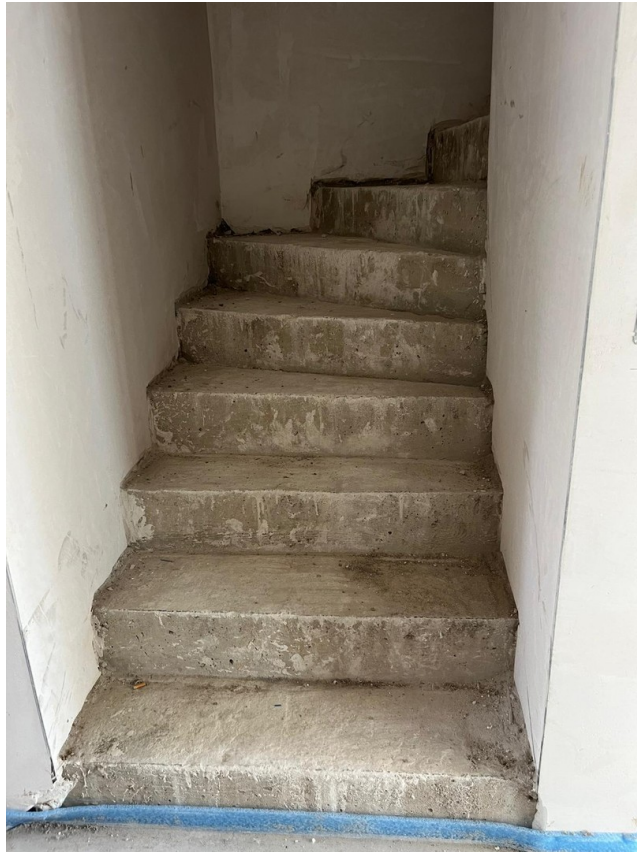
Treppe von EG zu DG