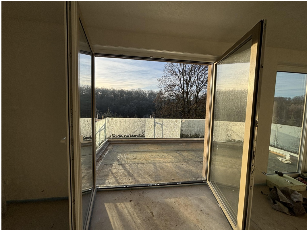
Wohnzimmer Balkon Bild 1