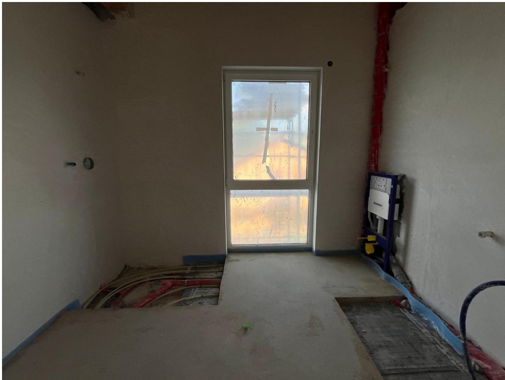
Badezimmer Bild 2