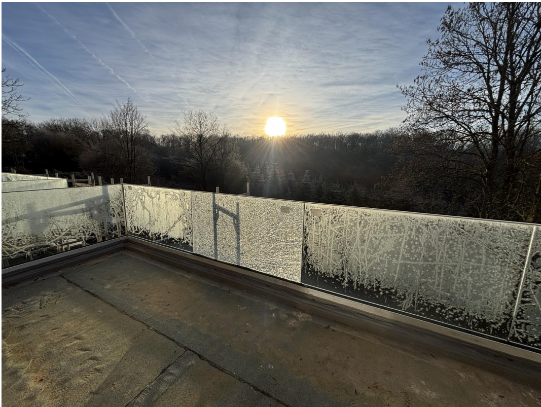
Balkon Blick 2