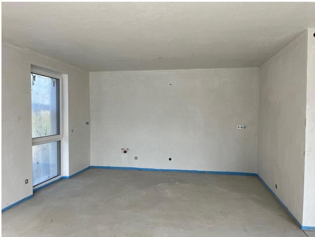
Wohnzimmer Bild 1