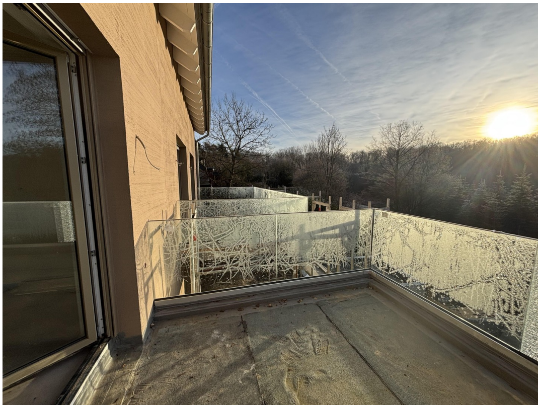
Balkon Blick 1