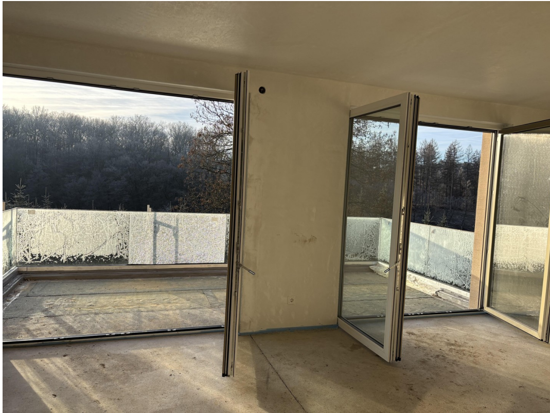
Wohnzimmer Balkon Bild 2