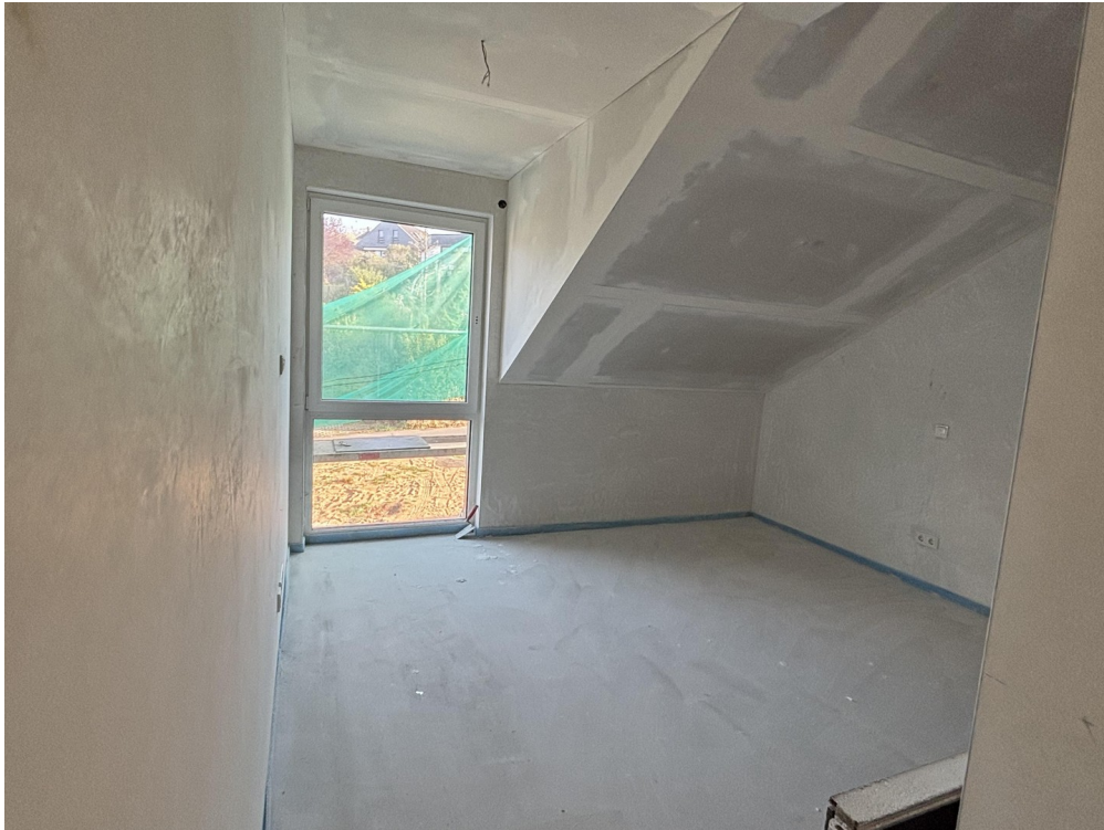
Zimmer 1 DG