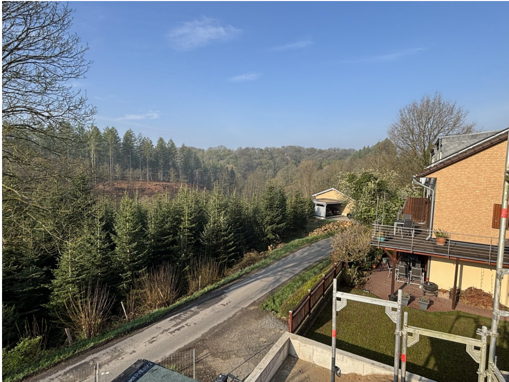
Ausblick vom Balkon Bild 1