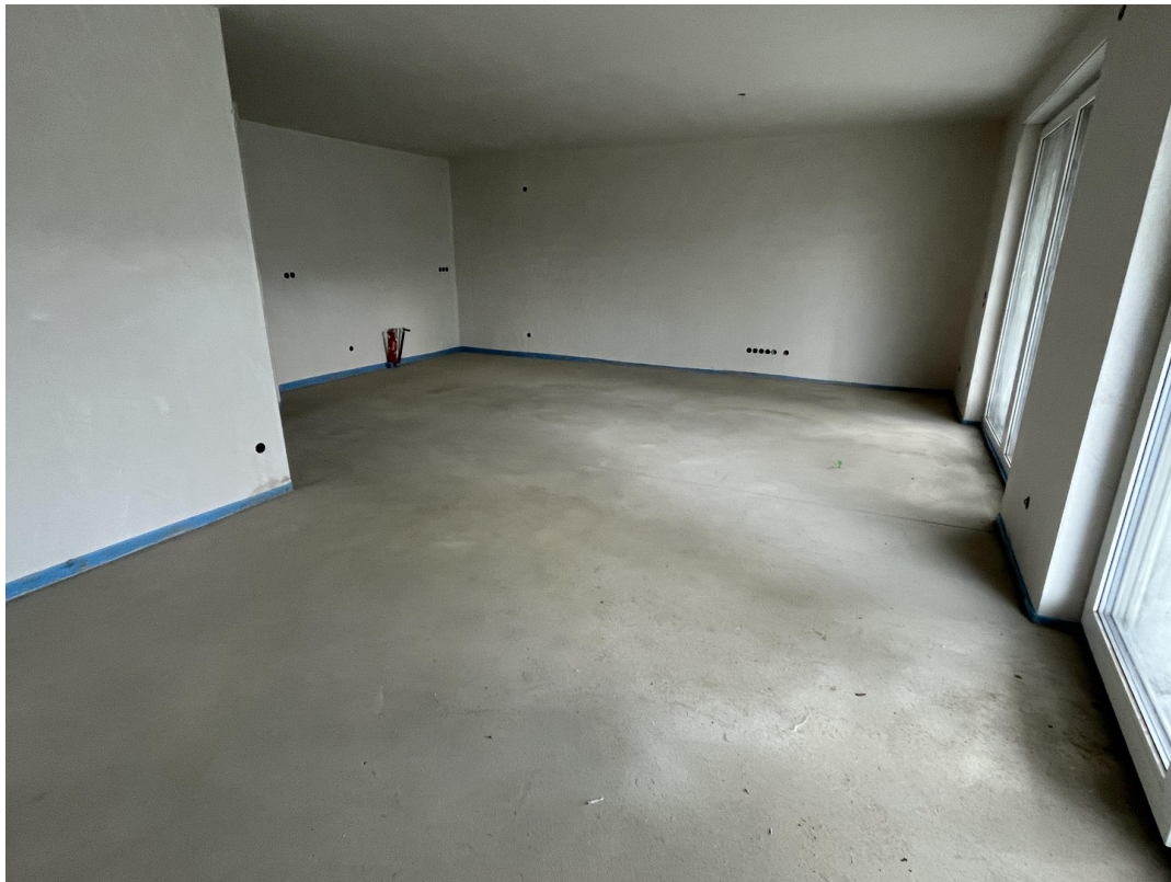
Wohnzimmer Bild 1