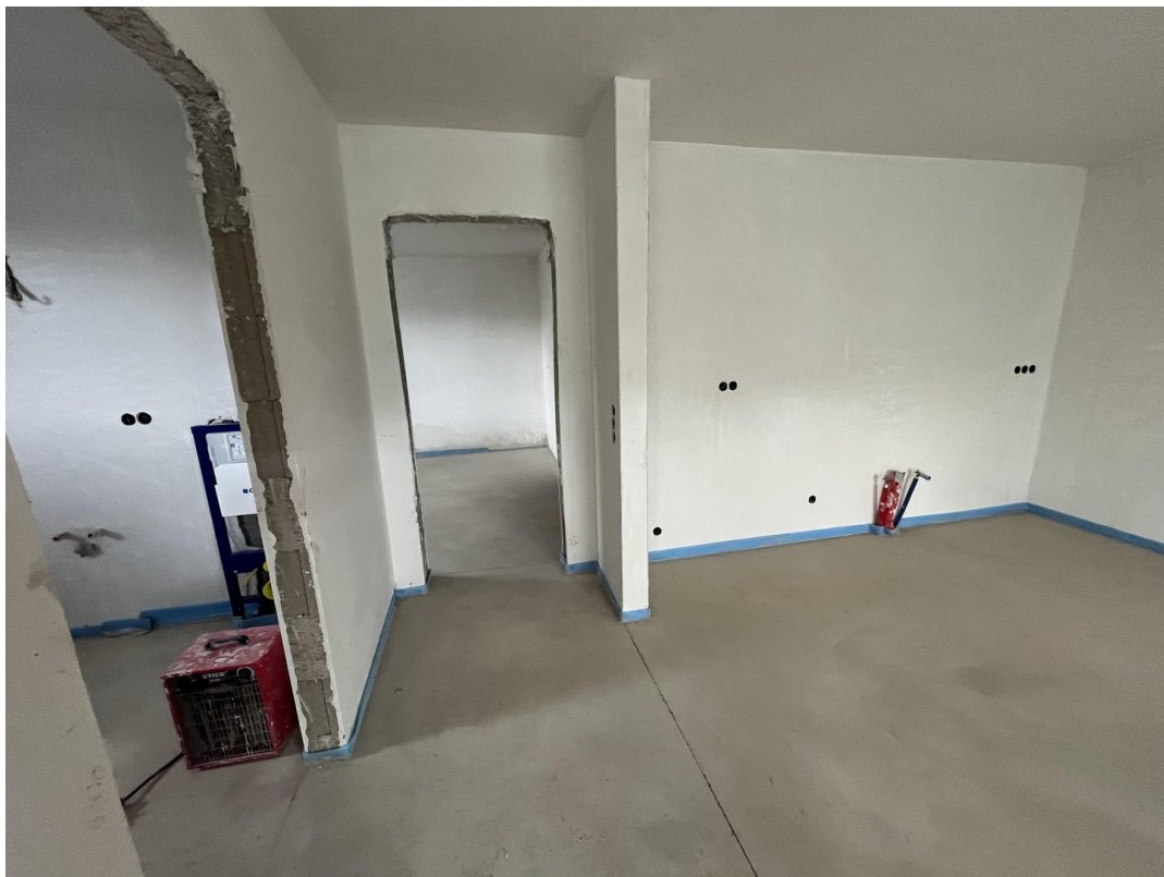
Wohnzimmer Bild 3