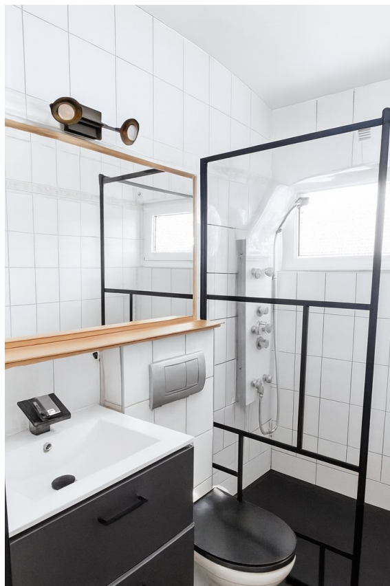
moderne, offene Dusche