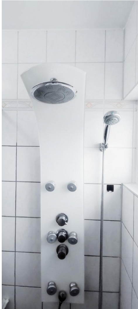
Duschpaneel in Badezimmer