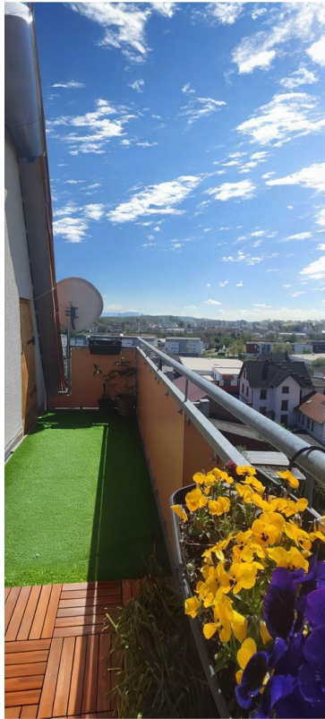
9,25m grosser Balkon