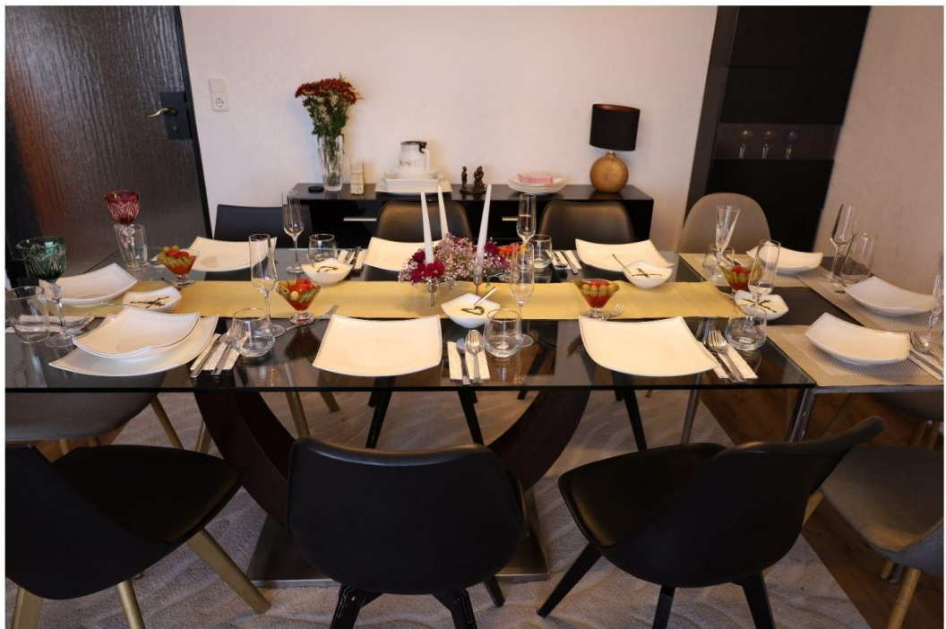
Wohnzimmer mit Glastisch