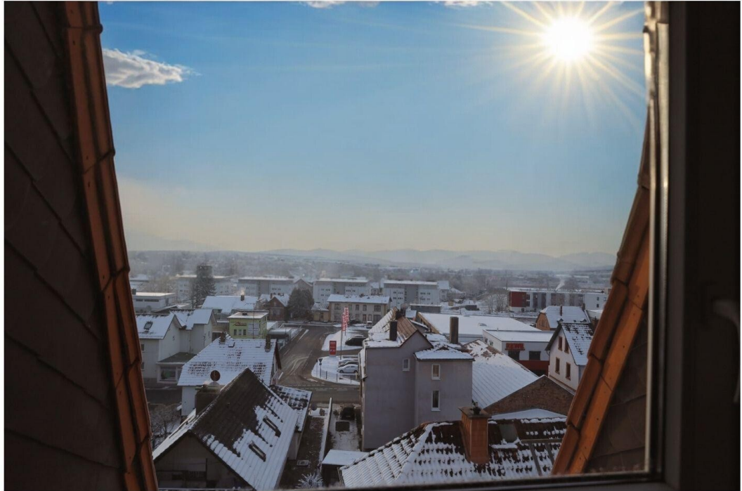
Ausblick aus der Küche