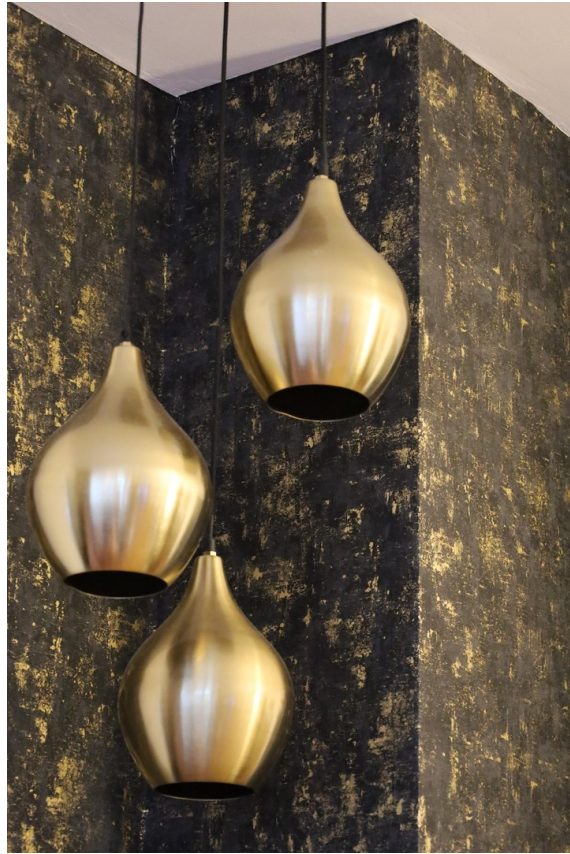
Moderne Deko im Wohnzimmer