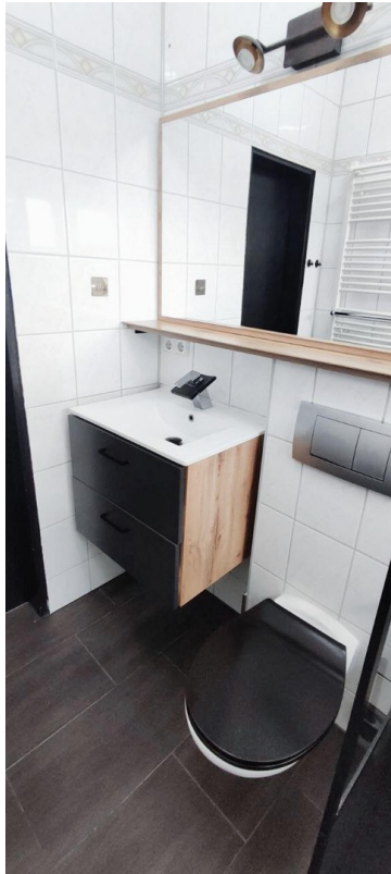
Badezimmer mit grossem Spiegel