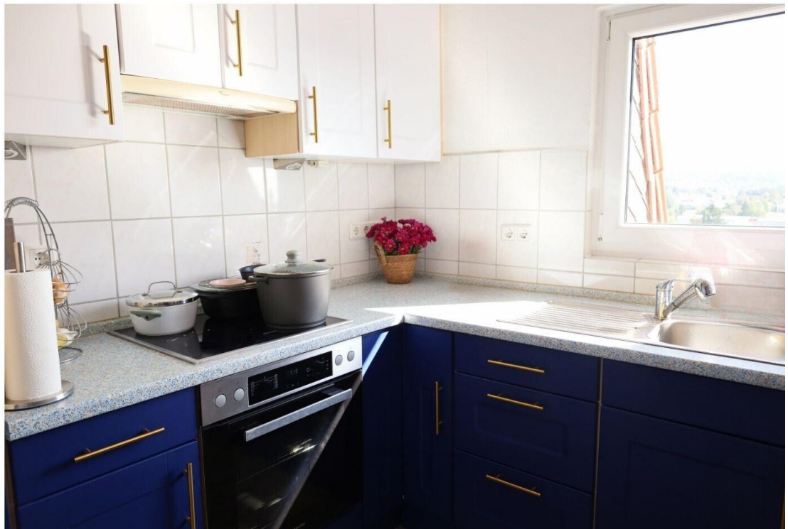
Herd, Spülmasch., Kühlschrank