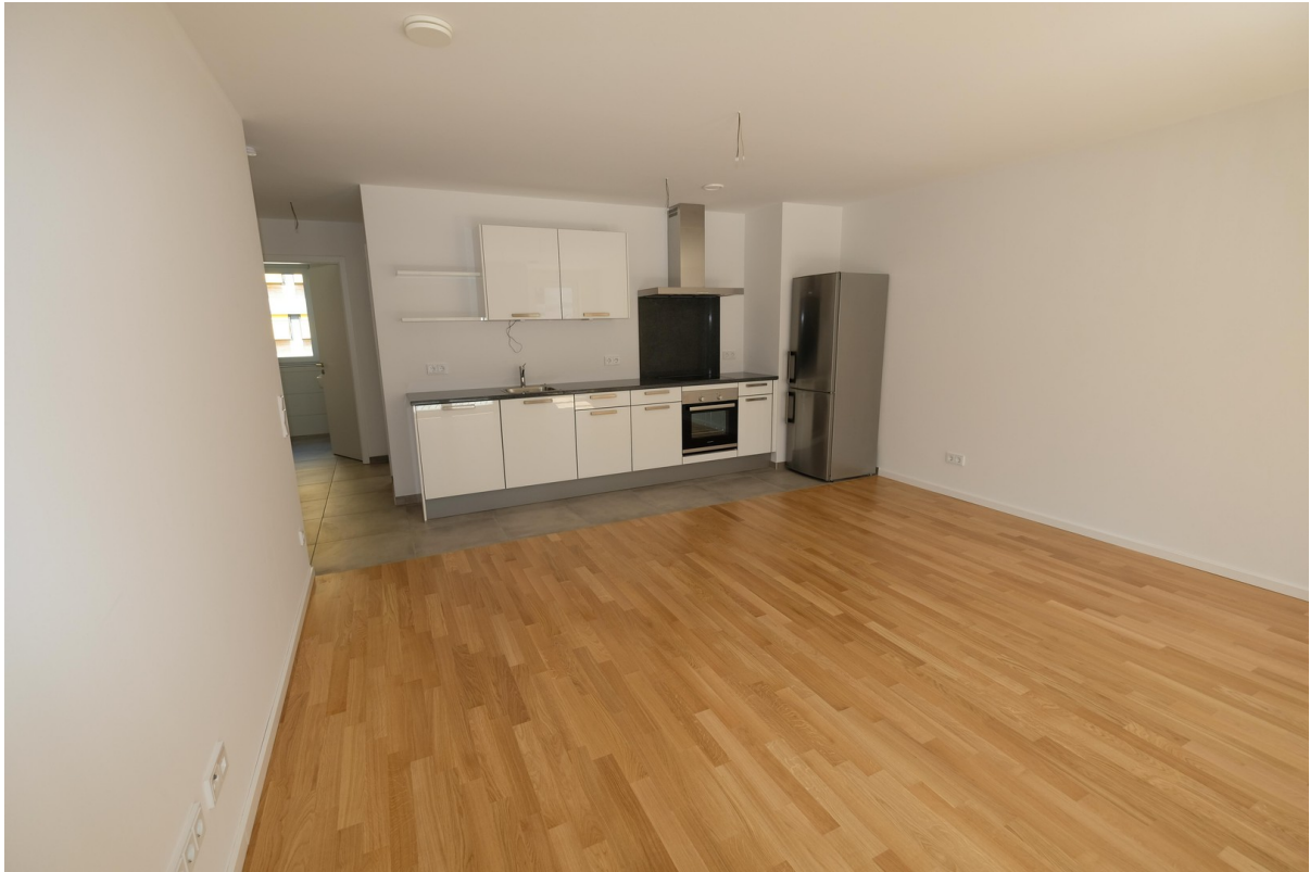
Wohnzimmer mit Küchenzeile