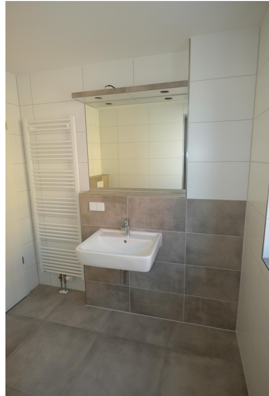
Waschbecken mit Spiegel