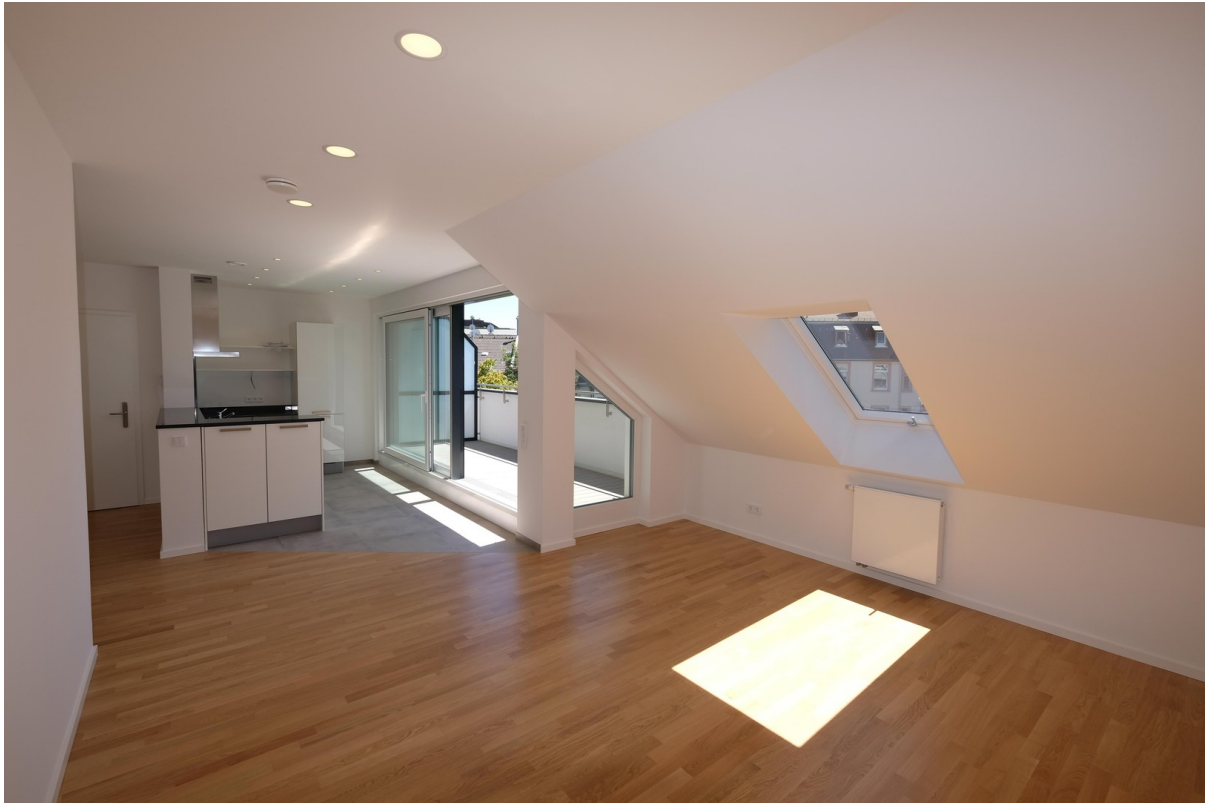
Wohnzimmer mit Küchenzeile