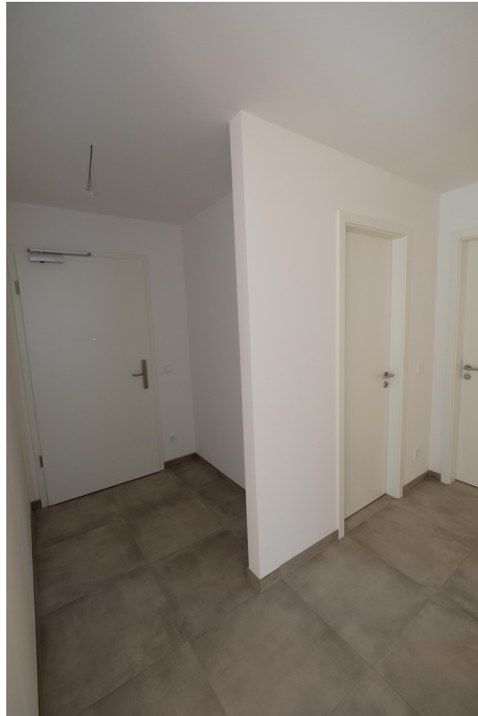
Flur und Eingangsbereich