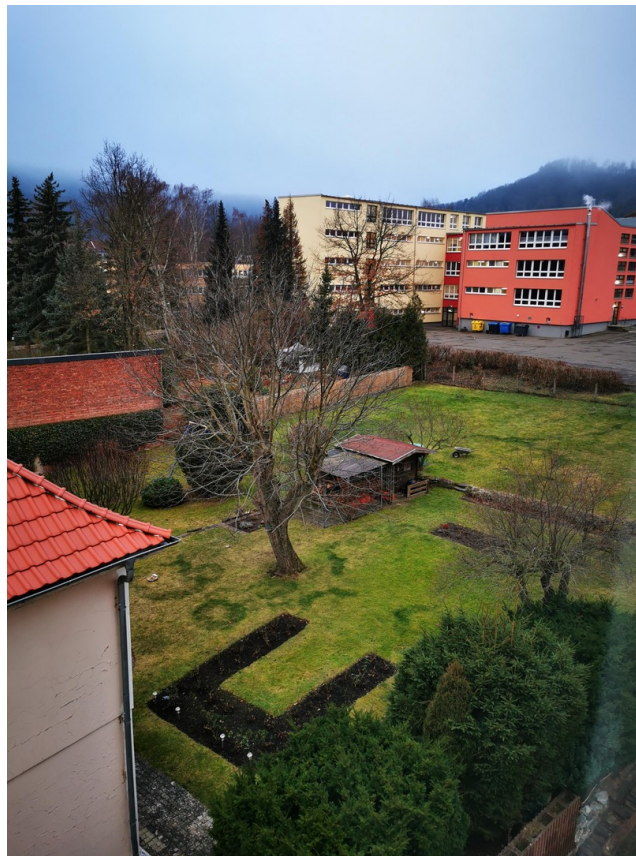
Schule in direkter Lage