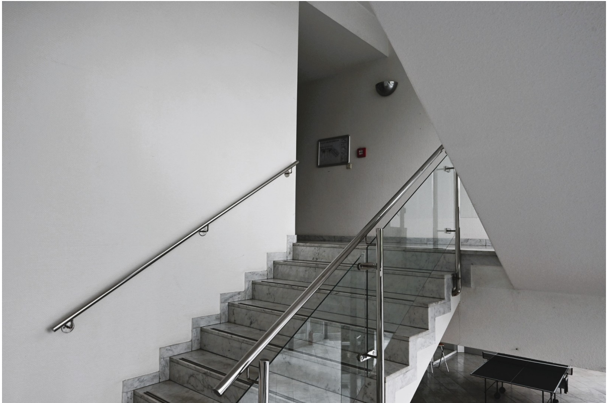
Treppenhaus zum OG I