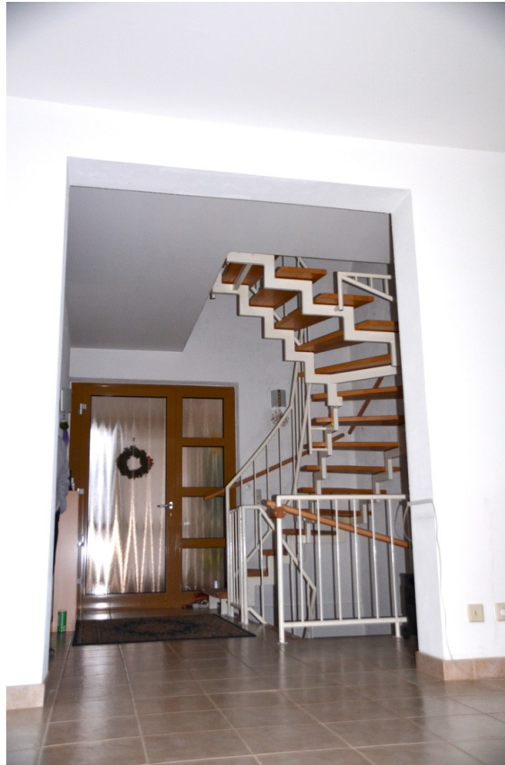
Diele im EG