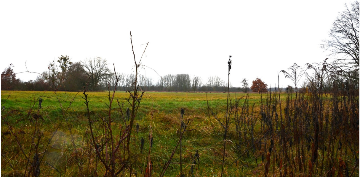
Blick vom Grundstück