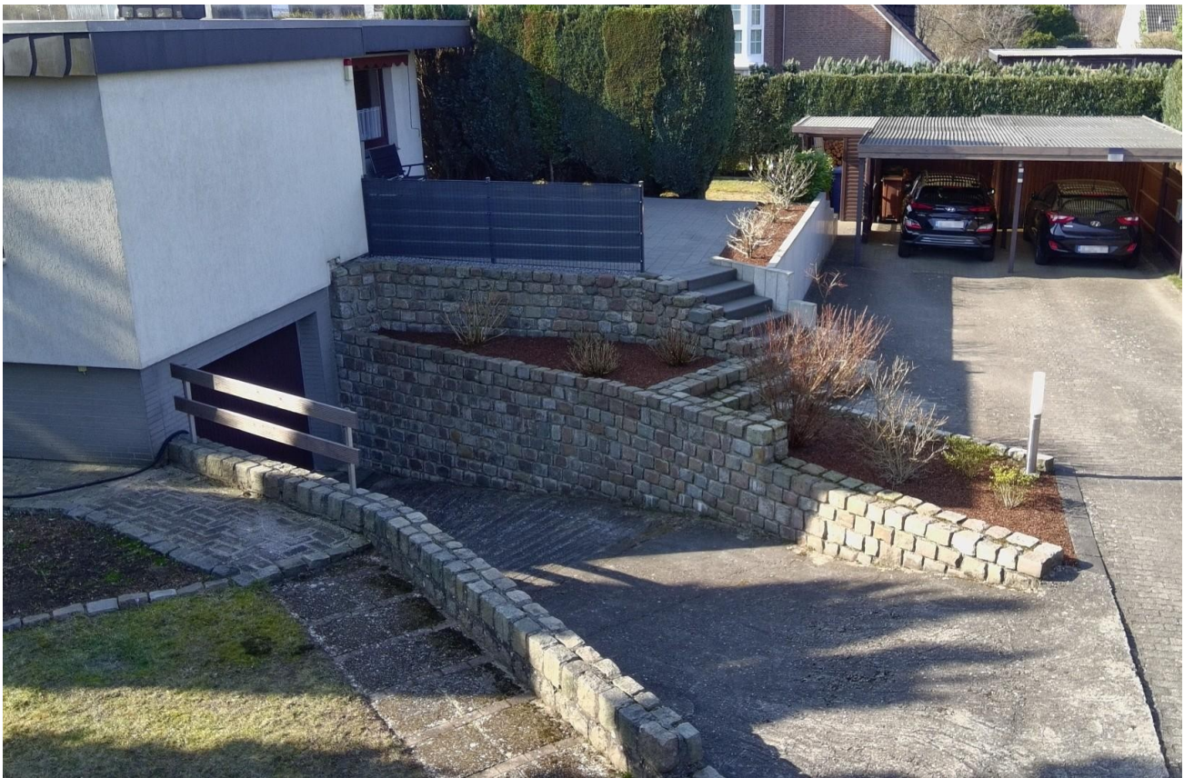
Garage, Carport, Stellplätze