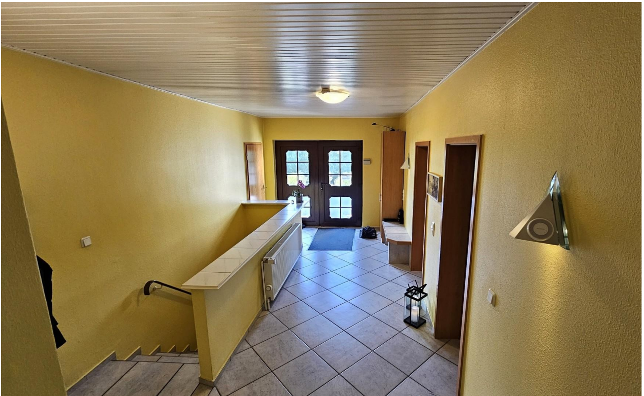
Flur von innen zur Haustür