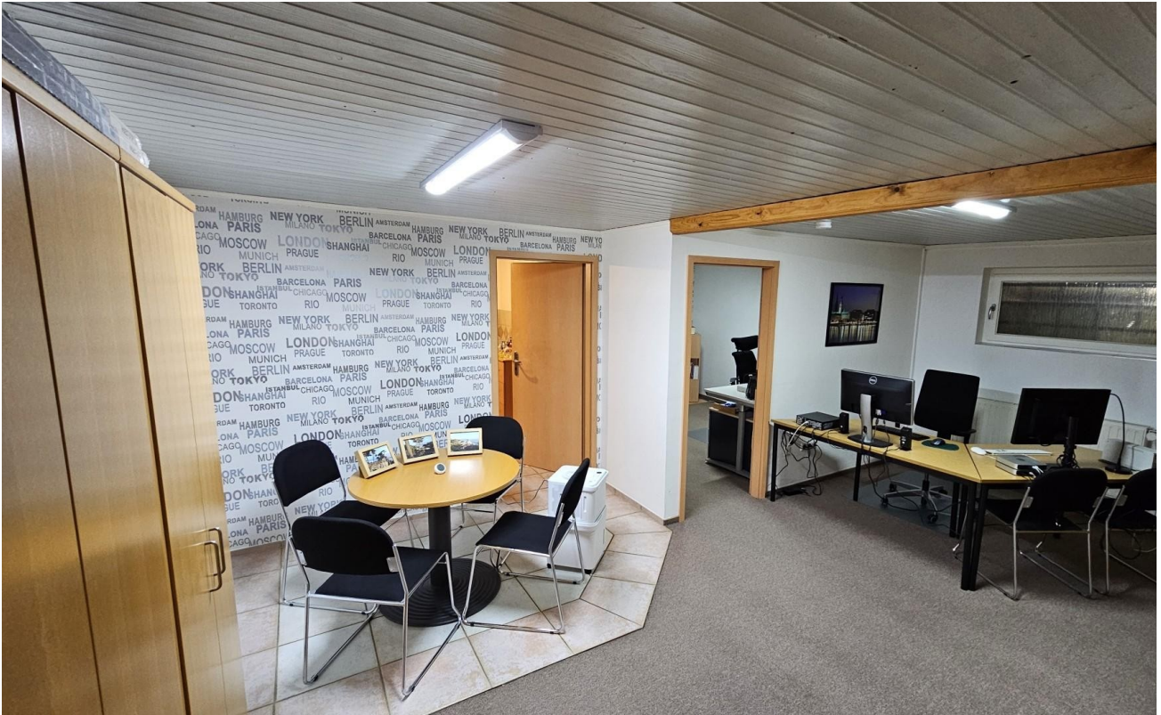
Keller - Arbeitszimmer1