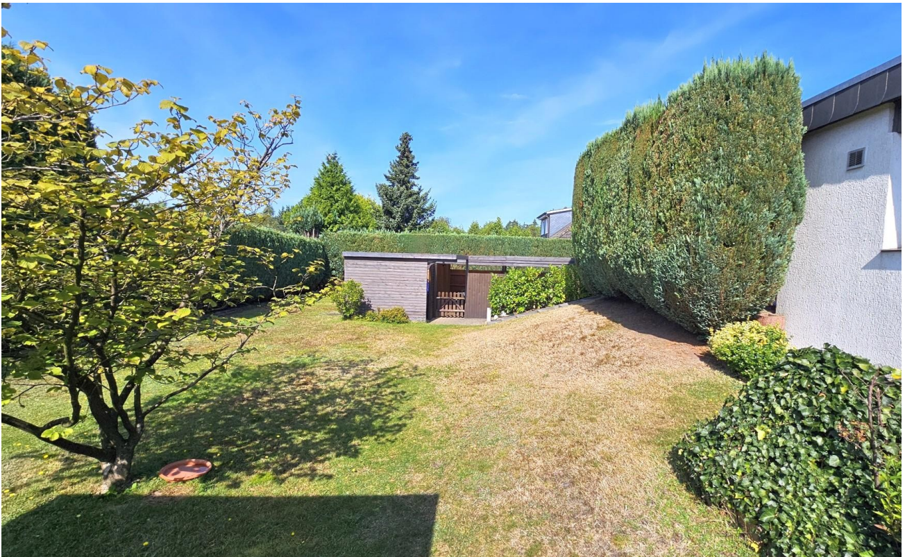
Rückseite - Garten