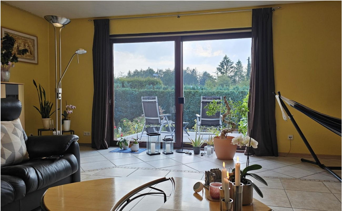
Wohnzimmer Blick vom Sofa