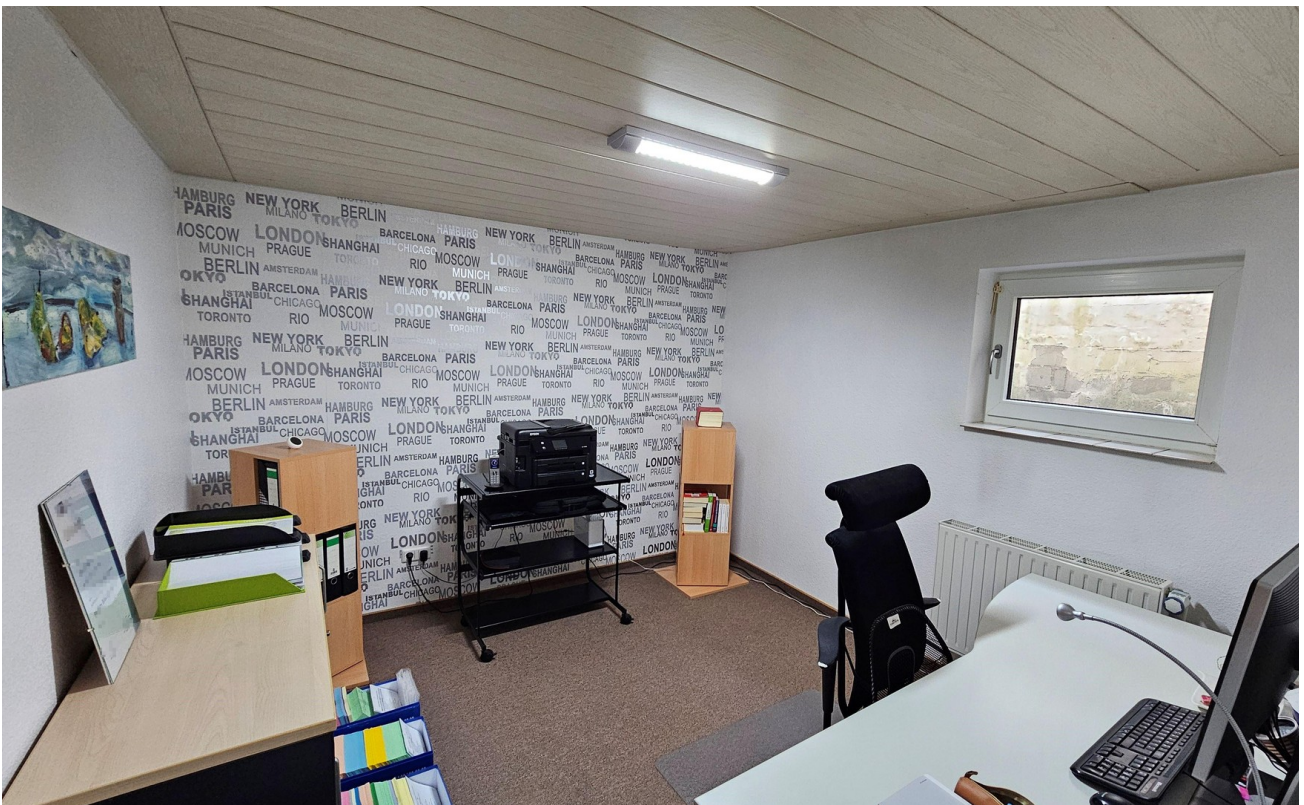
Keller - Arbeitszimmer2