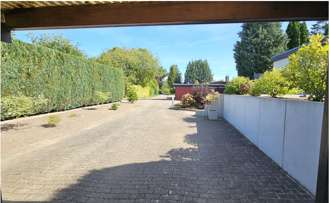
Vorderansicht - Einfahrt