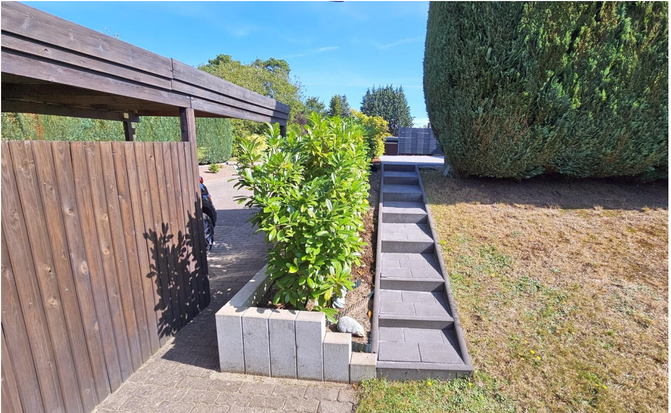
Rückseite - Treppe