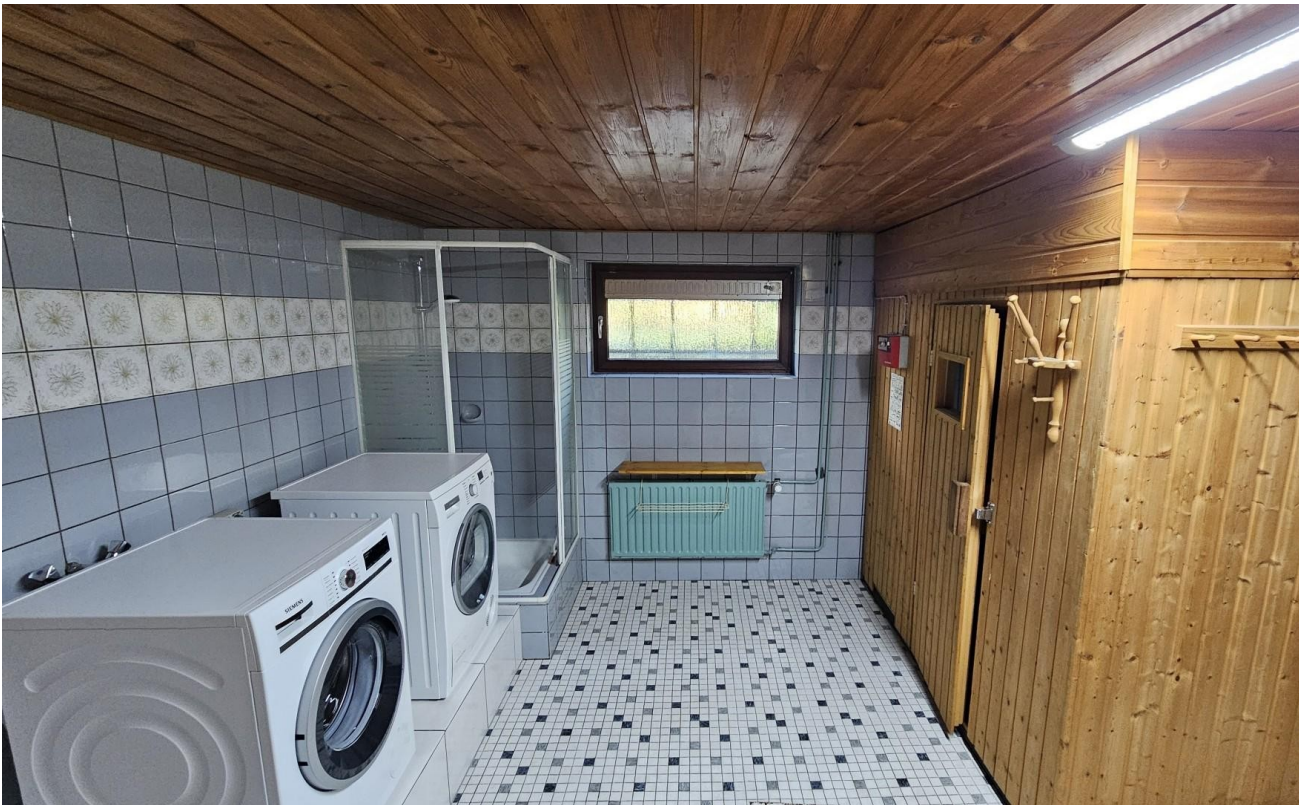
Keller - Waschküche mit Sauna