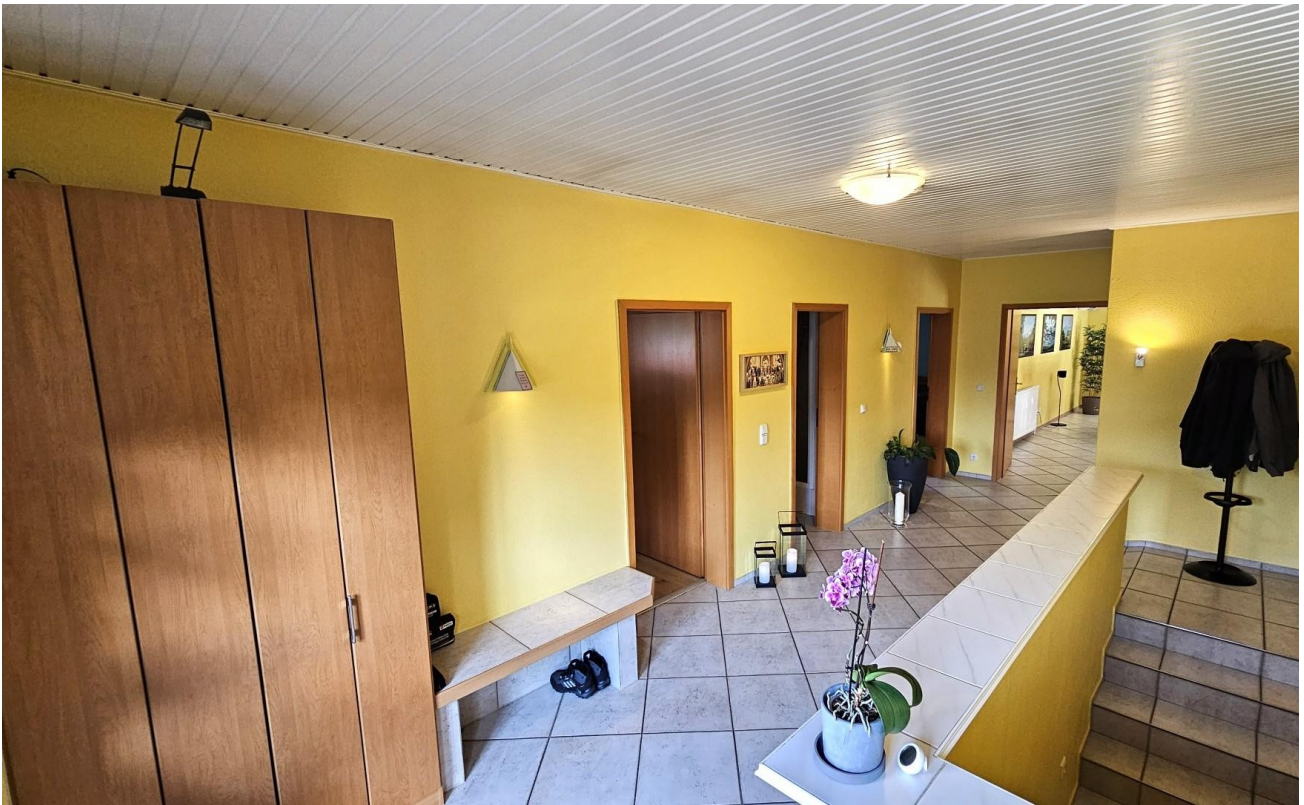
Flur von Haustür nach innen