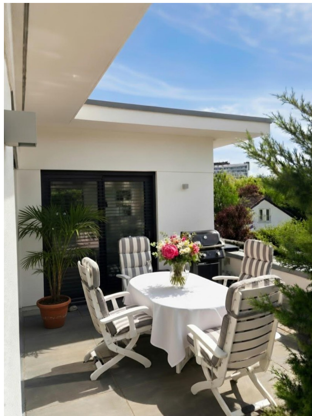
Teil der großen Dachterrasse