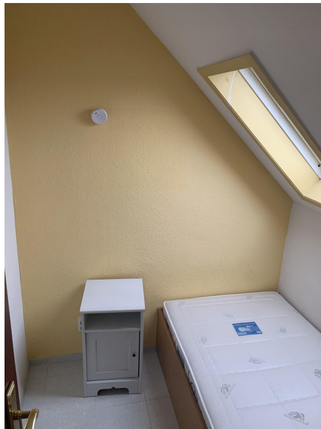
Schlafkammer mit Einzelbett