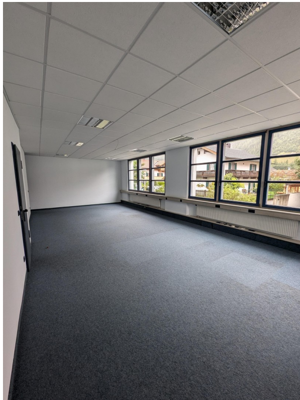
Raum 2 - ca. 55 qm