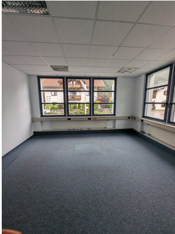
Raum 1 sep. Büro - ca. 20 qm