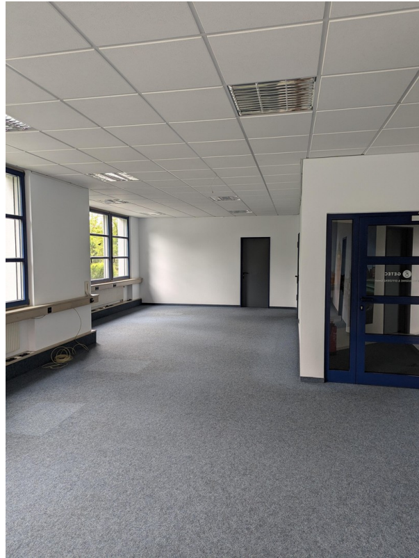
Raum1 - ca. 80 qm