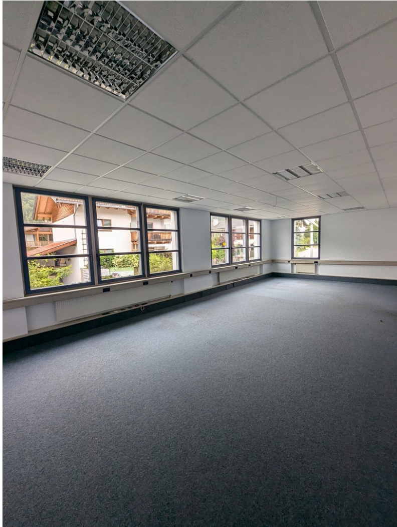
Raum 2 - ca. 55 qm