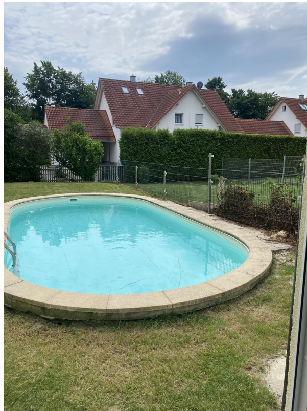
Pool 7.5m x 3.5m x 1.5 Tief