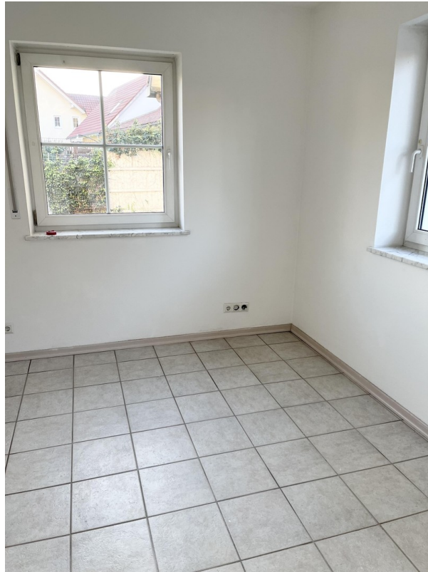
Buero / Schlafzimmer EG