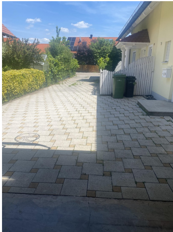
Einfahrt mit 5 Stellplätzen