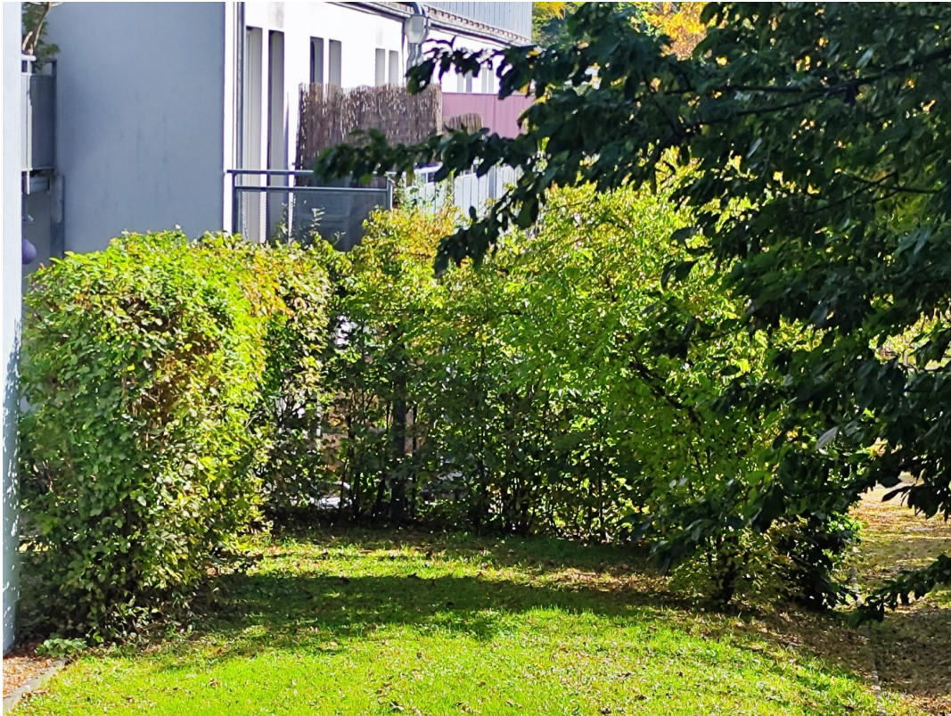
Blick vom Gehweg