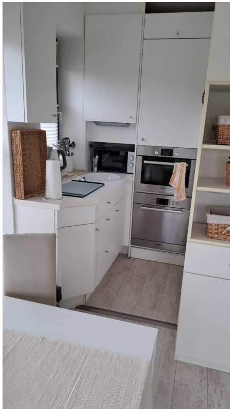
Wohnbereich mit Pantryküche