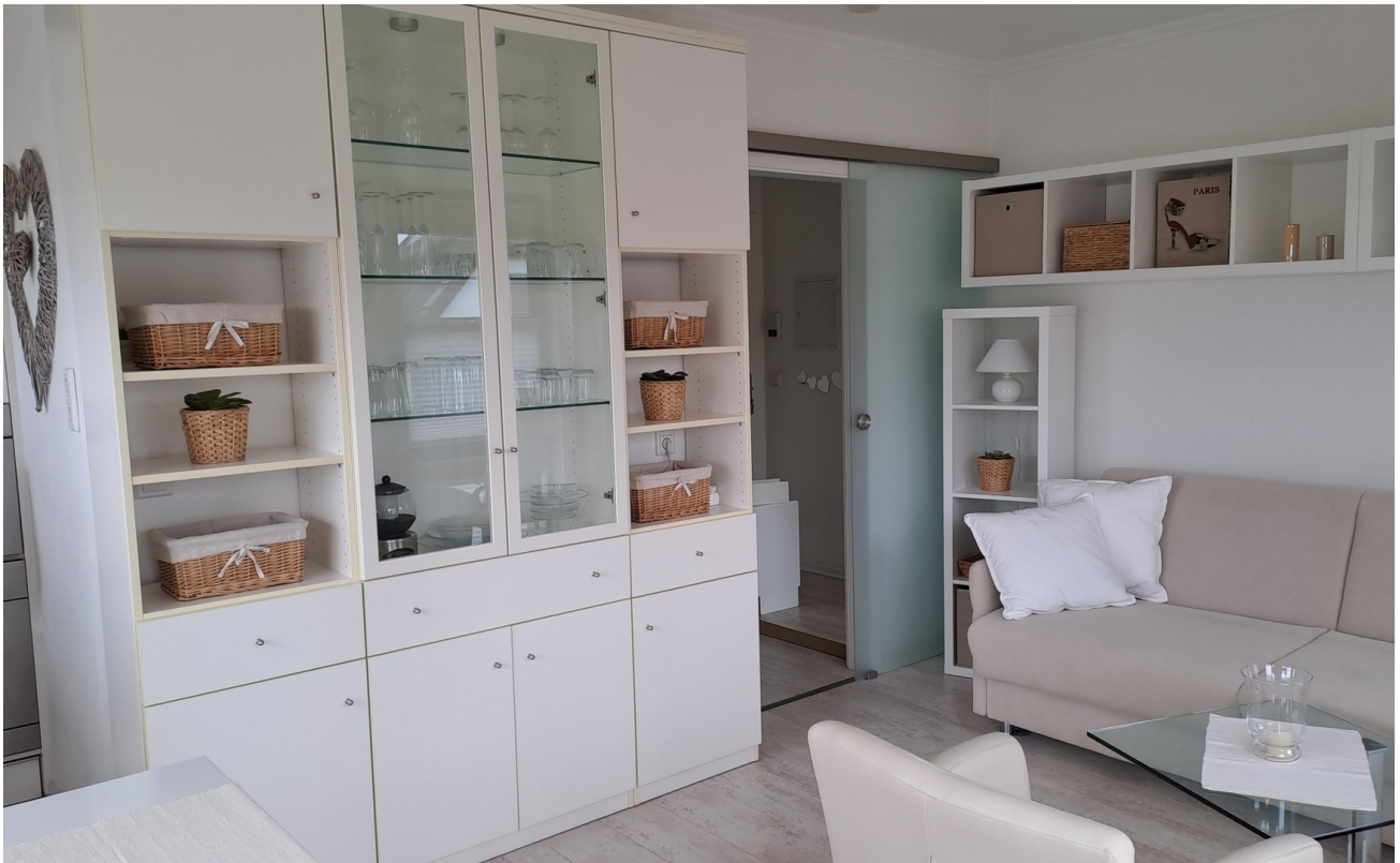
Wohnbereich mit Schrank