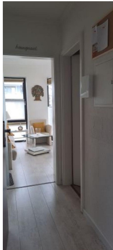
Blick von Eingangstür