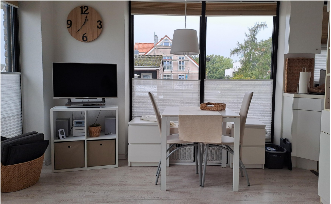
Wohnbereich mit Essplatz