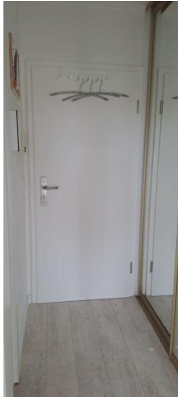
Blick zur Eingangstür