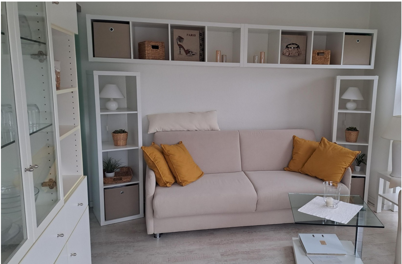
Wohnbereich mit Schlafcoach