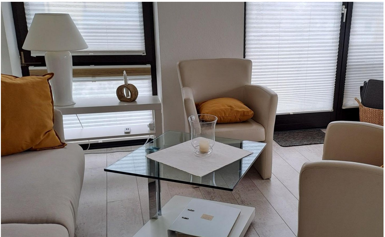
Wohnraum Zugang Balkon