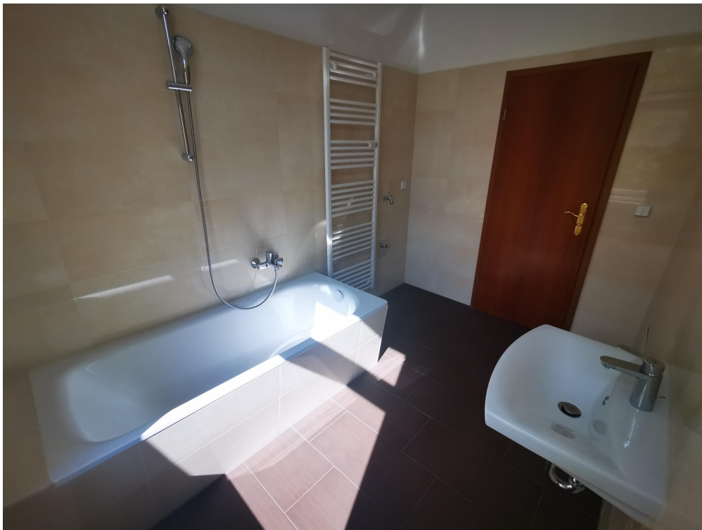
befindet sich die Dusche