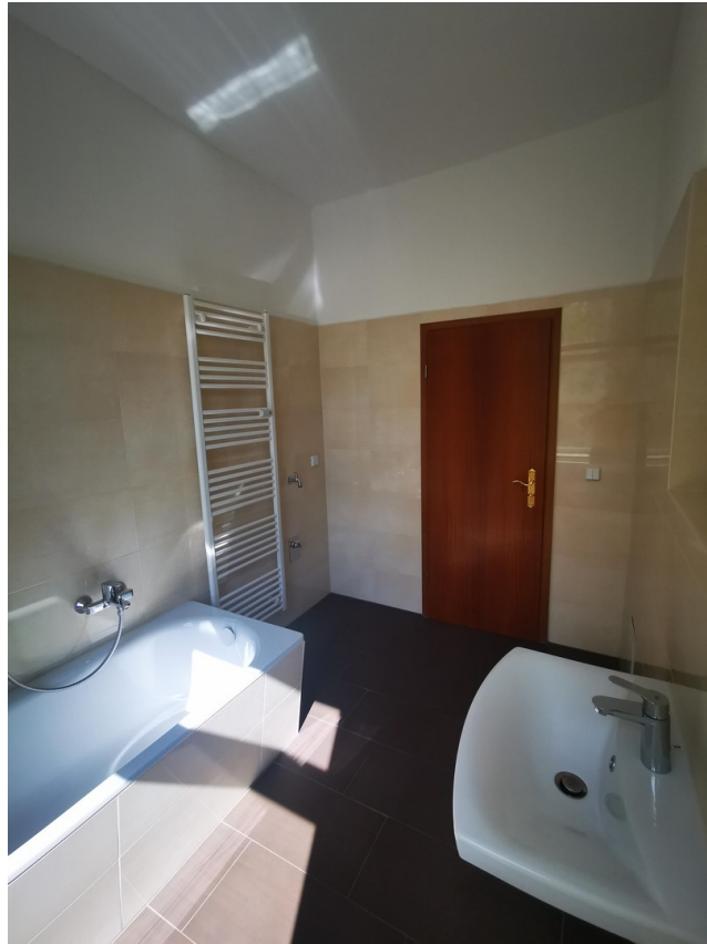
an der Stelle des Heizkörpers