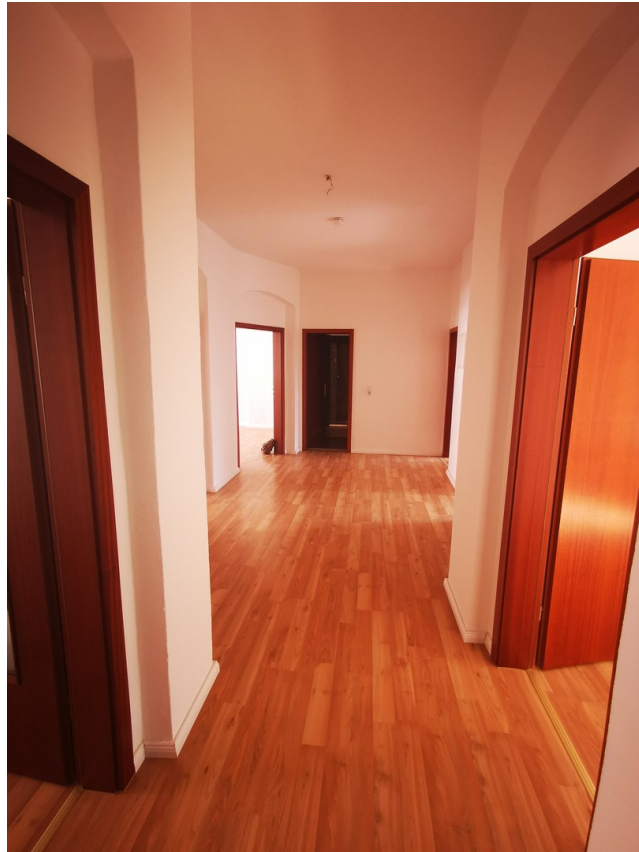
Flur der Wohnung