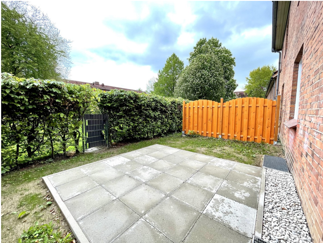
Terrasse & Garten