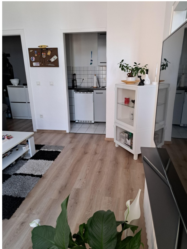
Whz Blick Kü, Flur, Schlafz.