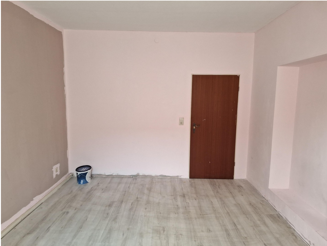
Wohn- und Schlafzimmer