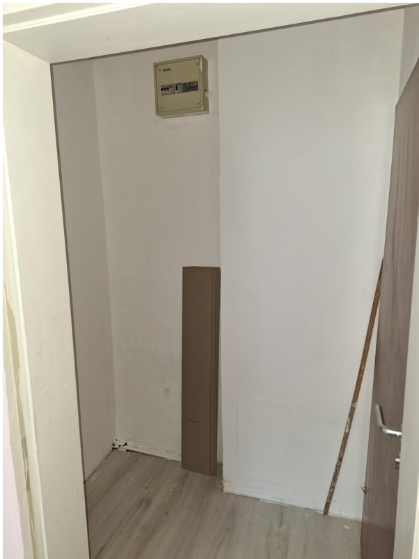
Flur - Eingangsbereich