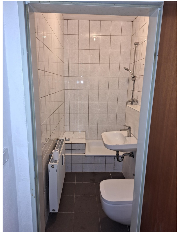
Badezimmer - Dusche