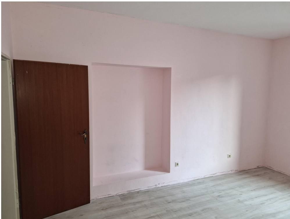
Wohn- und Schlafzimmer