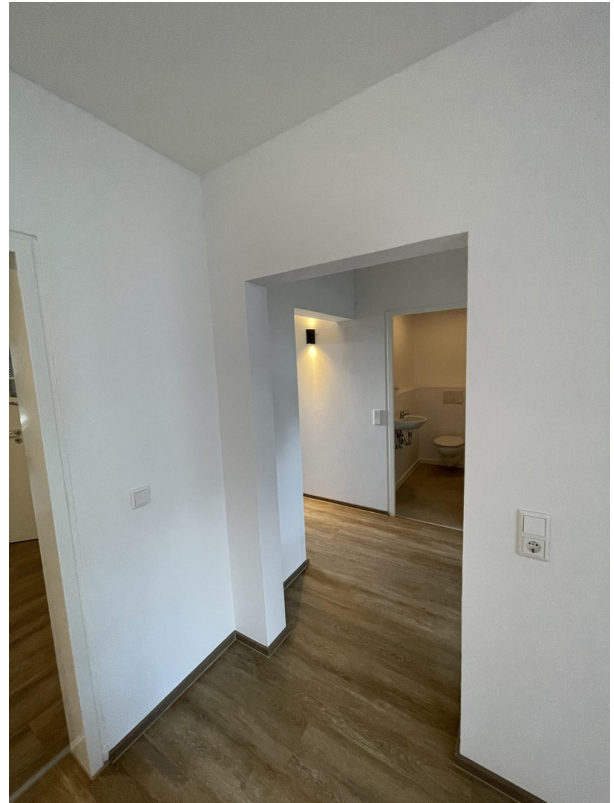
Blickrichtung Essen zu Flur 2.