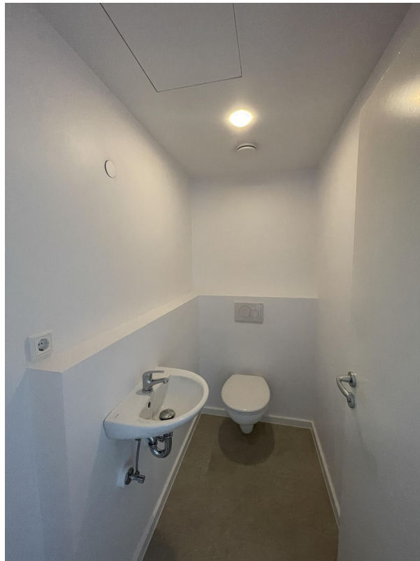
WC / Gäste-WC