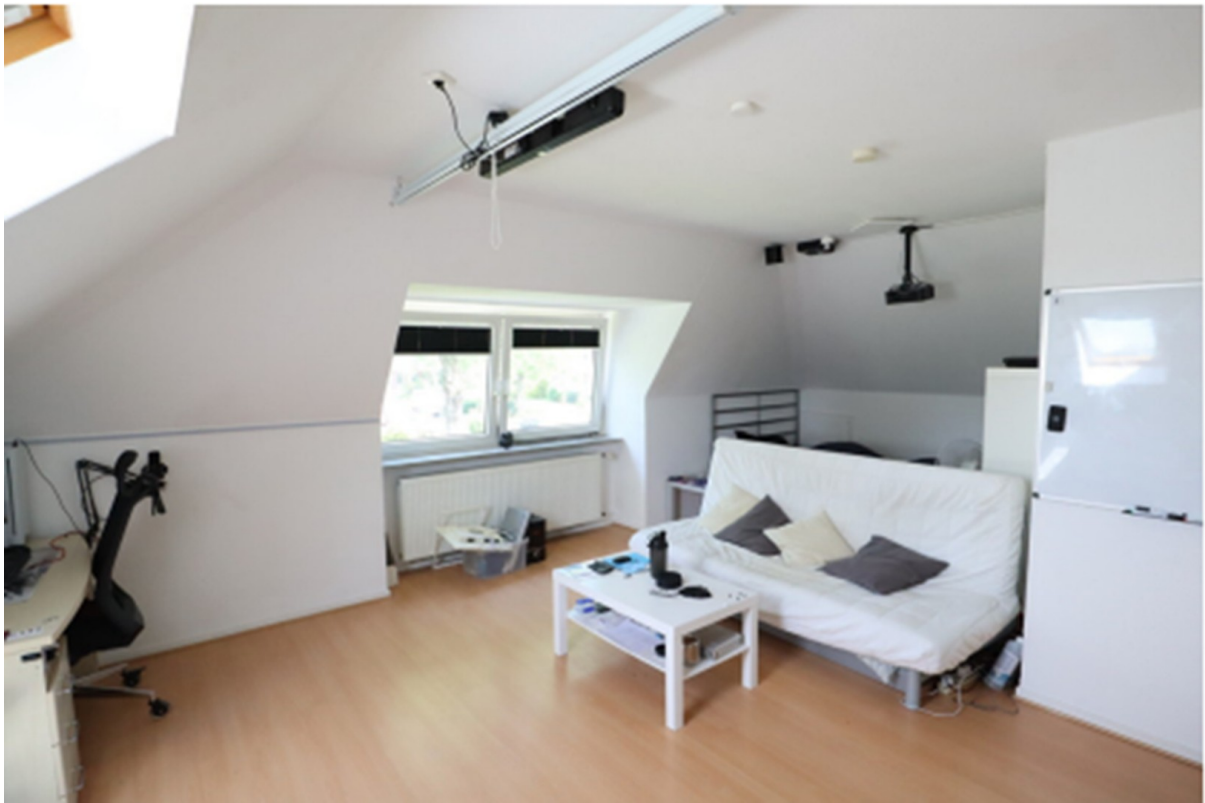
Zimmer 1 DG