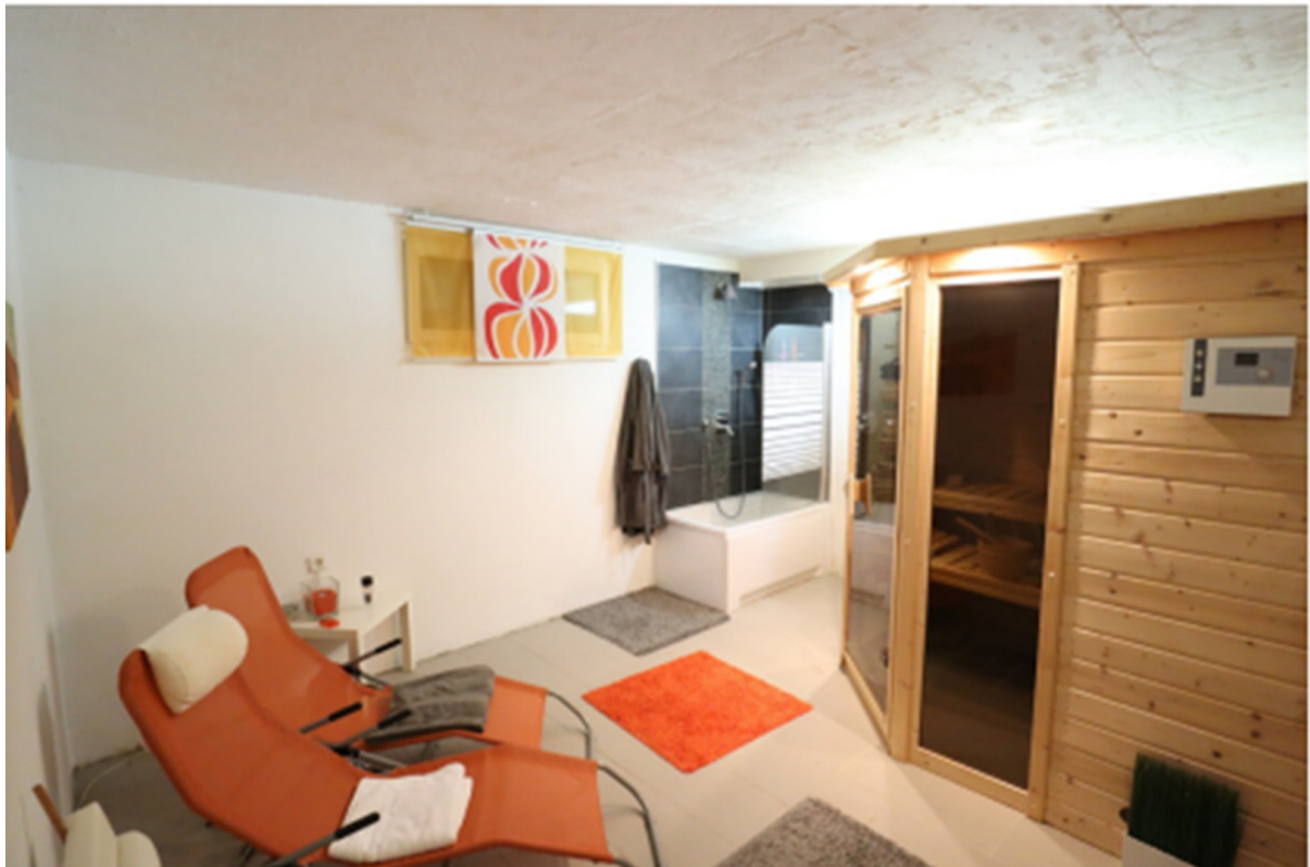
Sauna m Kellergeschoss