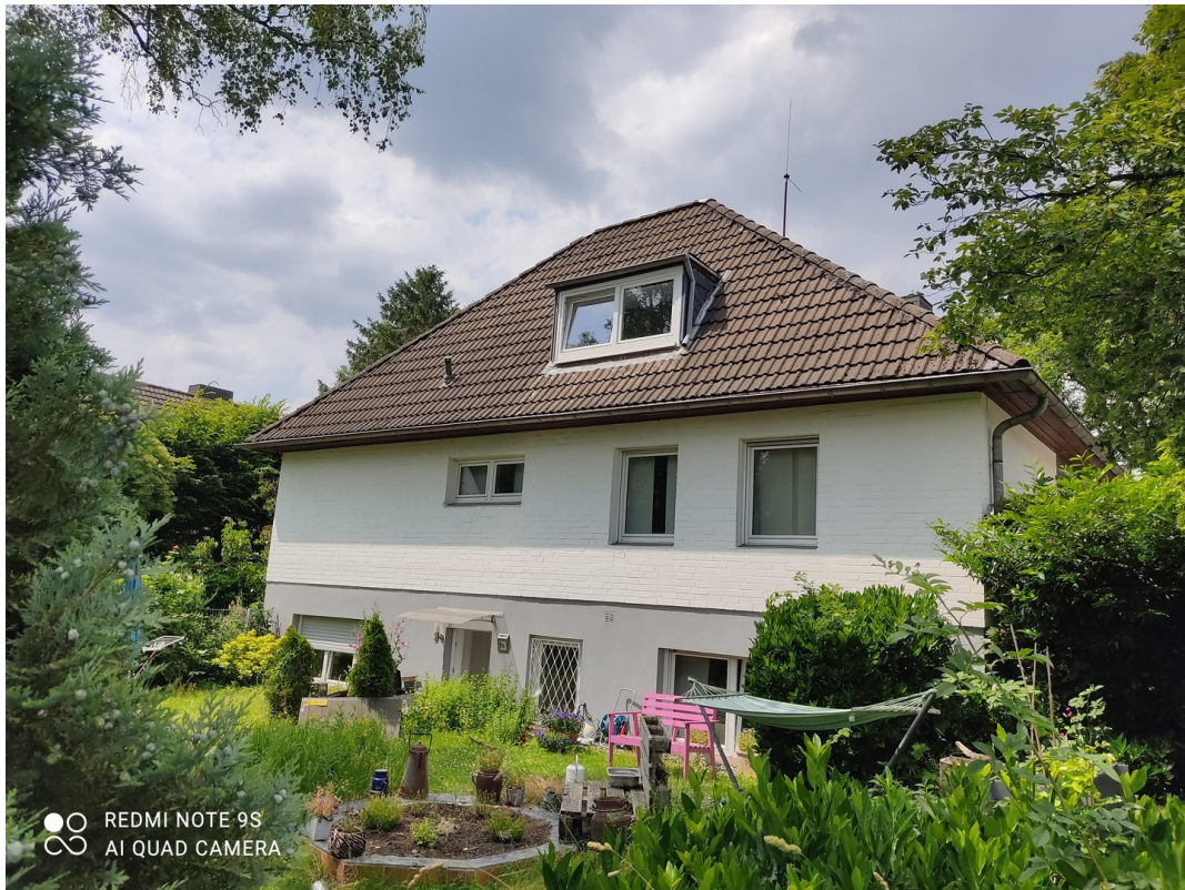
Seitenansicht mit ELW