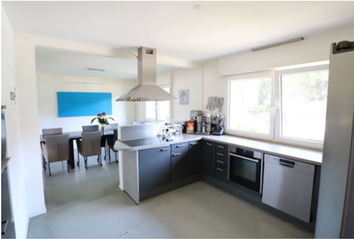
Küche mit offenem Essbereich