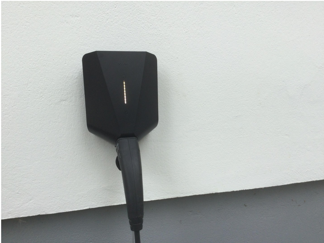
Easee Wallbox vor der Garage