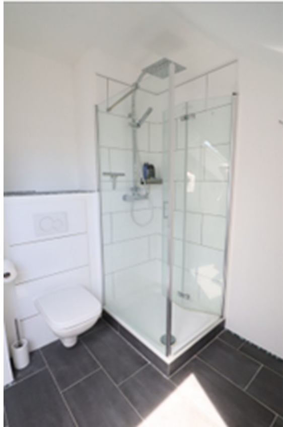
Bad OG Dusche