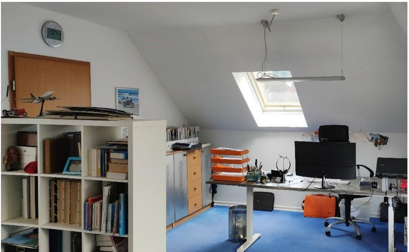
Zimmer 2 DG