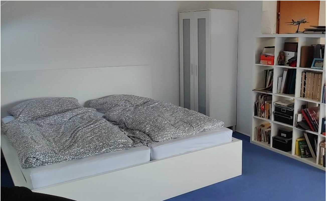
Zimmer 2 DG