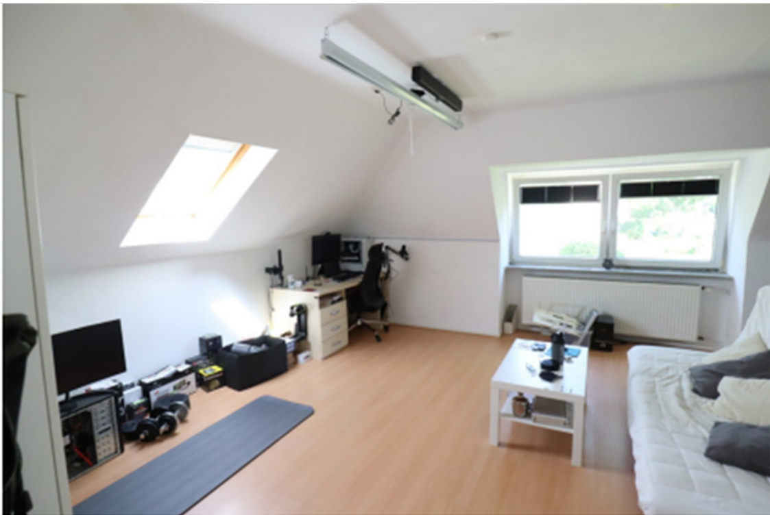
Zimmer 1 DG