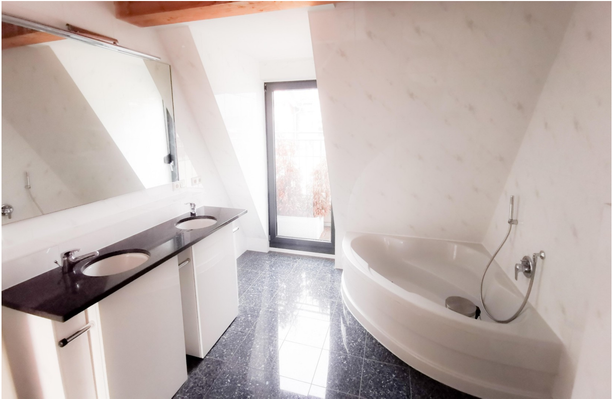
4.OG Bad (leer)