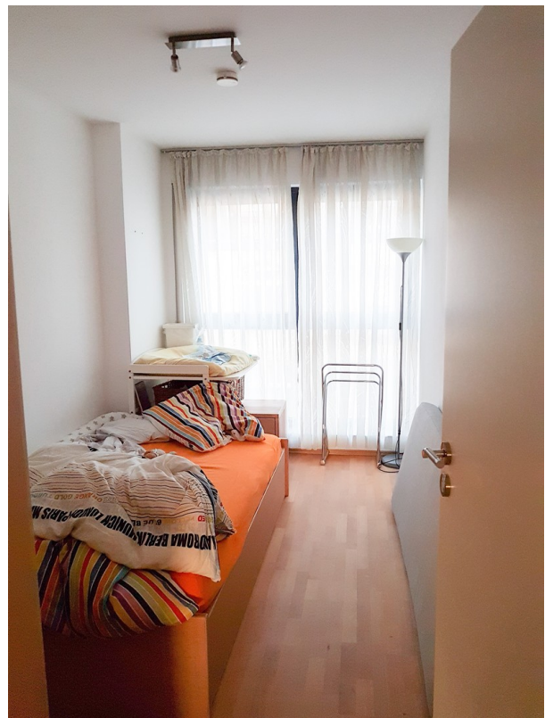
Zweites Kinderzimmer 3OG