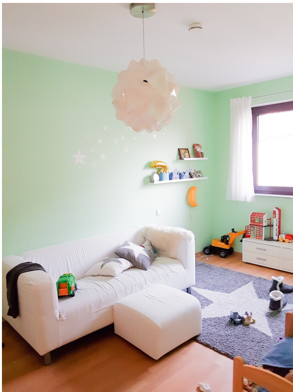
Erstes Kinderzimmer 3OG