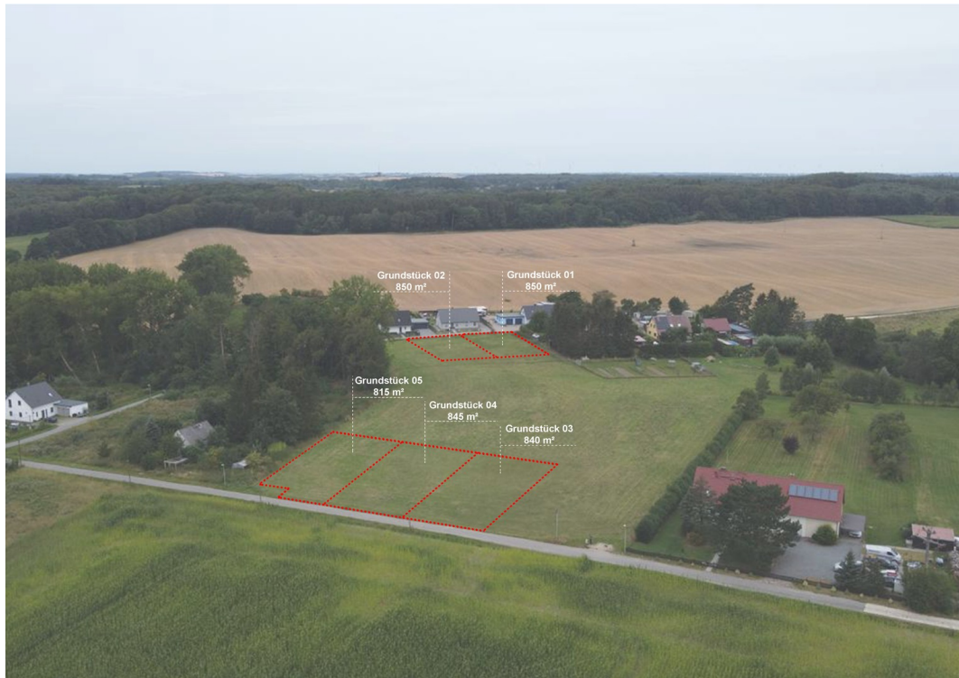
Grundstücke 3 bis 5