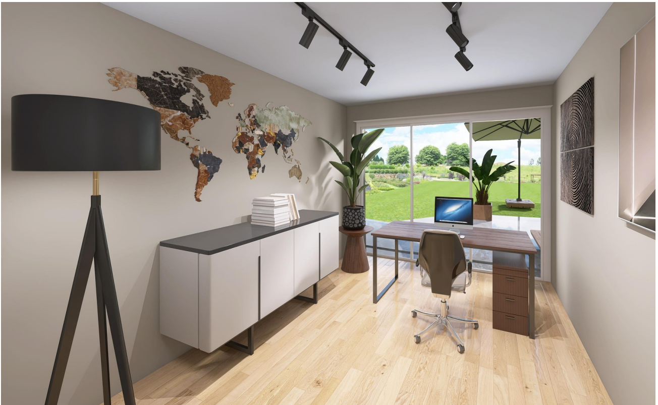
Büro / Kinderzimmer _virtuell