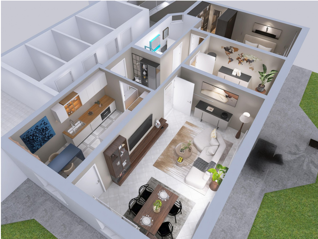
Grundriss von oben