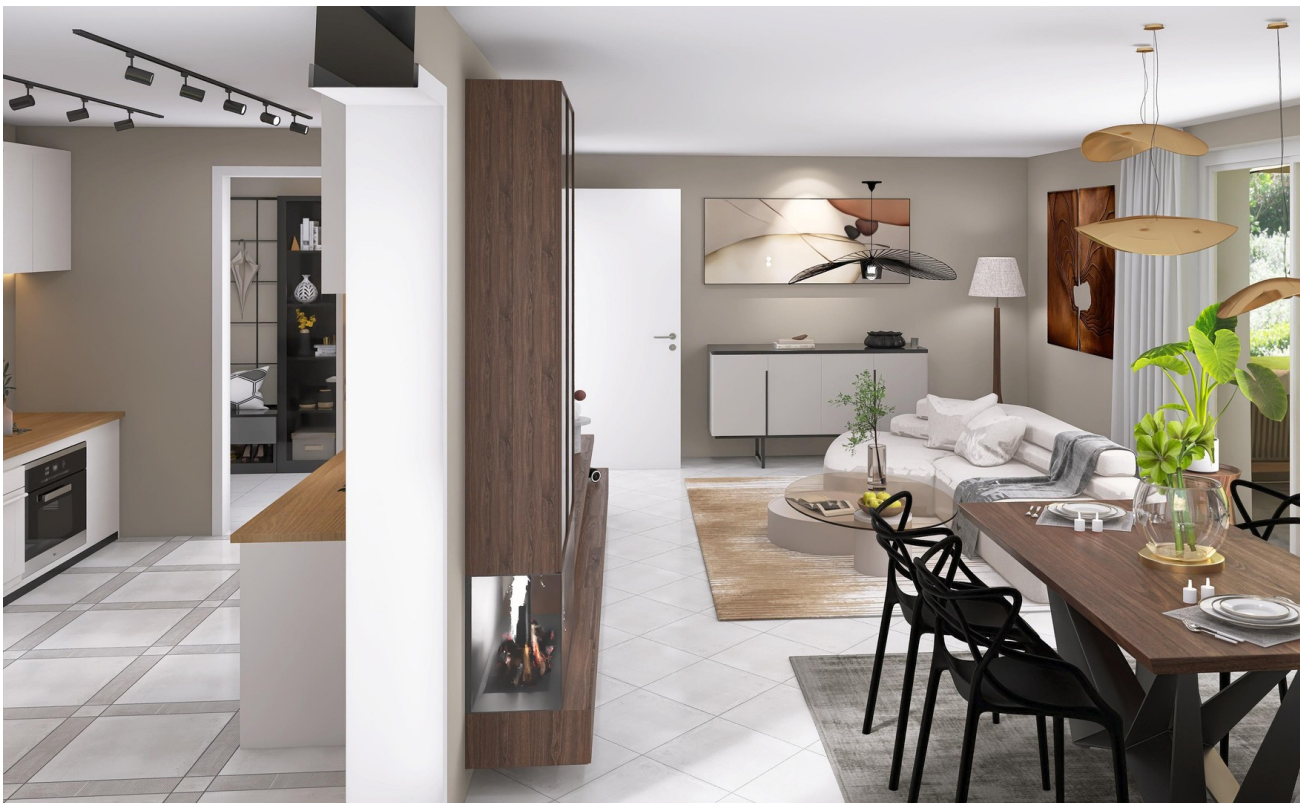
Übergang Wohnzimmer Küche