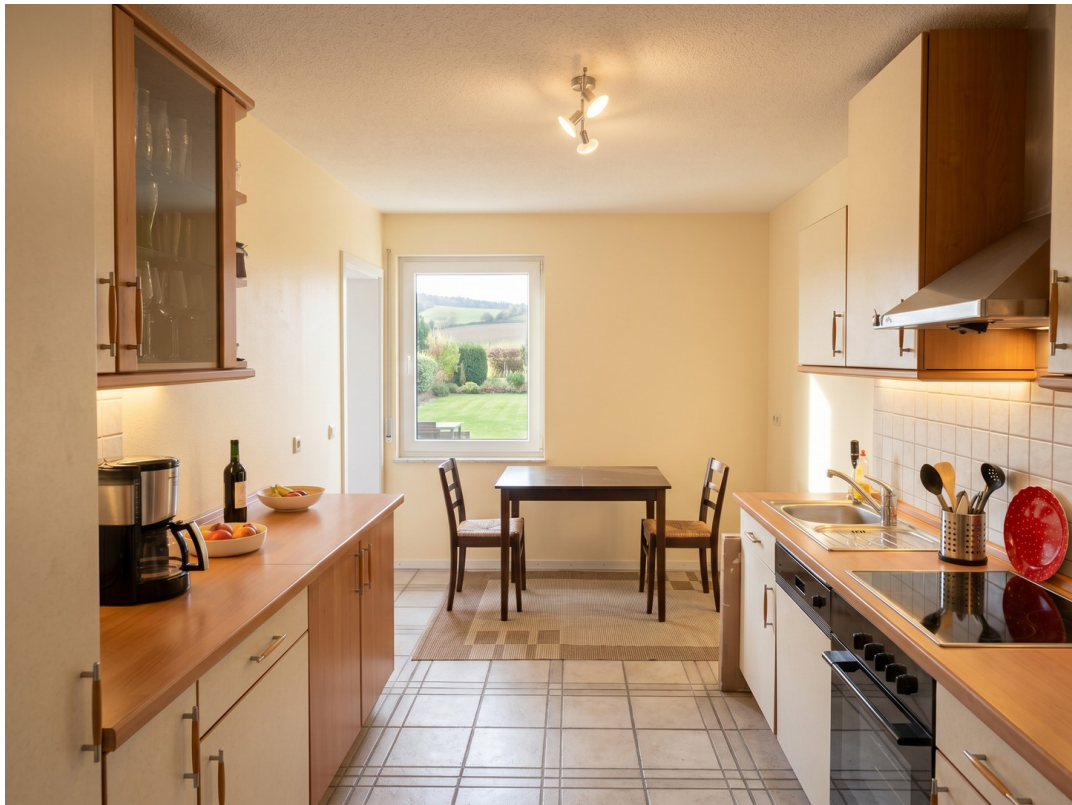
Küche aktuelle Einbauküche