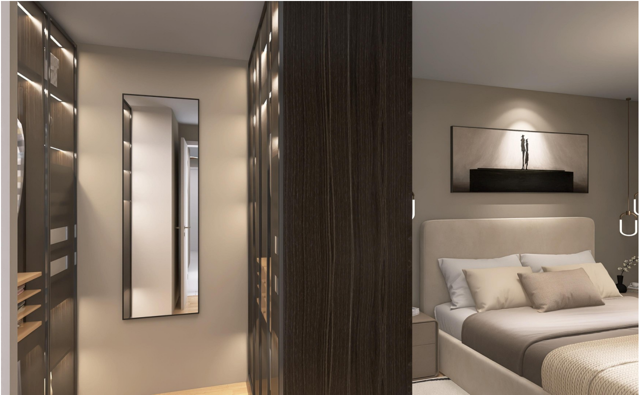
Schlafz. Schrank begehbar_virt