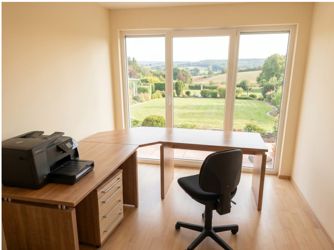
Büro (Landschaft anders)