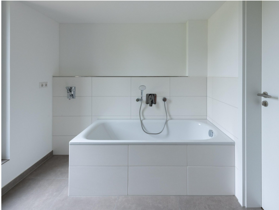
Bad mit Wanne und Dusche