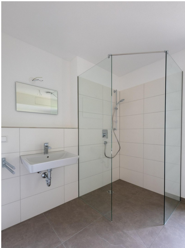
Bad mit Wanne und Dusche