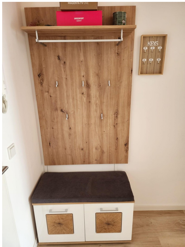
Garderobe im Flur