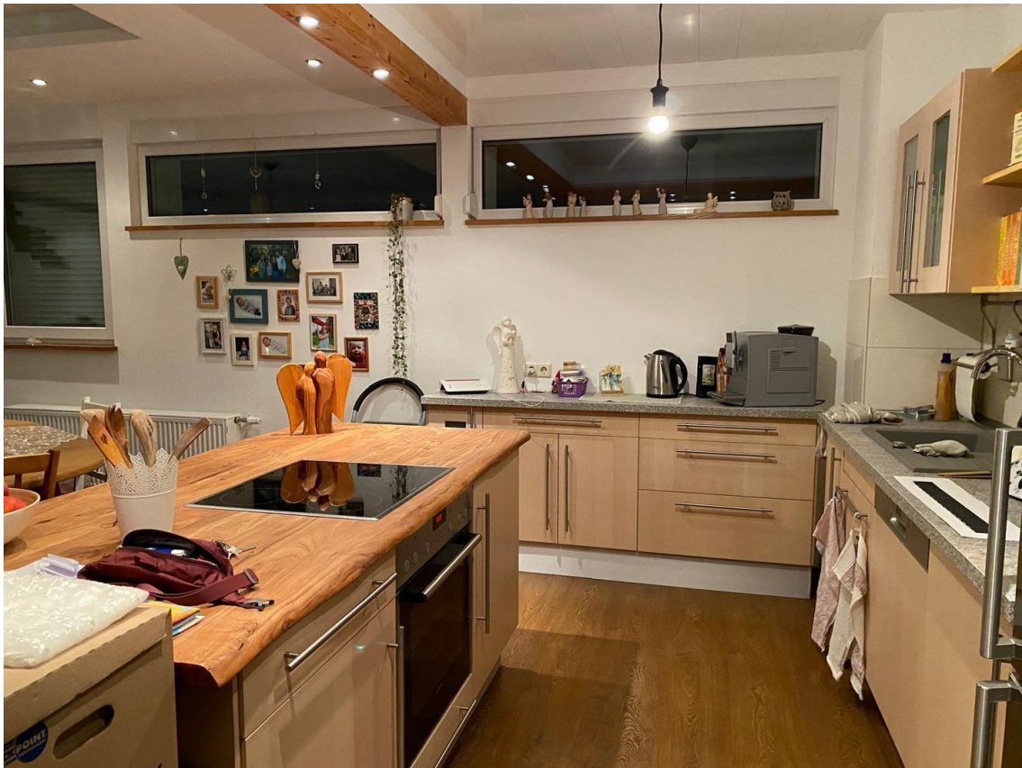
Einbauküche mit Kochinsel