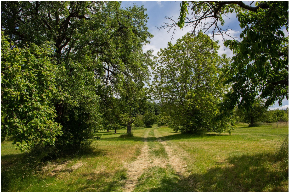
Umgebung um Arnbach