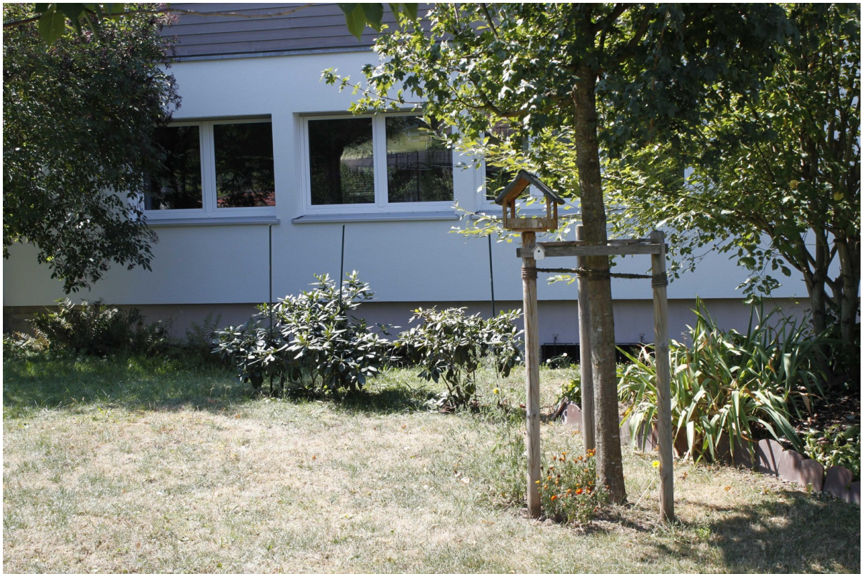
Wohnung mit Gartenblick