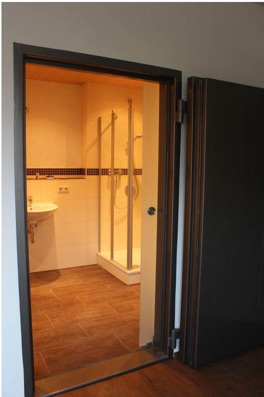
Bad im Tresorraum