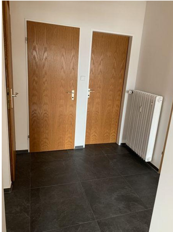
Flur Bad - WC