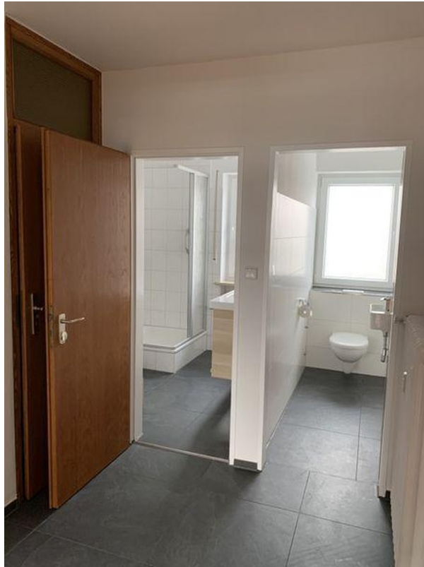
Badezimmer - WC