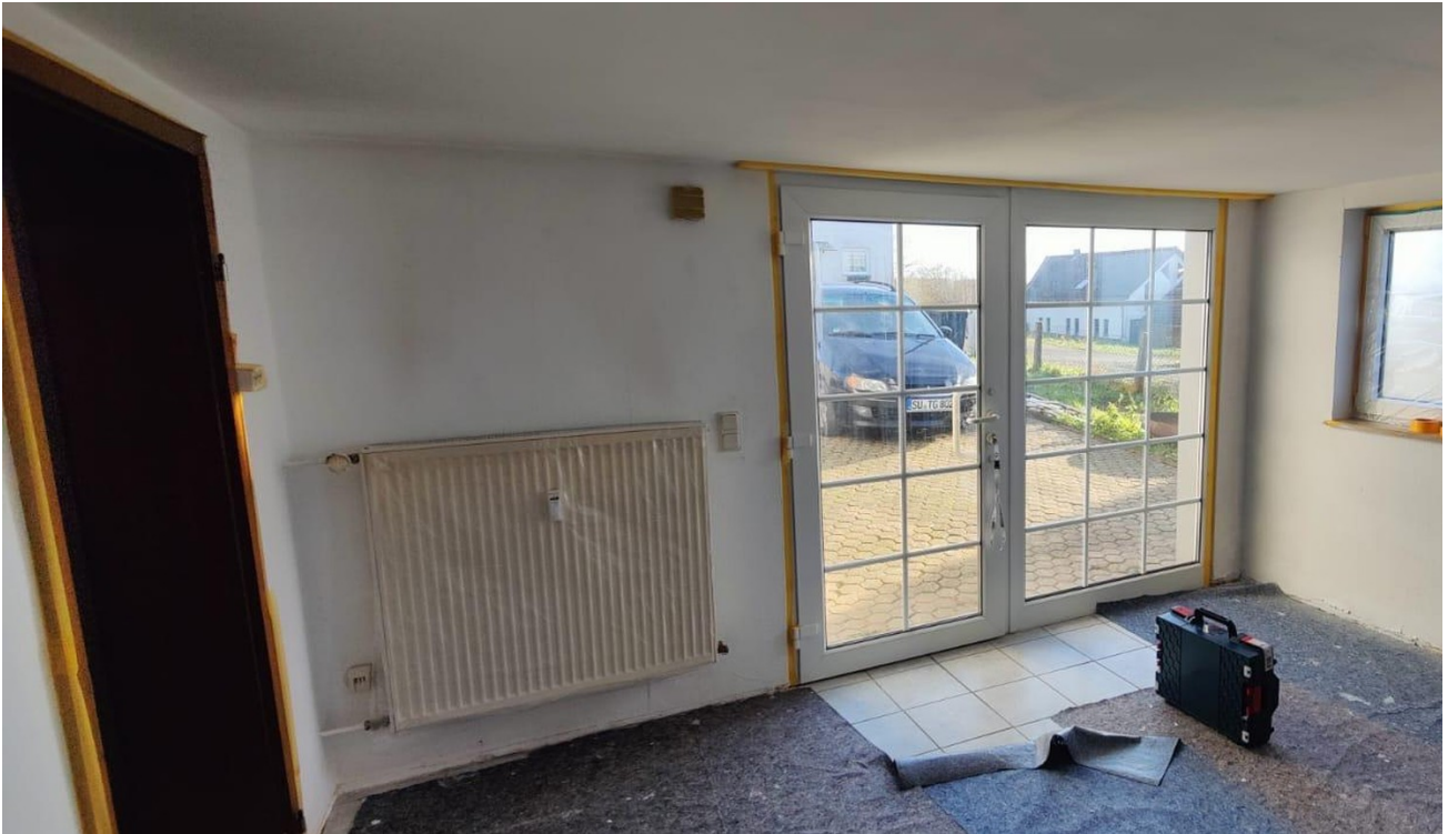
Wohnzimmer mit Eingangstür