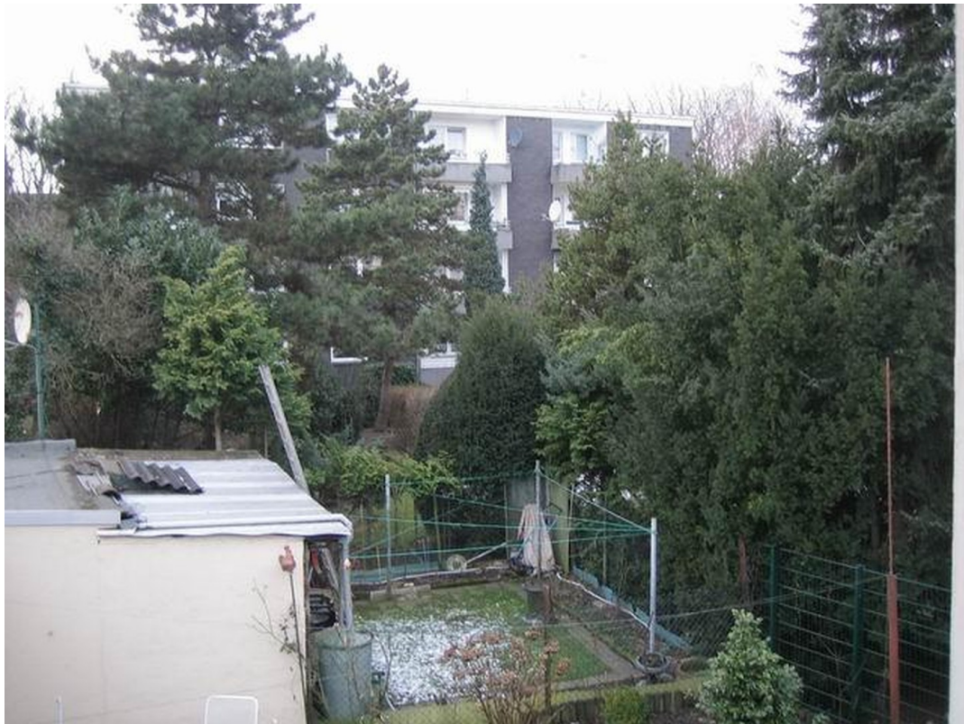
Blick aus der Küche