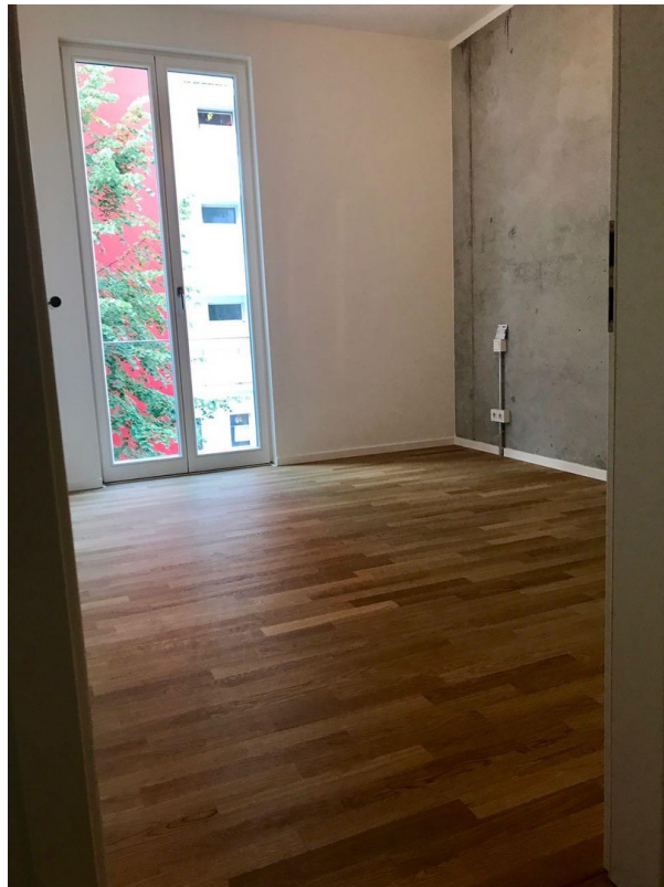
Blick ins Schlafzimmer