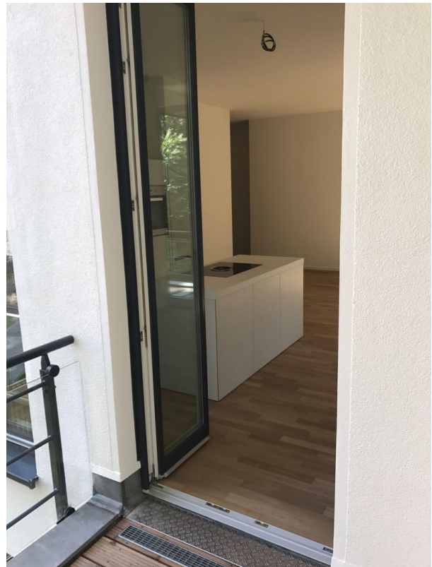
Blick vom Balkon in die Küche