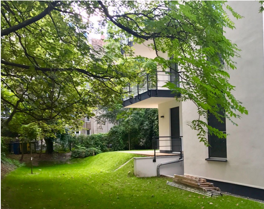
Gartenblick vom Stellplatz aus