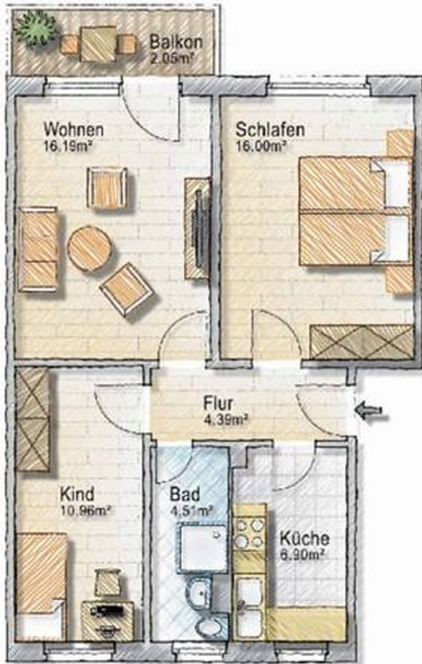
Grundriss mit QM-Angabe