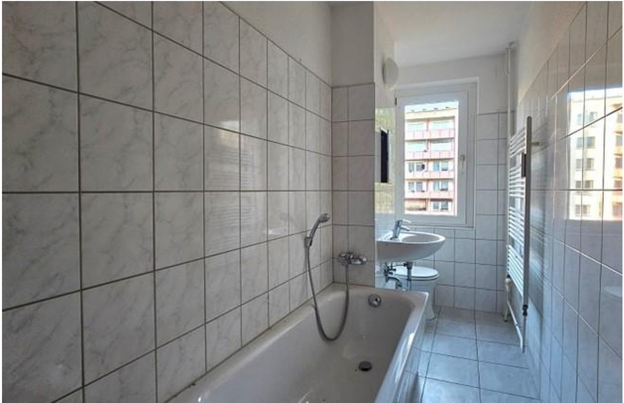
Beispielbad mit Wanne