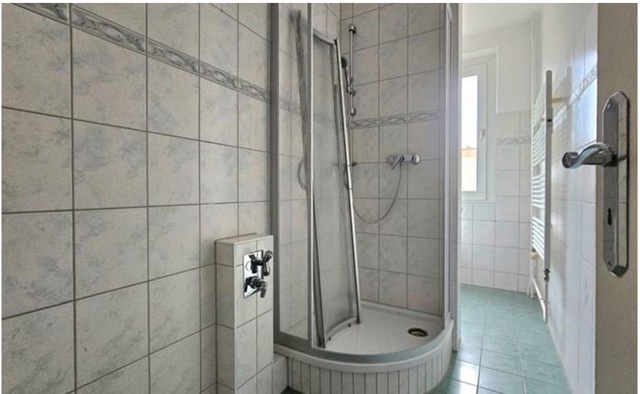
Beispielbad mit Dusch