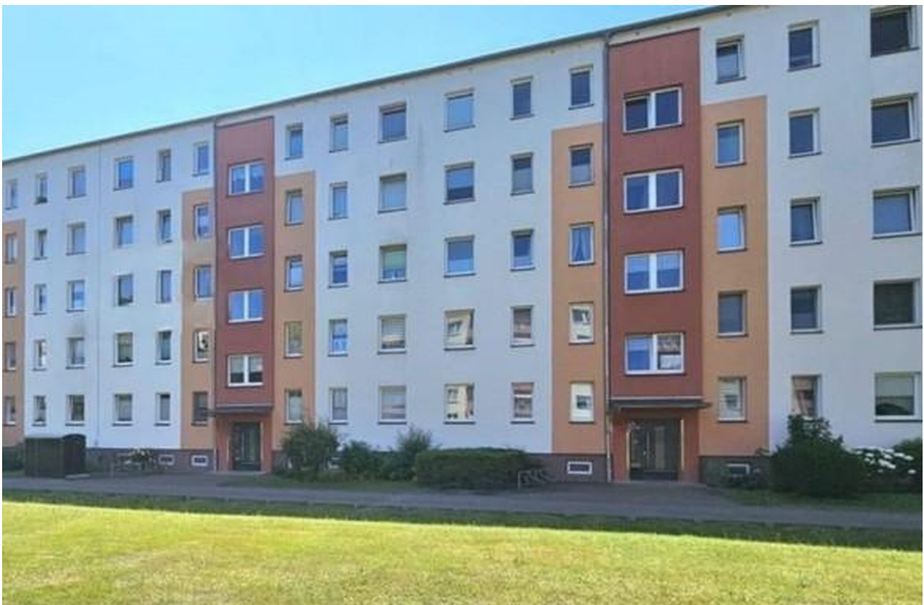
Außenansicht mit Eingang