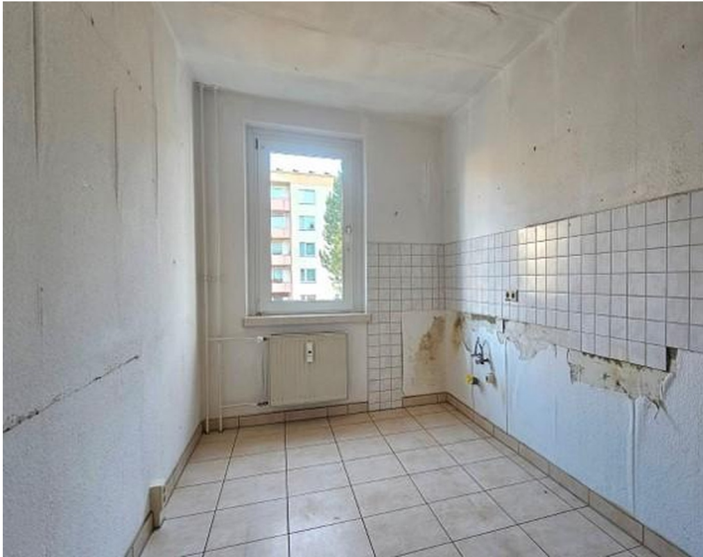
Küche mit Fliesenspiegel