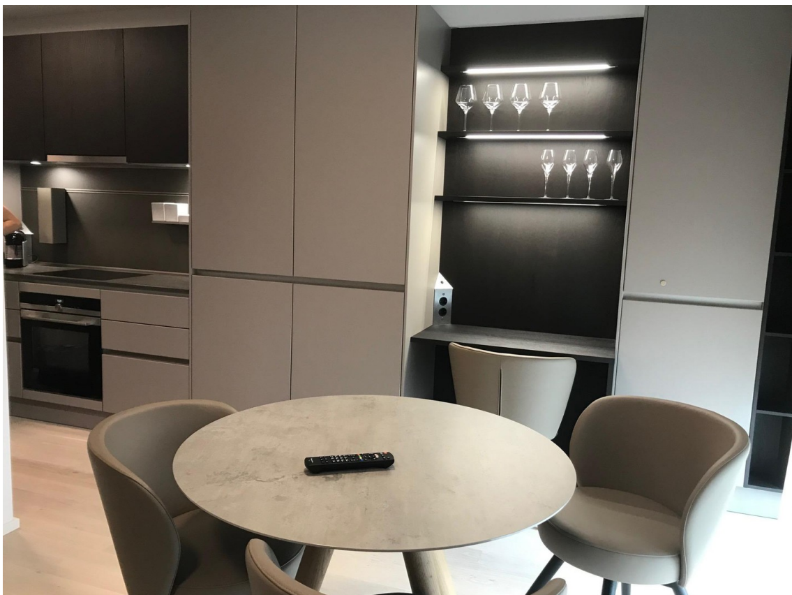
Wohnen dunkle Variante