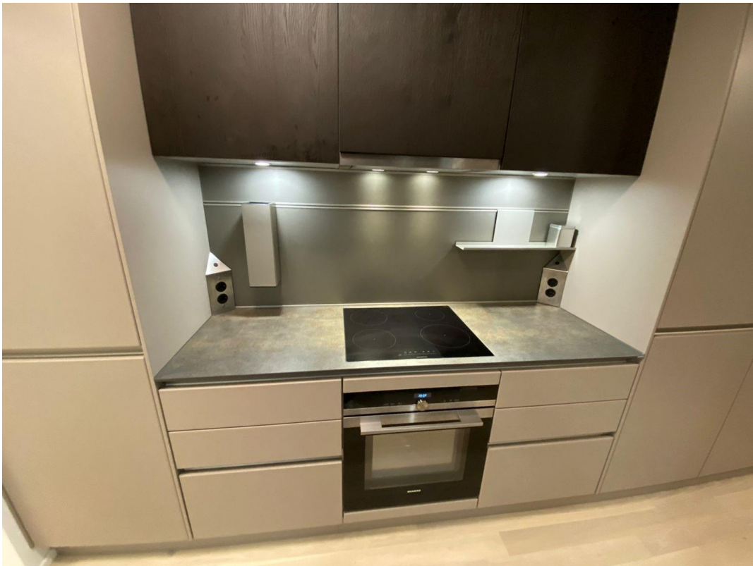
Küche dunkle Variante