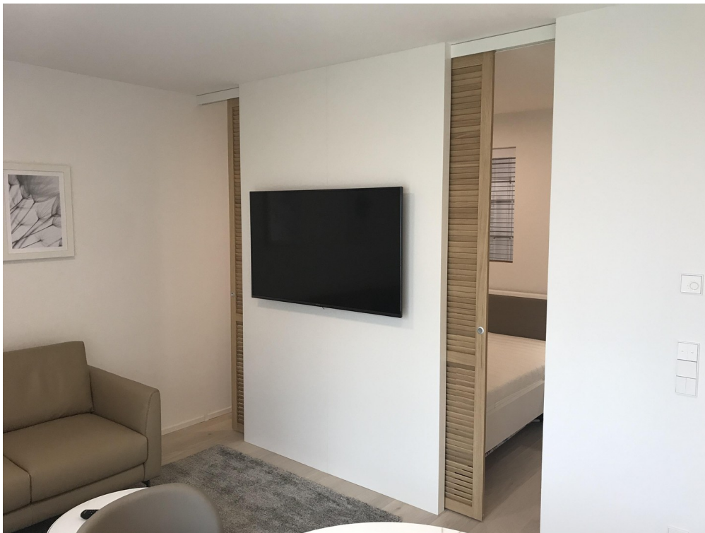
Wohnen/Blick zum Bett