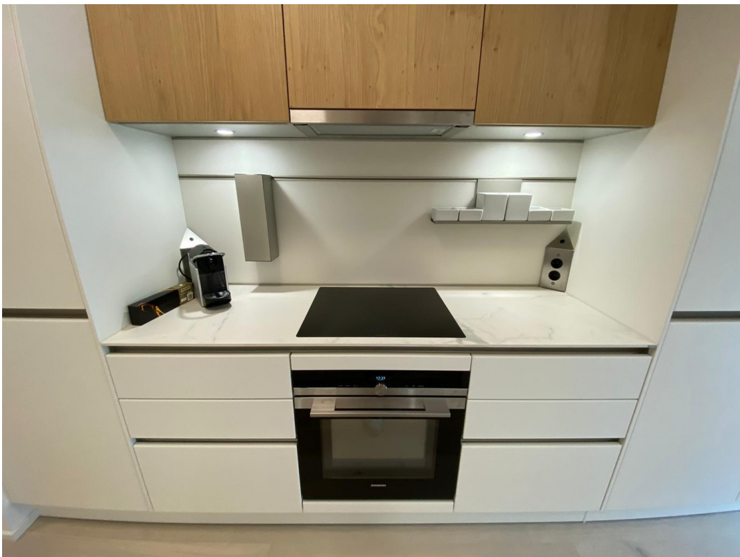
Küche helle Variante