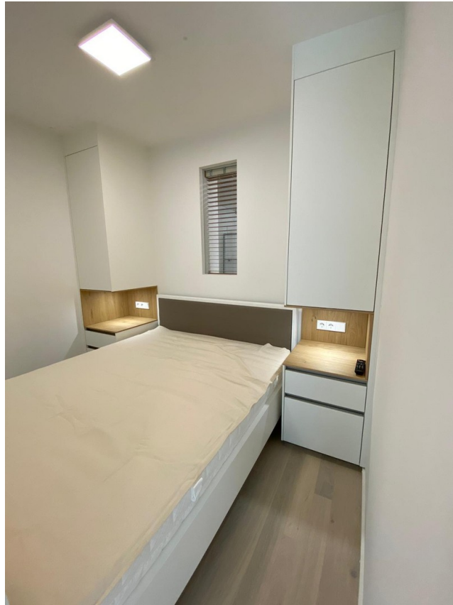
Schlafen helle Variante