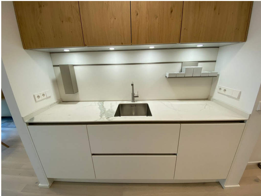
Küche helle Variante