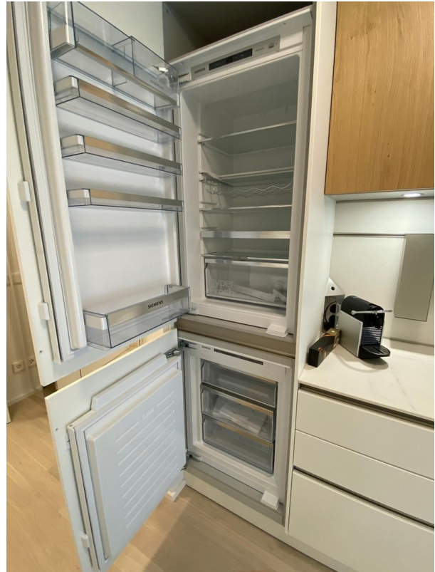
Kühlschrank u Tiefkühlschrank