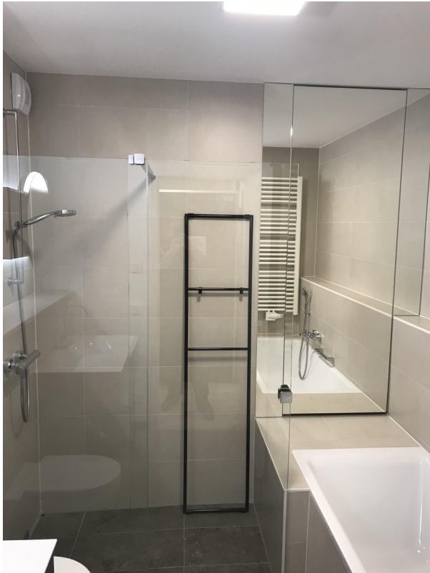
Variante m. Wanne