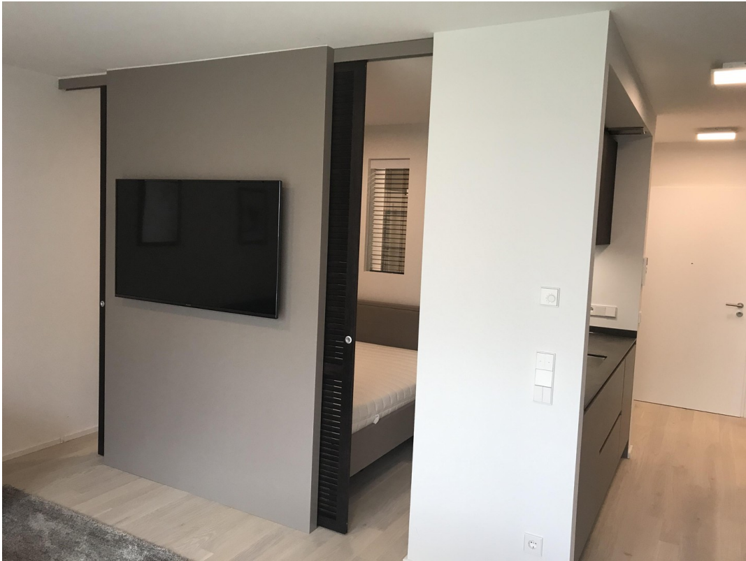
Wohnen/Blick zum Bett