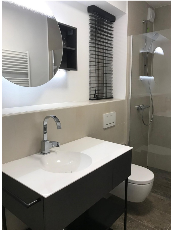
Bad dunkle Variante