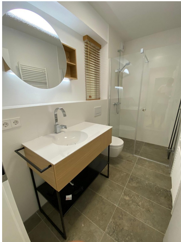
Bad helle Variante