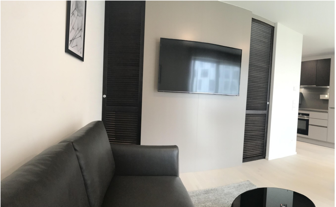
Wohnen dunkle Variante