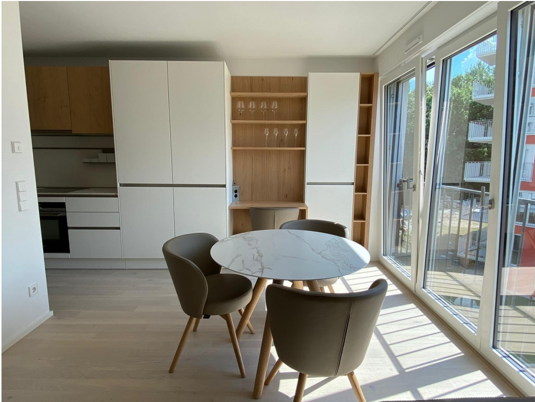
Wohnen helle Variante