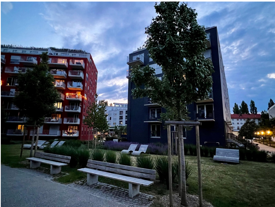
Ruheplatz am Eisbach