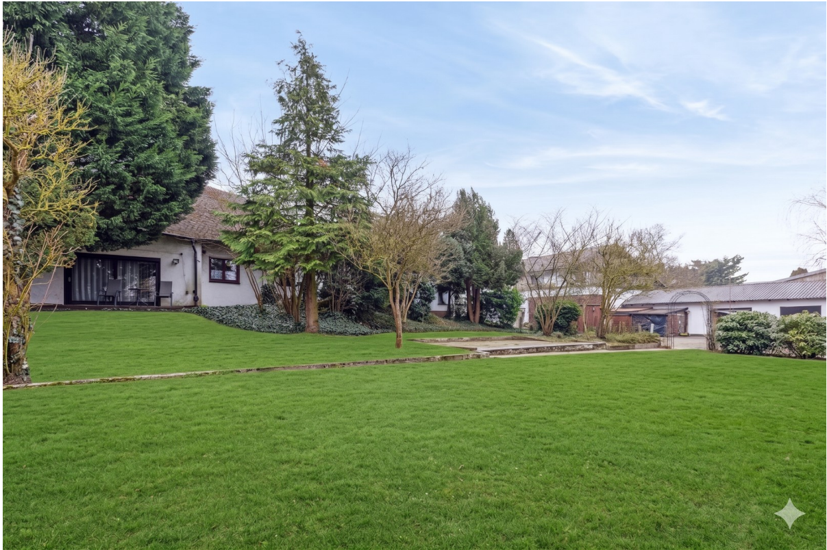
Haus Garten hinten, KI