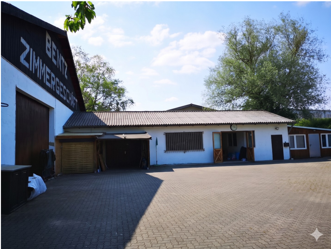
Halle & Werkstatt