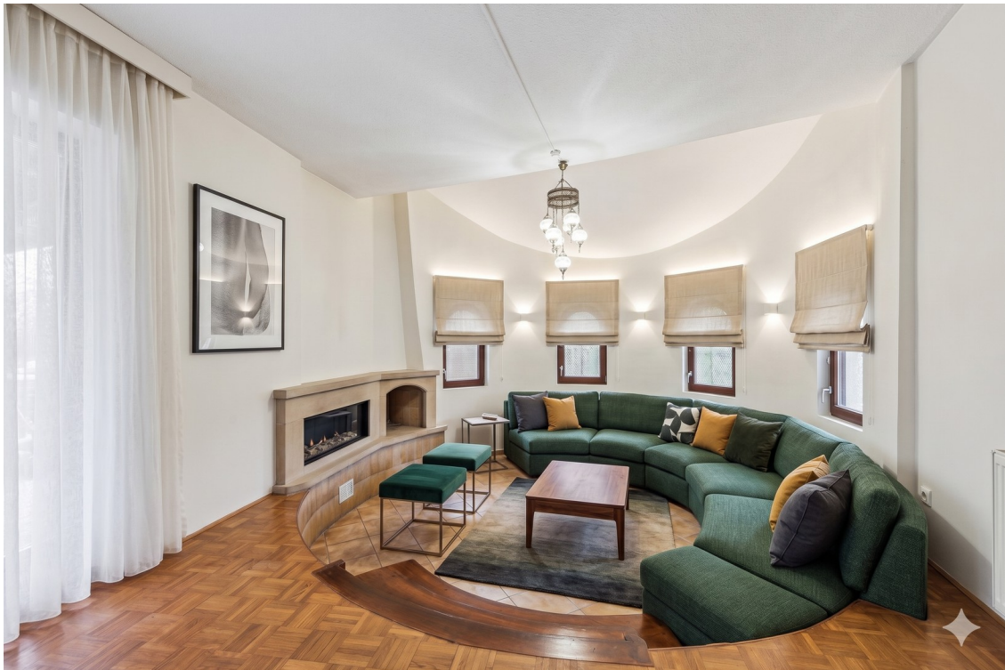
Kaminecke, mit KI angepasst