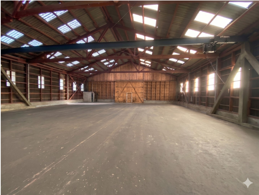
Lagerhalle Abteil 1/4 (KI)