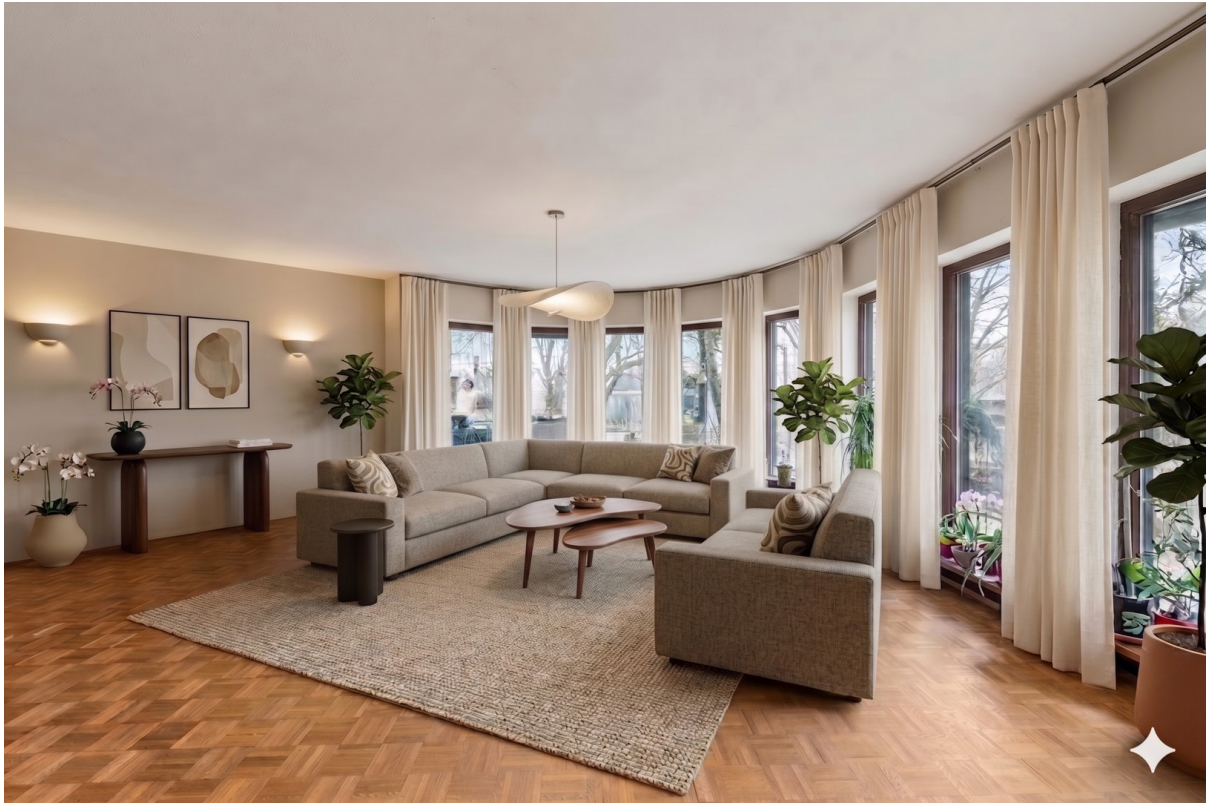
Wohnzimmer. KI gestaltet