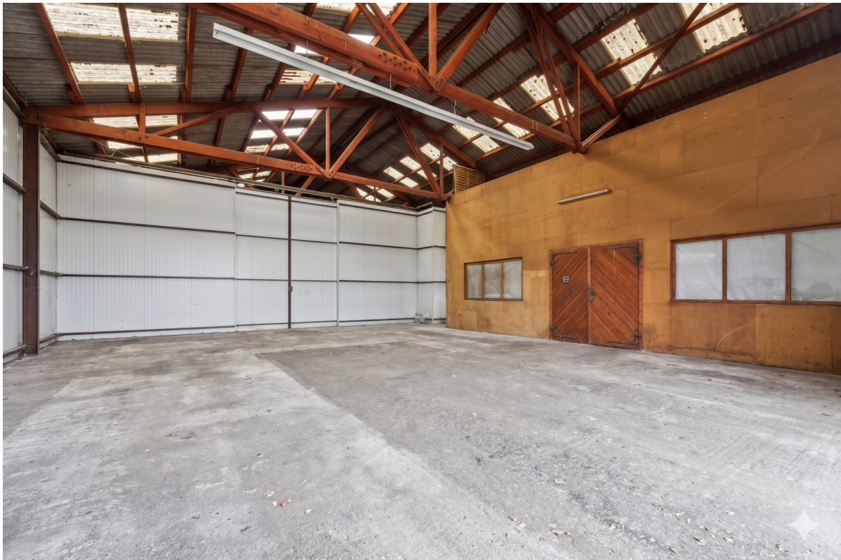
Lagerhalle Abteil 2/4