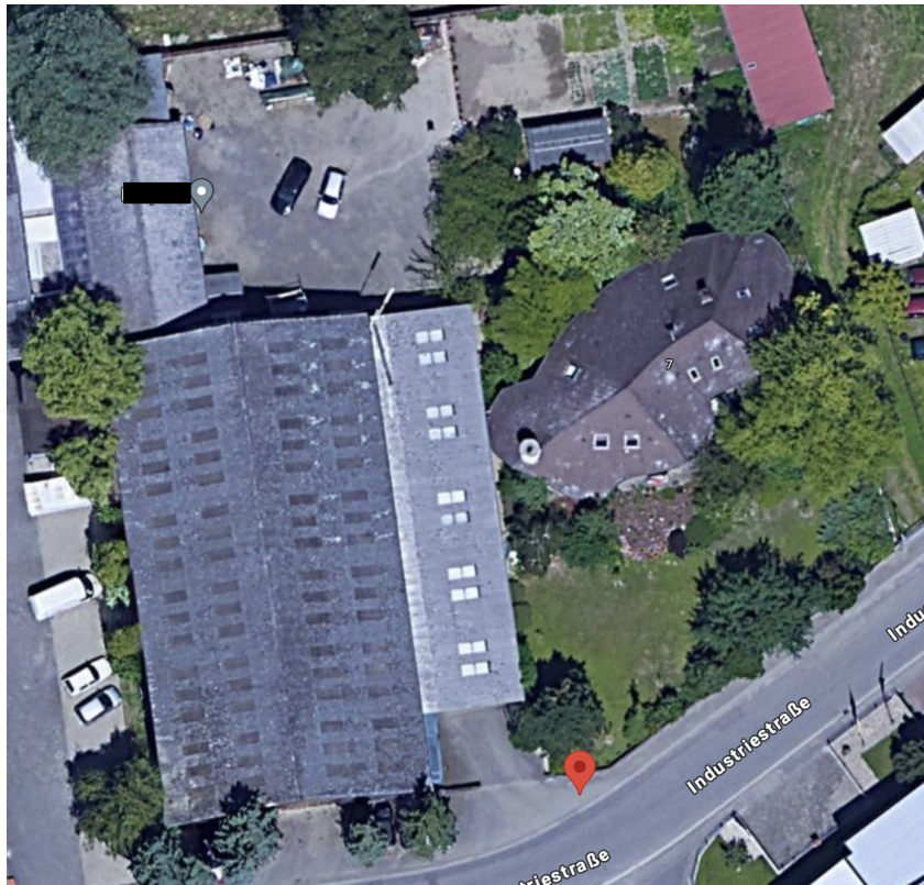
Halle, Werkstatt, Hof, Haus