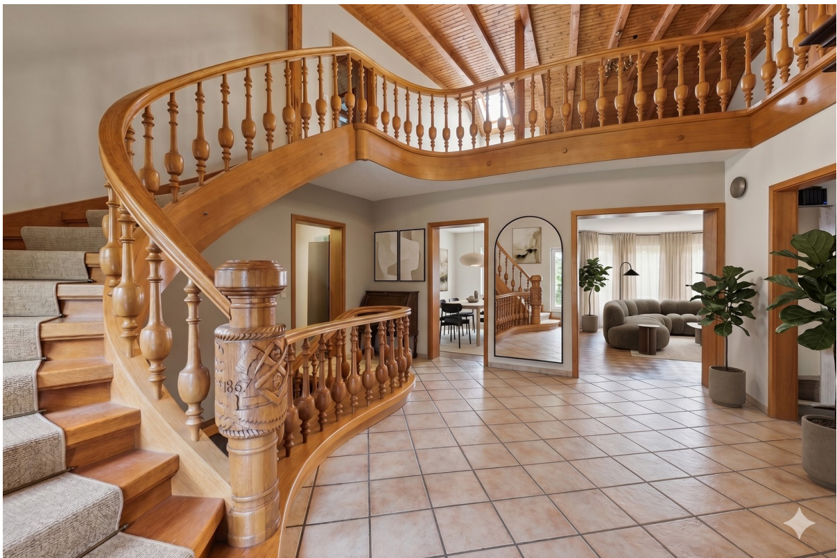
Eingang. (KI bearbeitet)