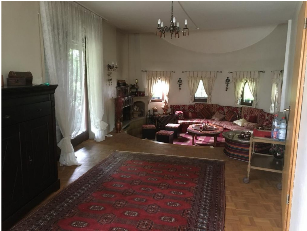
Kaminecke und Essbereich