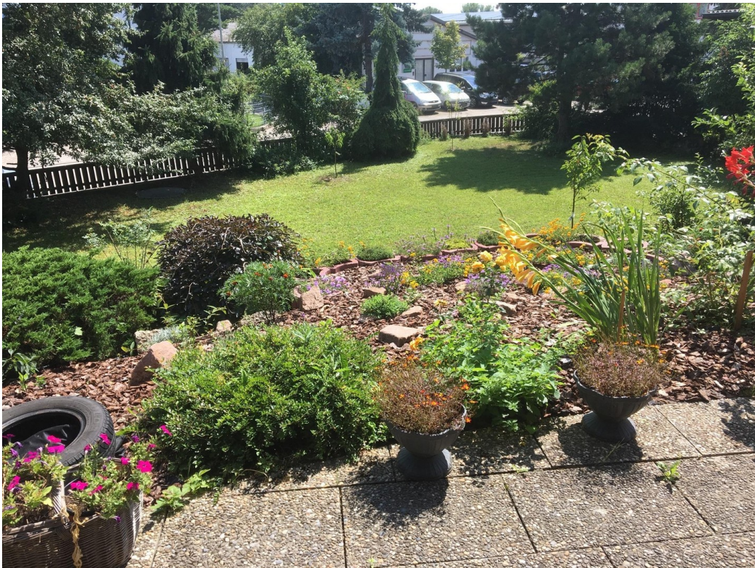
Großer Garten vorne