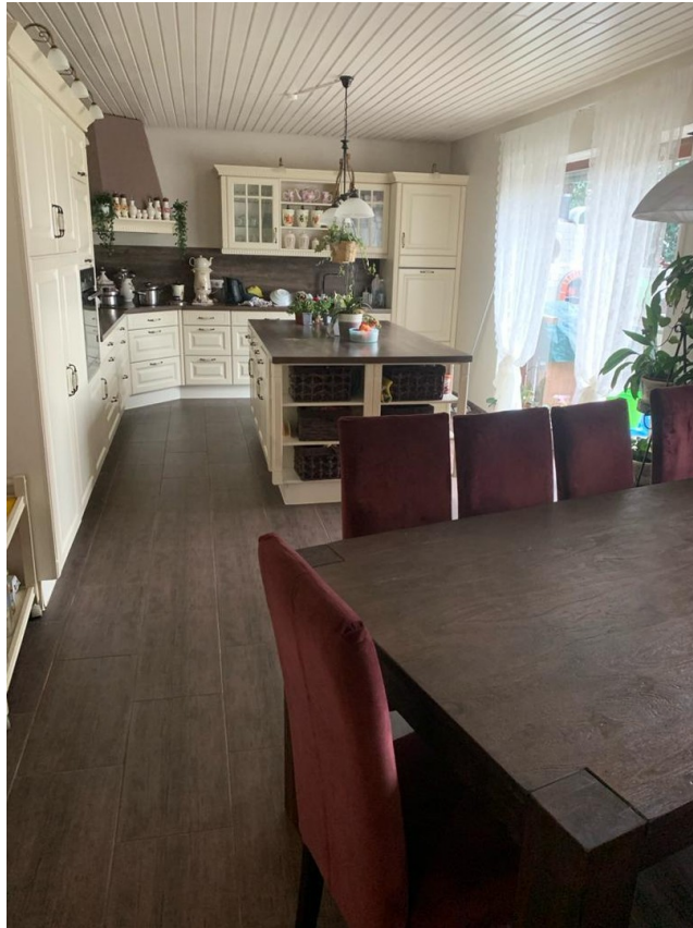
Küche und Essbereich