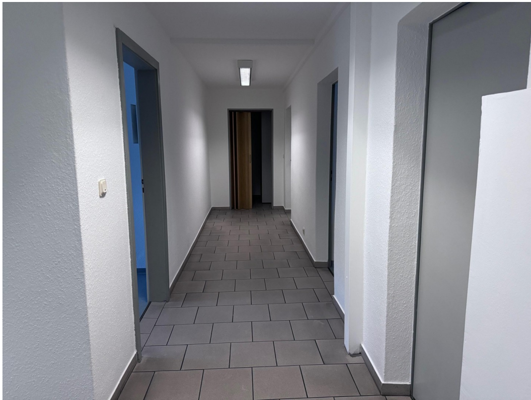
Flur zu den Büros