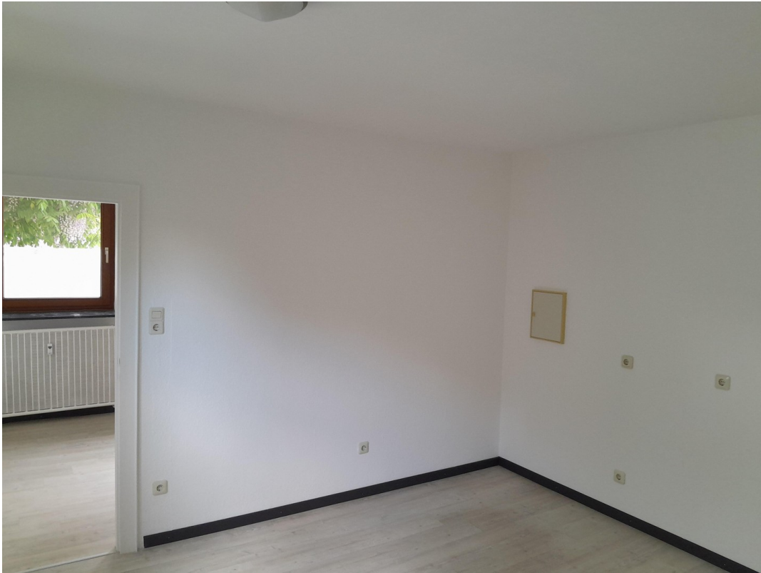
Raum 12 aktuell Bild 5