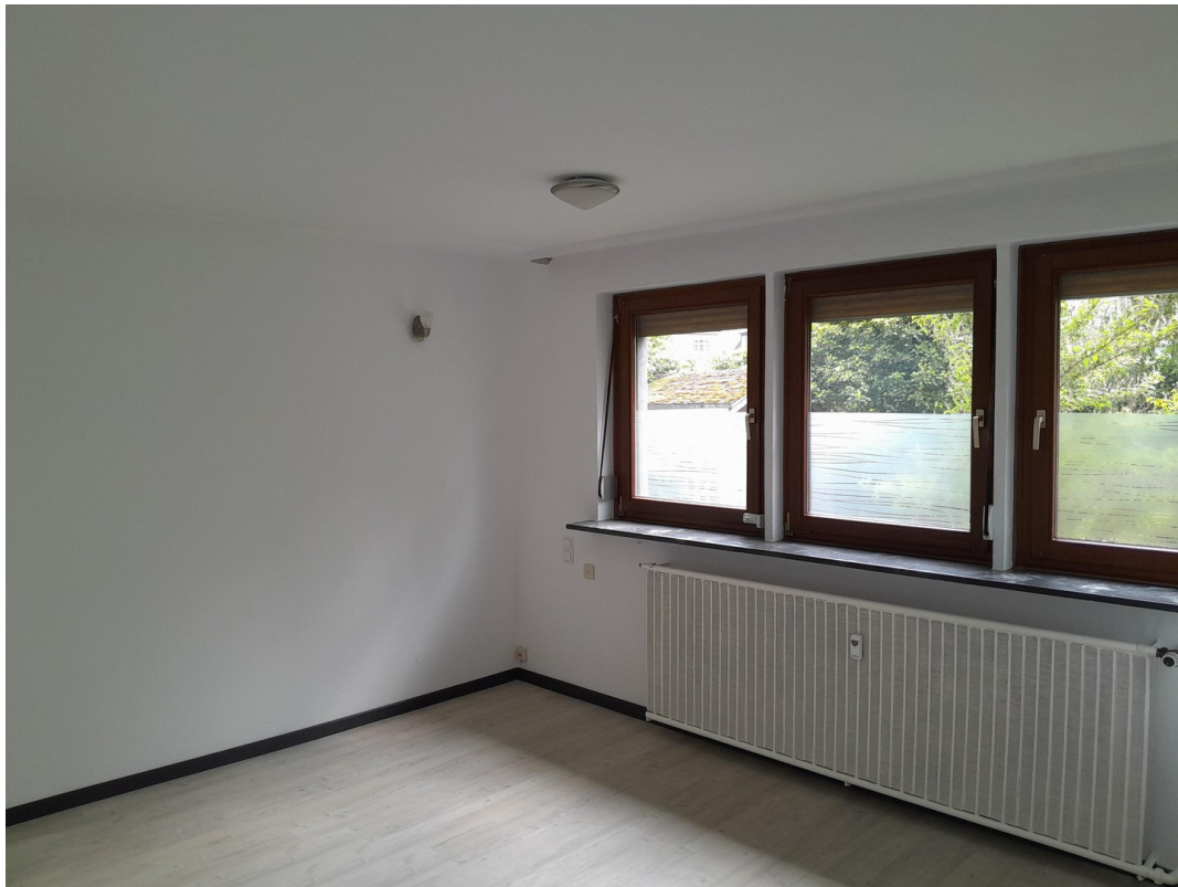
Raum 13 aktuell Bild 7