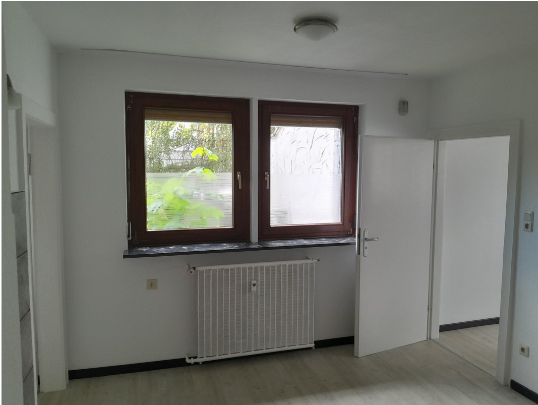
Raum 12 aktuell Bild 3