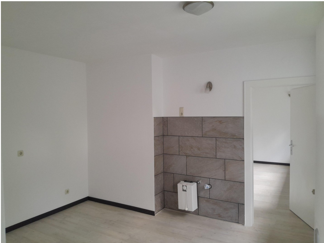
Raum 12 aktuell Bild 4