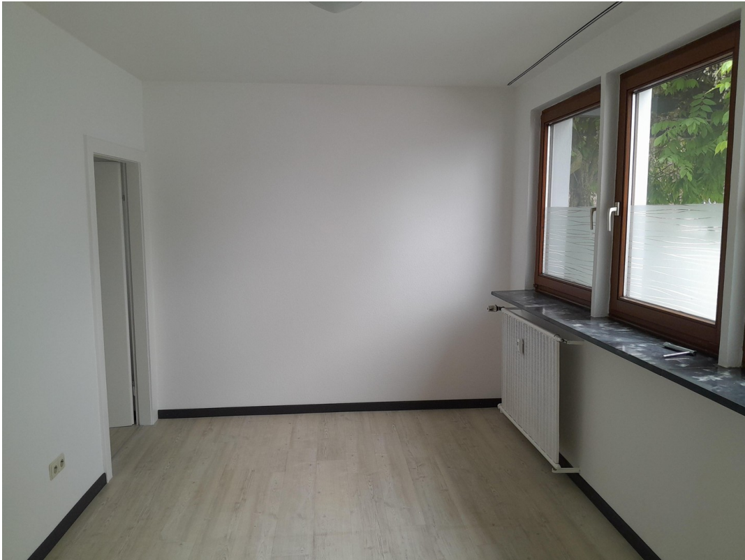
Raum 11 aktuell Bild 1