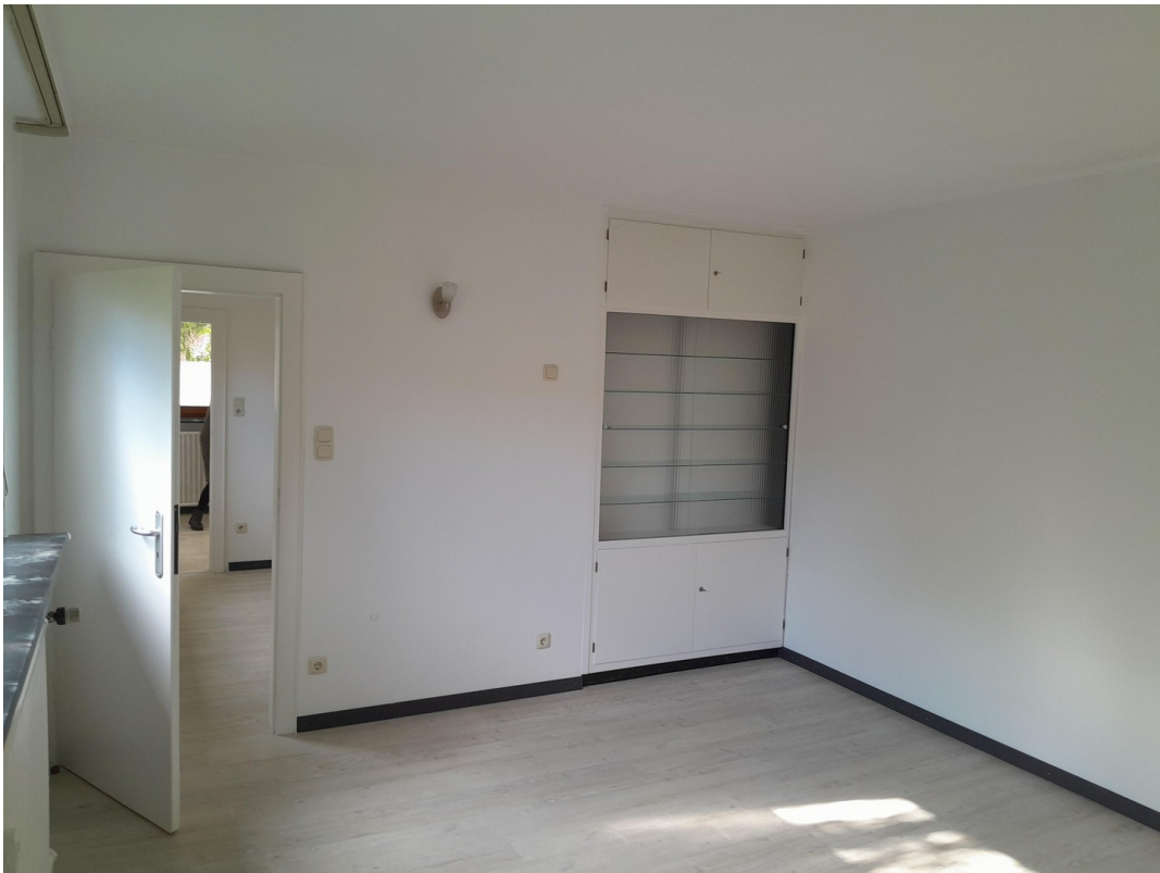
Raum 13 aktuell Bild 6