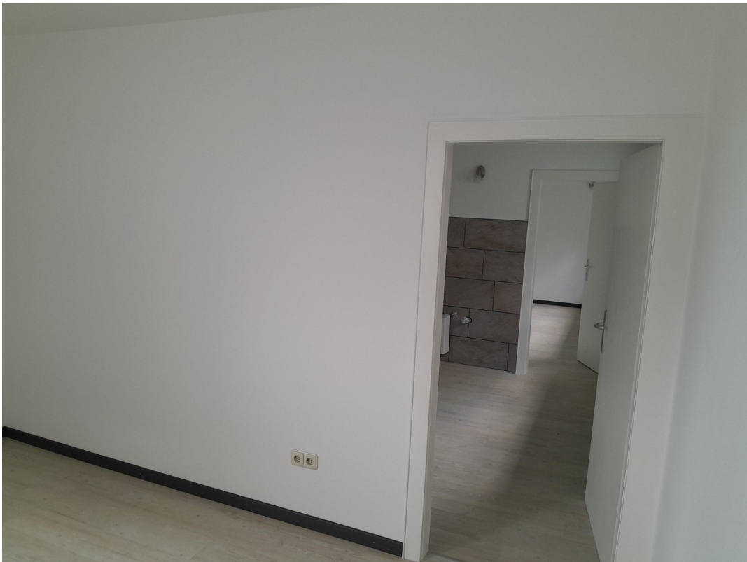
Raum 11-12-13 aktuell Bild 2