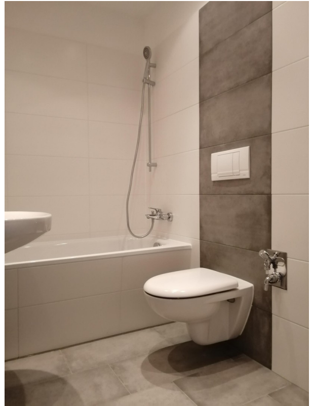
Badezimmer mit Wanne