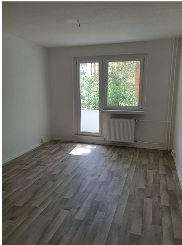
Wohnzimmer mit Balkon