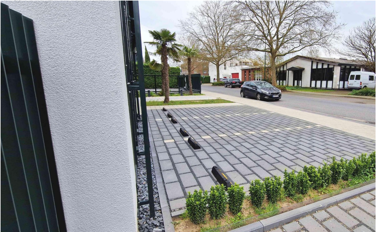
Parkplätze vor dem Haus