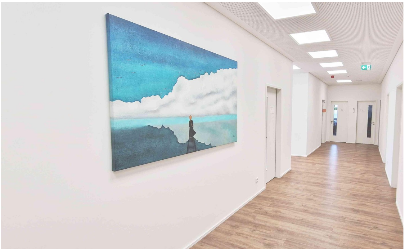
Flur OG hinten