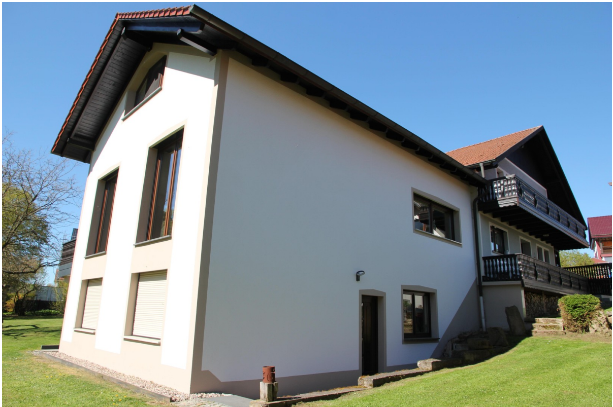
Wohnung 238 m 2 Bj. 2010