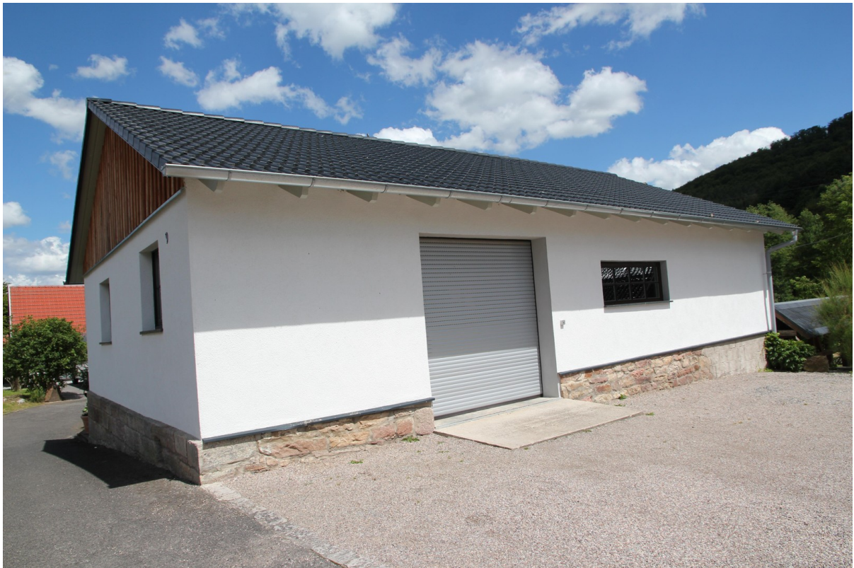
Garage für 3 Fahrzeuge