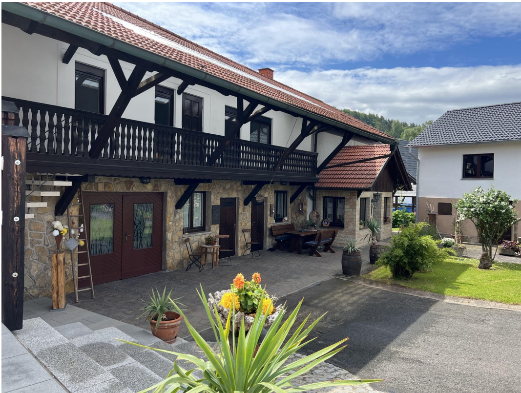
Hof und Eingang Nord-West