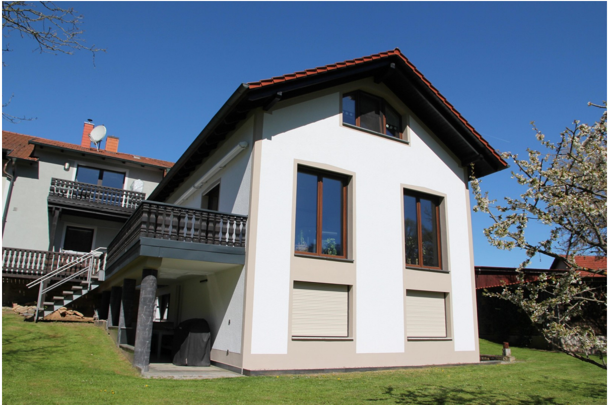
Wohnung 238 m 2 Bj. 2010