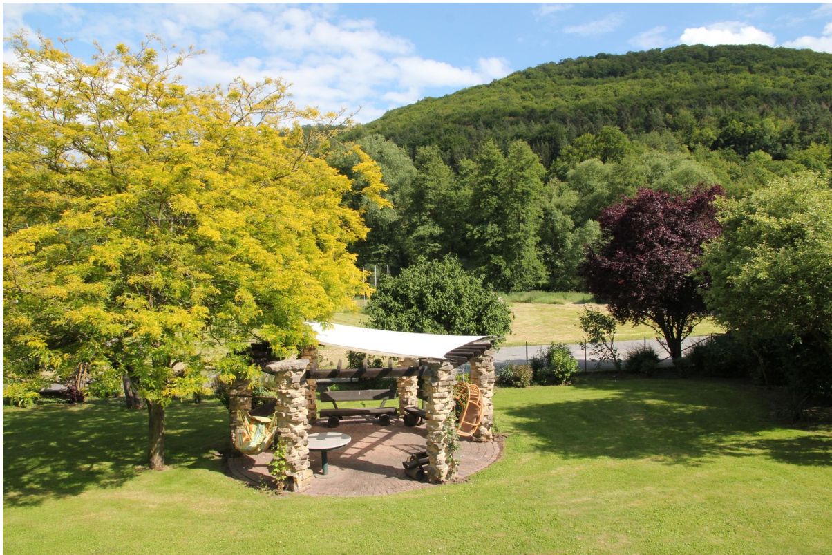
Garten am Wohnhaus