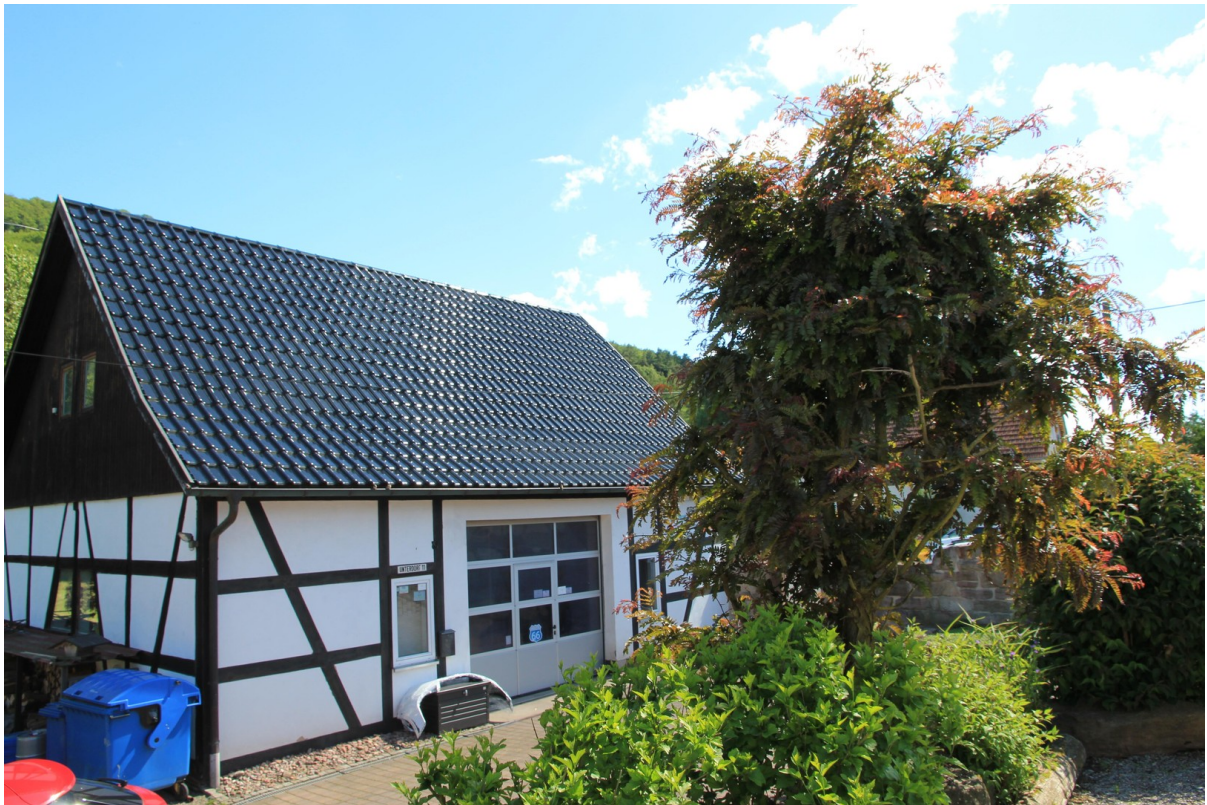
Werkstatt 11 x 9 m