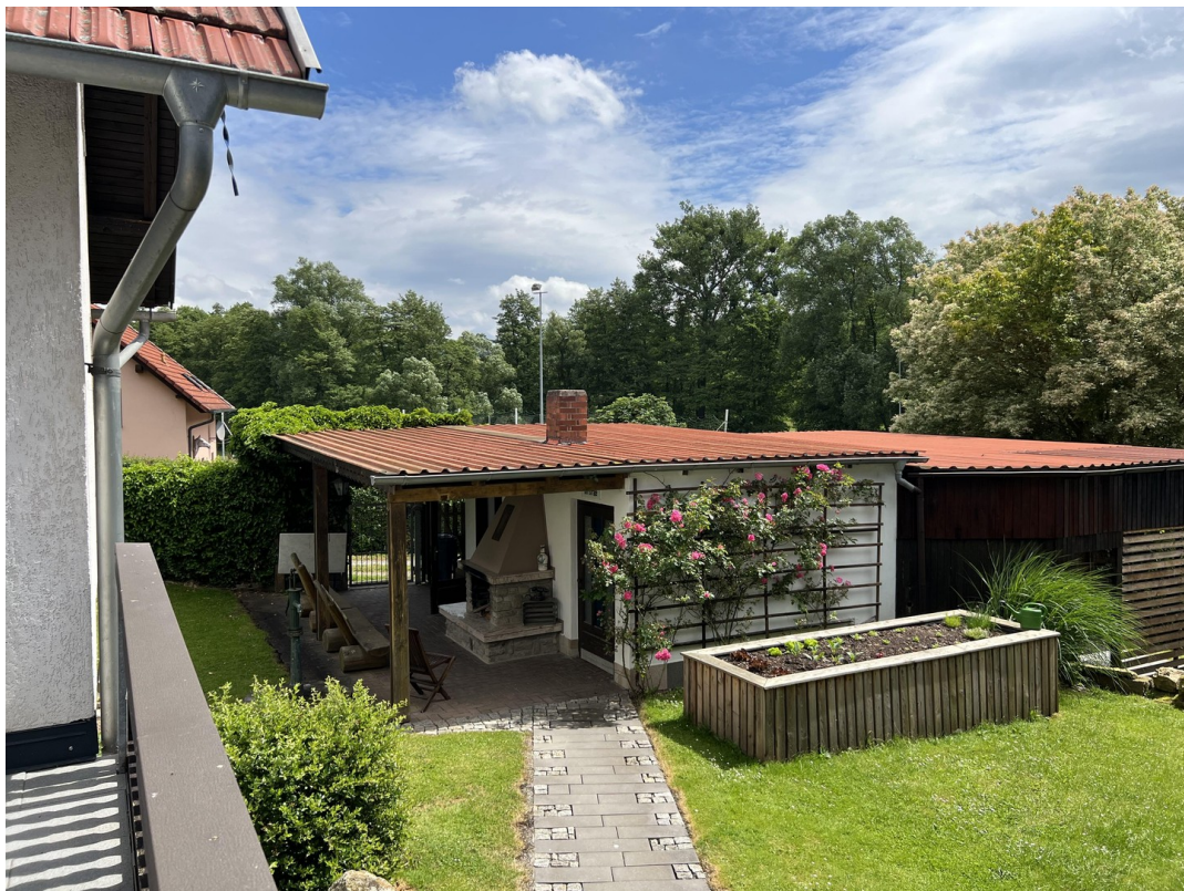
Nord - Osten