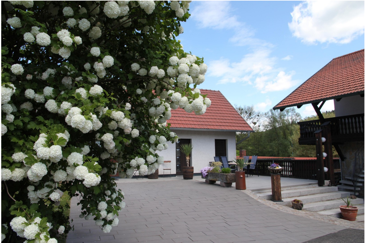
Ferienwohnung 56m 2 Bj. 1990