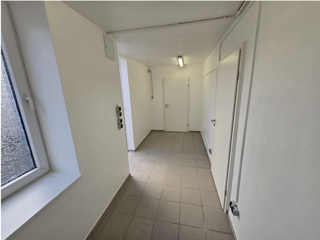
3. Raum zusätzl. Lager Eingang