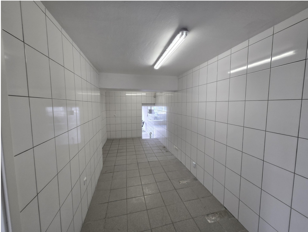
2. Raum Vorbereitung Küche