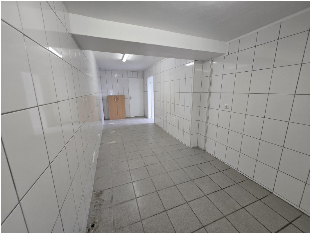
2. Raum Vorbereitung Küche