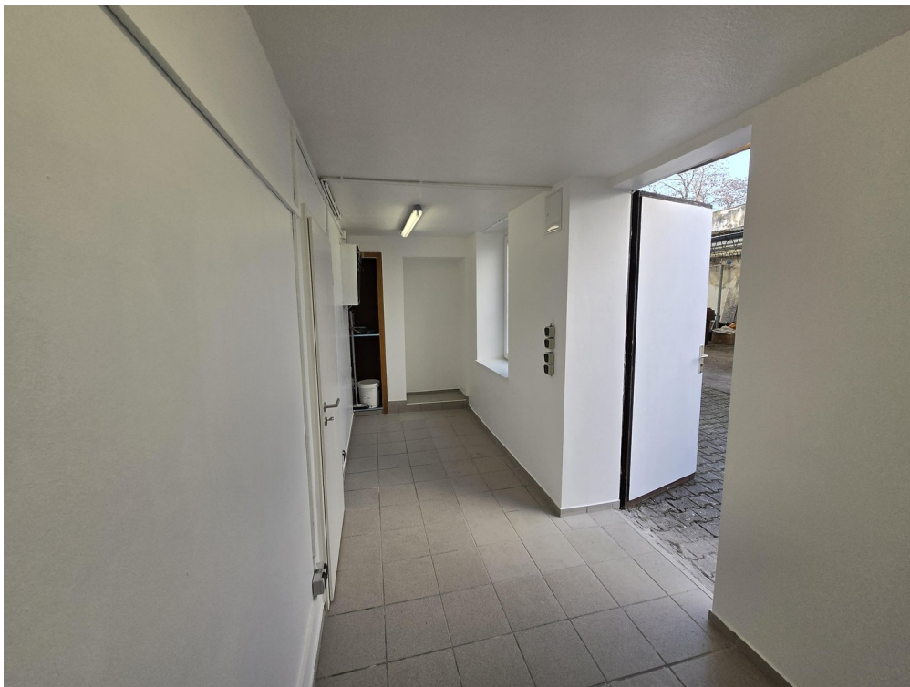
3. Raum zusätzl. Lager Eingang