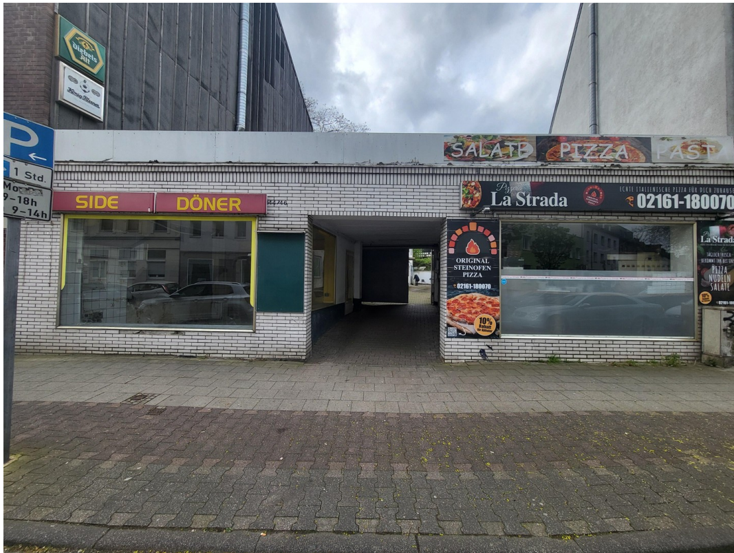
Pizzeria als Nachbar o. kompl