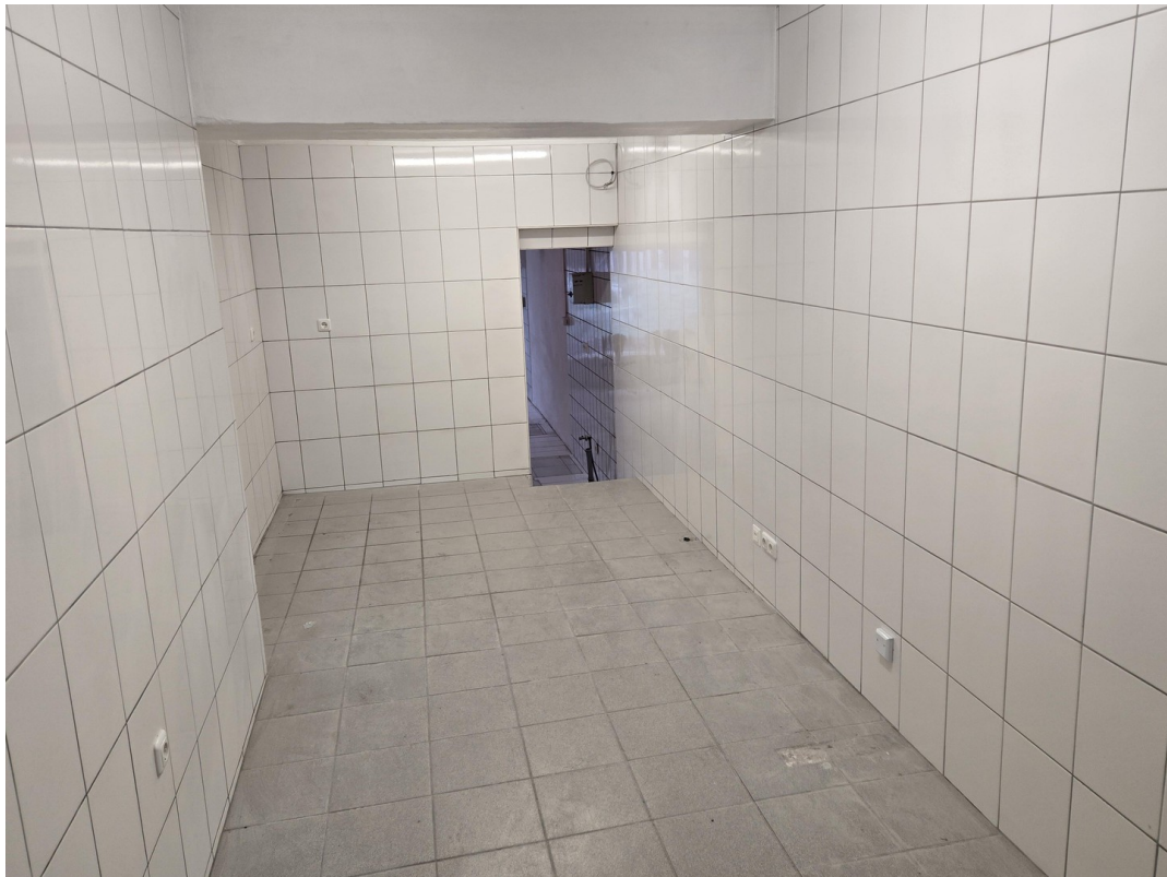
2. Raum Vorbereitung Küche