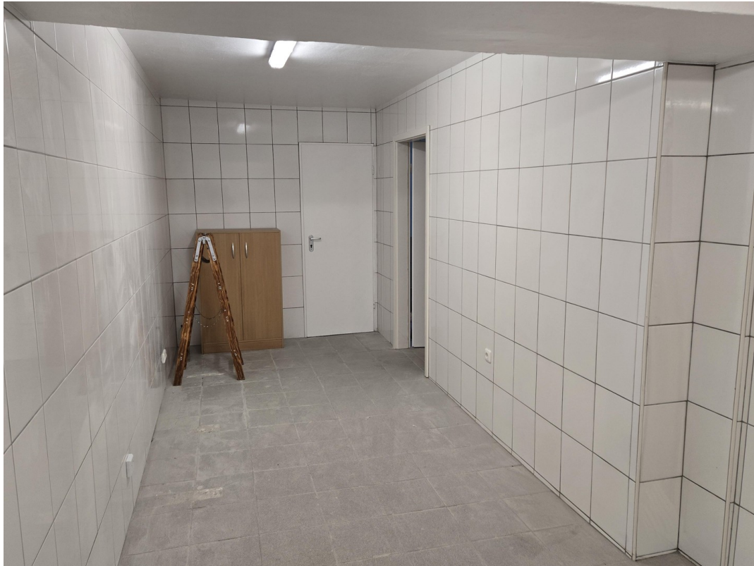
2. Raum Vorbereitung Küche