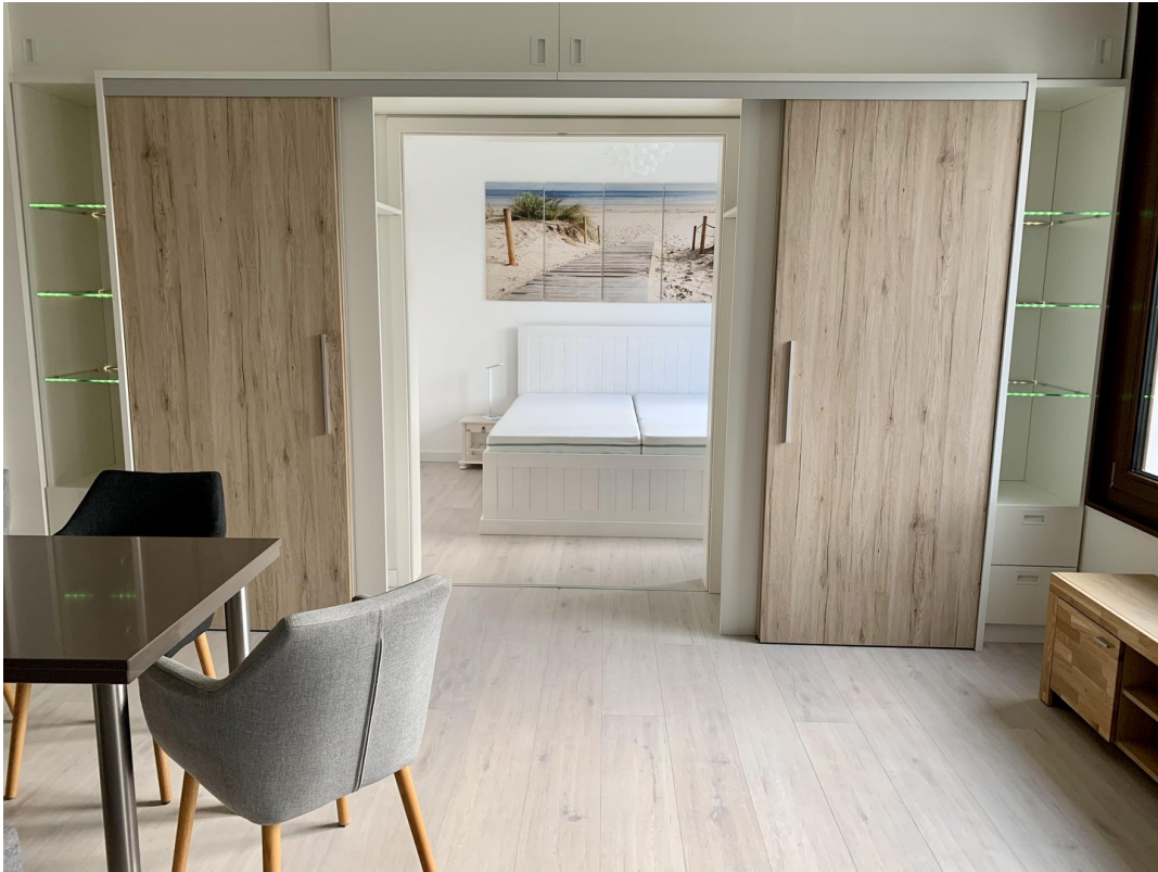
Schlafzimmer mit Schiebetür