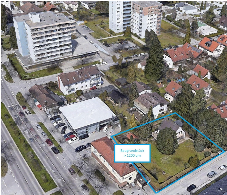
Grundstück mit Umgebung