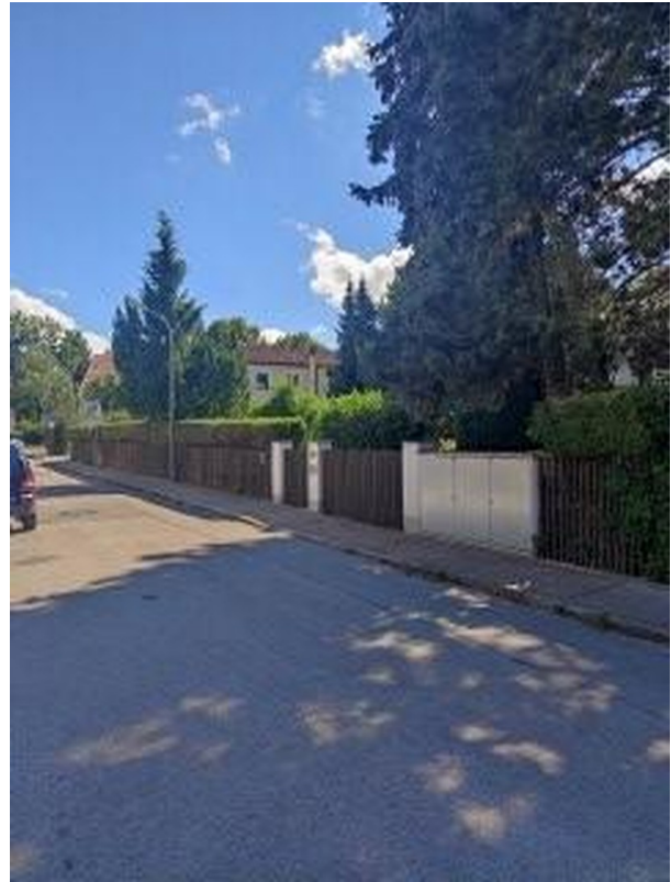
35m Straßenfront ruhige Lage